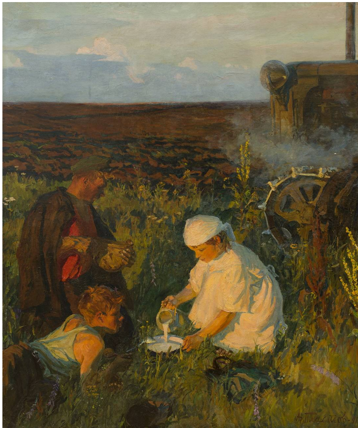
Рис. 1. Пластов А.А. Ужин трактористов. 1951. (Повторение 1961 г. хранится в ГТГ). Холст, масло. 203 × 170. Иркутский областной художественный музей им. В.П. Сукачева.

сообщает в Прислонику из Москвы: “Сегодня – особенный день, сегодня вернисаж в Третьяковке... У меня на выставке две работы, одна – девочка молоко наливает...”. Художник называл картину “Ужин трактористов” – “сияющая вечерняя”: “... от нее и вправду глаз нельзя оторвать, такая она эта вечерняя красивая...”» (Из письма к жене Наталье Алексеевне Пластовой от 20 декабря 1955. – Архив семьи художника) [2].