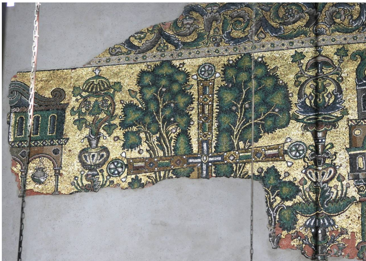
Рис. 5. Базилика Рождества Христова в Вифлееме. Мозаика. Крест и Поместный собор в Гангре. 1169 г.