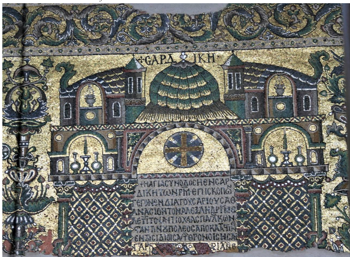
Рис. 4. Базилика Рождества Христова в Вифлееме. Мозаика. Поместный собор в Сардике. 1169 г.