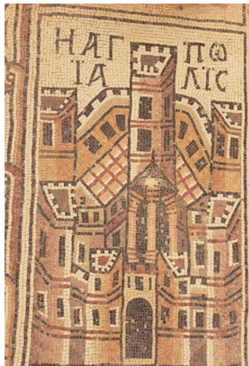
Рис. 11. Напольная мозаика церкви св. Стефана в Ум-эр-Расес. Иерусалим. 718–719 гг.

Так, в церкви св. Георгия в Мадабе VI в. н. э., открытой в 1894 г., на полу сохранилась мозаичная карта Святой земли, в центре ее – изображение Иерусалима и Вифлеема [4, s. 55–60, Taf. 5; 7, p. 128–131, 263–271, fig. 17–27]. На плане Иерусалима читаются храм Гроба Господня, улица Кардо, многочисленные ворота. Иерусалим как Святой град представлен также в церкви св. Стефана (718–719 гг.) в Ум-эр-Расес [15, p. 327–364; 7, fig. 44] (рис. 11). В этих памятниках вновь города Святой земли представлены как объекты средневекового паломничества. Вероятно, такого рода изображения Иерусалима в топографических мозаиках иорданских храмов могли также в некоторой мере послужить прототипами средневизантийской иконографии Святого Града и для сцены Входа в Иерусалим.