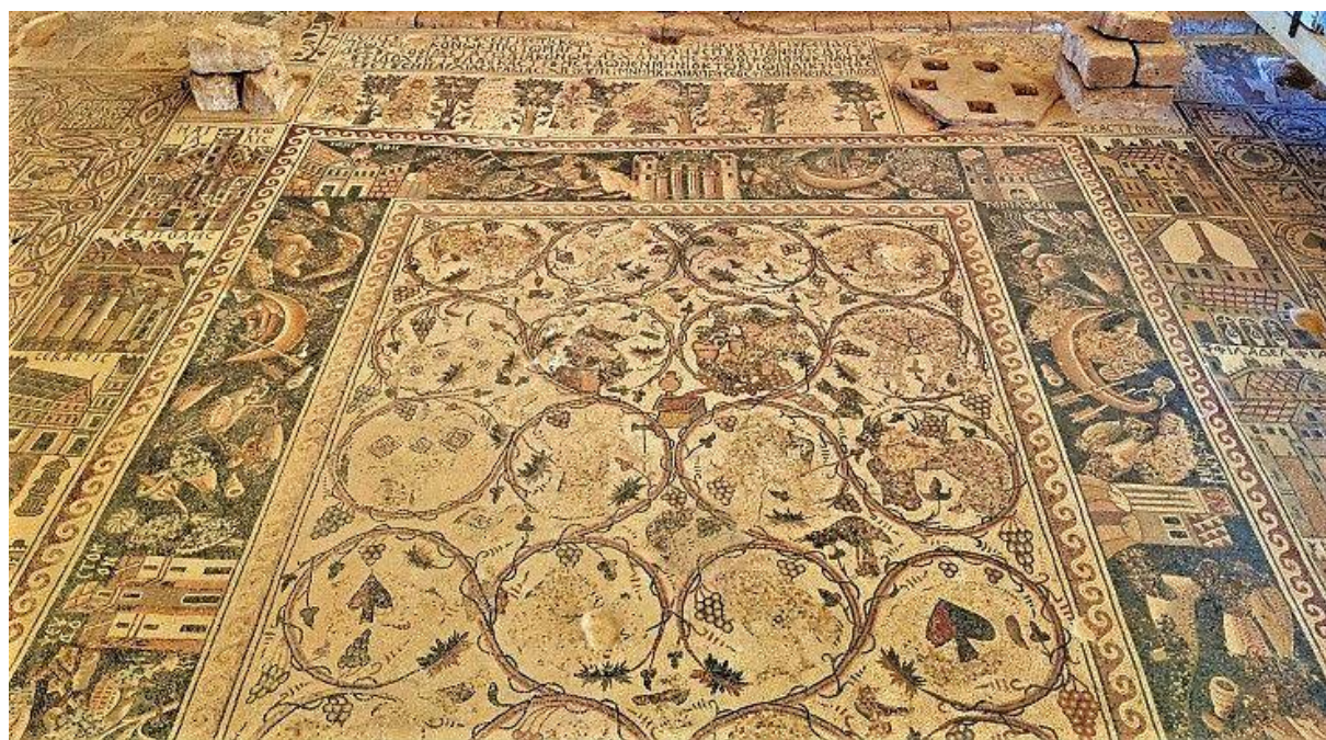
Рис. 8. Напольная мозаика церкви св. Стефана в Ум-эр-Расес. 718–719 гг.

В церкви Св. Стефана в Ум-эр-Расес (Кастром Мефа'а), 718–719 гг., после 1986 г. был открыт крупнейший на этой территории мозаичный комплекс декорированного пола. Одна из прямоугольных рам, включающая цикл изображений городов региона, расположенных в ней по вертикали и горизонтали, окружает средник ансамбля [15, р. 327–364; 7, р. 145–149, 289–311, fig. 45–73] (рис. 8). Весь топографический цикл, несомненно, связан с маршрутами паломничества по святым местам: в изображении каждого из городов выделены самые знаменитые святыни.