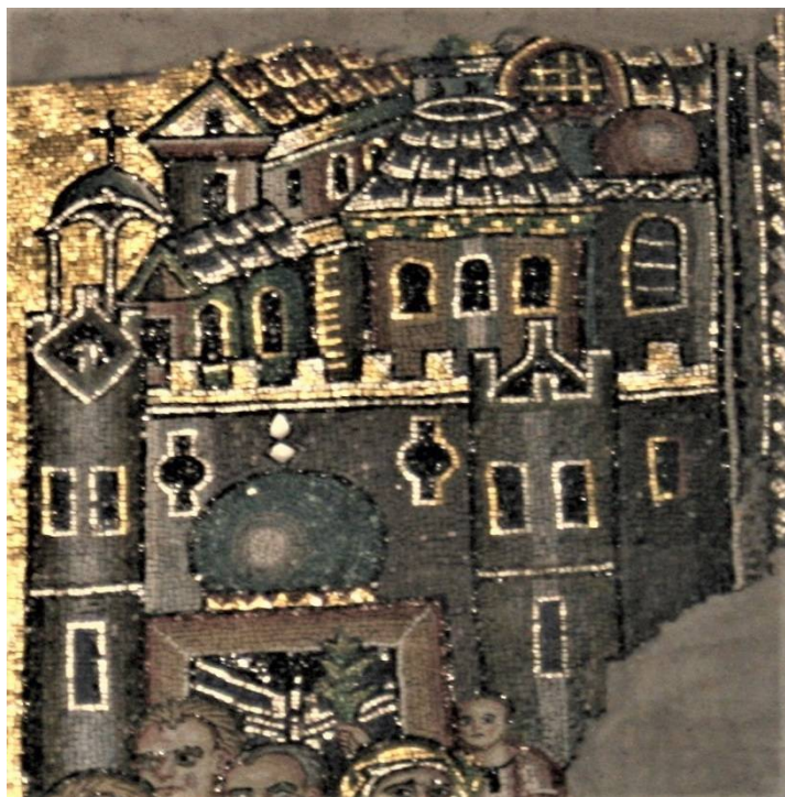
Рис. 10. Базилика Рождества Христова в Вифлееме. Мозаика восточной стены южной части трансепта. Иерусалим, фрагмент «Входа в Иерусалим». 1169 г.

в Палатинской капелле в Палермо около 1143–1150 гг. (?). Однако в сицилийском памятнике мы видим более схематичное изображение города [2, т. 2, ил. 382]. В Вифлееме имело особое значение почитание святых мест, соответственно, прежде всего это касалось и образа Иерусалима. Его изображение в вифлеемской монументальной мозаике также плодотворно сопоставить с образами Святого града в напольных циклах городов Иордании доиконоборческого времени.