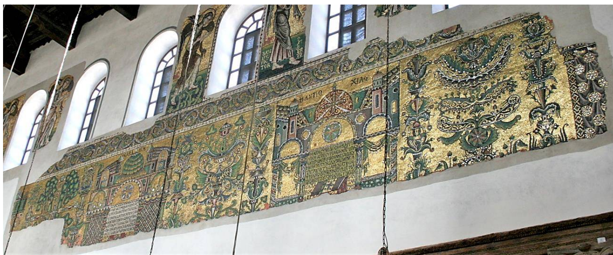
Рис. 2. Базилика Рождества Христова в Вифлееме. Мозаики северной стены центрального нефа с изображением Поместных соборов. 1169 г.

На северной стене размещен цикл также древних шести Поместных соборов. Из них полностью сохранились мозаики, где представлены два из них: Антиохийский (268 г.) и Сардикийский (342 г.), кроме того, уцелели небольшие фрагменты изображений еще двух соборов: Анкирского (314 г.) и Гангрского (около 340–342 гг.) [11, р. 59–104] (рис. 2–5). Весь цикл шести Поместных соборов северной стены был отображен на гравюре Дж. Дж. Чьямпини 1683 г. [9, р. 79, fig. 8] (рис. 6). Цикл включал еще два утраченных образа Карфагенского (251 г.) и Лаодикийского (до 380 г.) соборов [11, р. 59–104, 152–157].