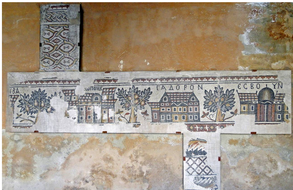
Рис. 9. Фрагмент напольной мозаики церкви на Акрополе в Маине. 719–720 гг.

Но особенно важна в интересующем нас контексте церковь на Акрополе в Маине с топографическим циклом в напольных мозаиках 719–720 гг. В этом памятнике рама расположена вокруг центрального прямоугольника таким образом, что образы городов по всему периметру образуют горизонтальный фриз и каждый из них фланкирован растительными мотивами в виде деревьев [4, р. 72–73. 216–219; 7, р. 132–135, 312–323, fig. 74–85] (рис. 9). Мы вновь возвращаемся к тому, что подобная иконография городов в топографических напольных мозаиках получила особое распространение в VIII в., часть памятников создана в эпоху формирования иконоборчества, незадолго до него, как в Ум-эр-Расес и Маине, в чем очевидна связь с актуальностью аниконического искусства именно в этот период. Вполне закономерно, если такого рода циклы напольных мозаик Святой земли послужили одним из источников аниконического цикла монументальных мозаик северной стены центрального нефа базилики Рождества Христова в Вифлееме.