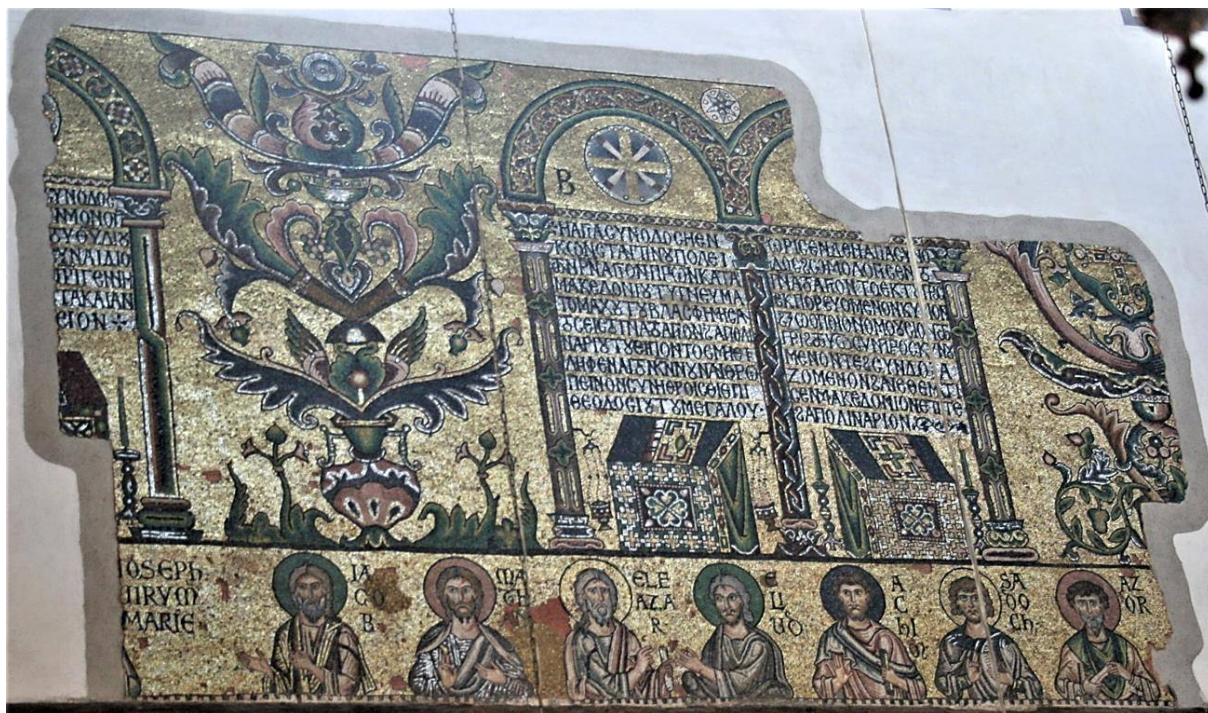
Рис. 1. Базилика Рождества Христова в Вифлееме. Мозаики южной стены центрального нефа с изображением Вселенских соборов и предков Христа. 1169 г.

На северной стене размещен цикл также древних шести Поместных соборов. Из них полностью сохранились мозаики, где представлены два из них: Антиохийский (268 г.) и Сардикийский (342 г.), кроме того, уцелели небольшие фрагменты изображений еще двух соборов: Анкирского (314 г.) и Гангрского (около 340–342 гг.) [11, р. 59–104] (рис. 2–5). Весь цикл шести Поместных соборов северной стены был отображен на гравюре Дж. Дж. Чьямпини 1683 г. [9, р. 79, fig. 8] (рис. 6). Цикл включал еще два утраченных образа Карфагенского (251 г.) и Лаодикийского (до 380 г.) соборов [11, р. 59–104, 152–157].