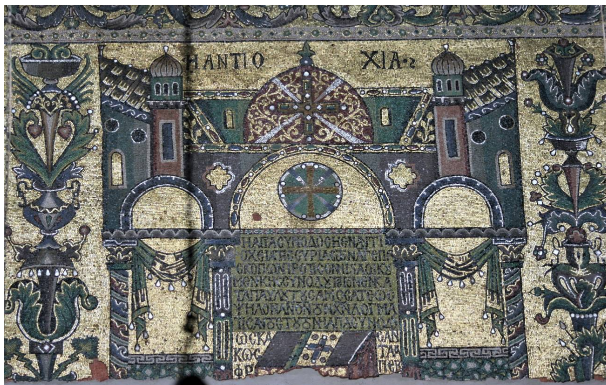
Рис. 3. Базилика Рождества Христова в Вифлееме. Мозаика. Поместный собор в Антиохии. 1169 г.