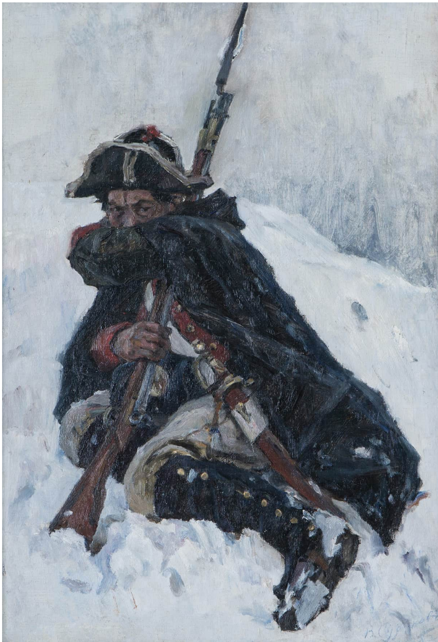
1. В.И. Суриков. Солдат с ружьем, закрывший лицо рукой. Этюд к картине «Переход Суворова через Альпы». 1898. Холст, масло. 66 x 45. Иркутский областной художественный музей им. В.П. Сукачёва