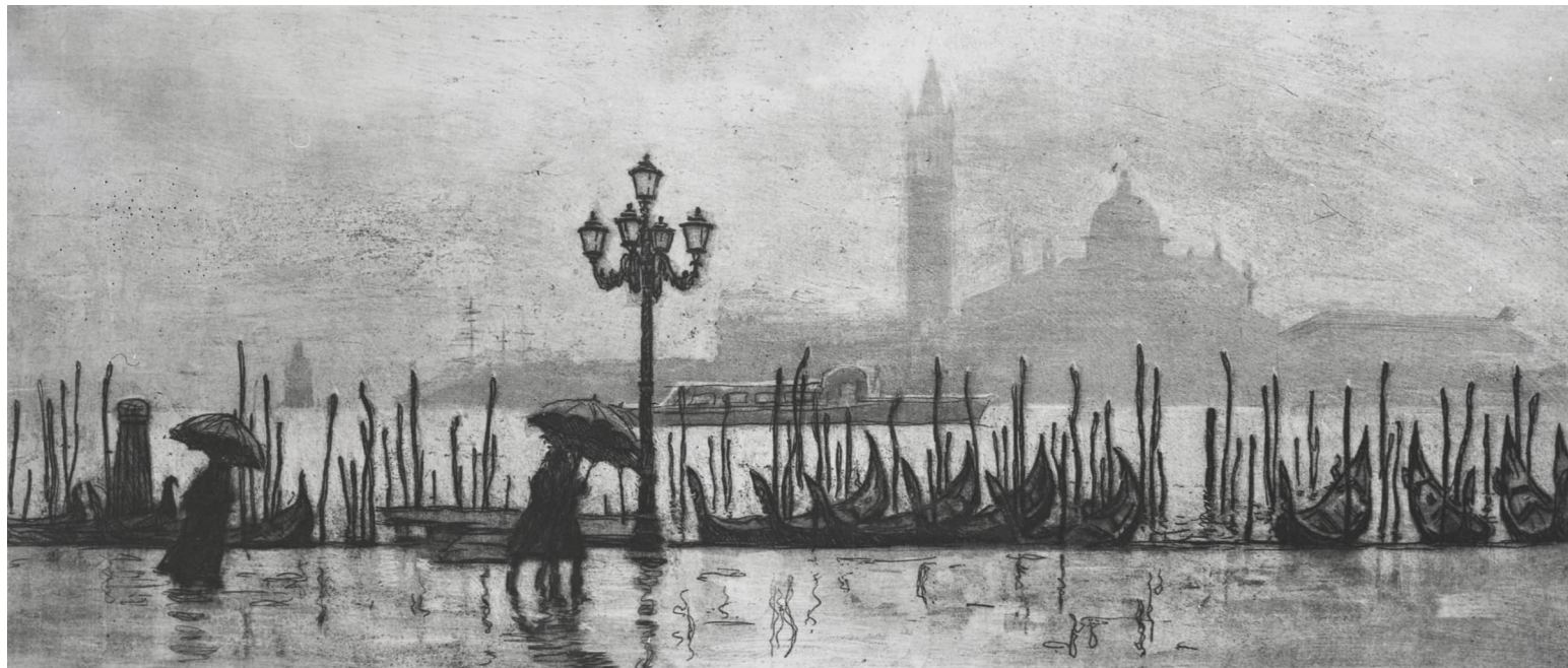
3. Ю.М. Непринцев. Дождливая Венеция.