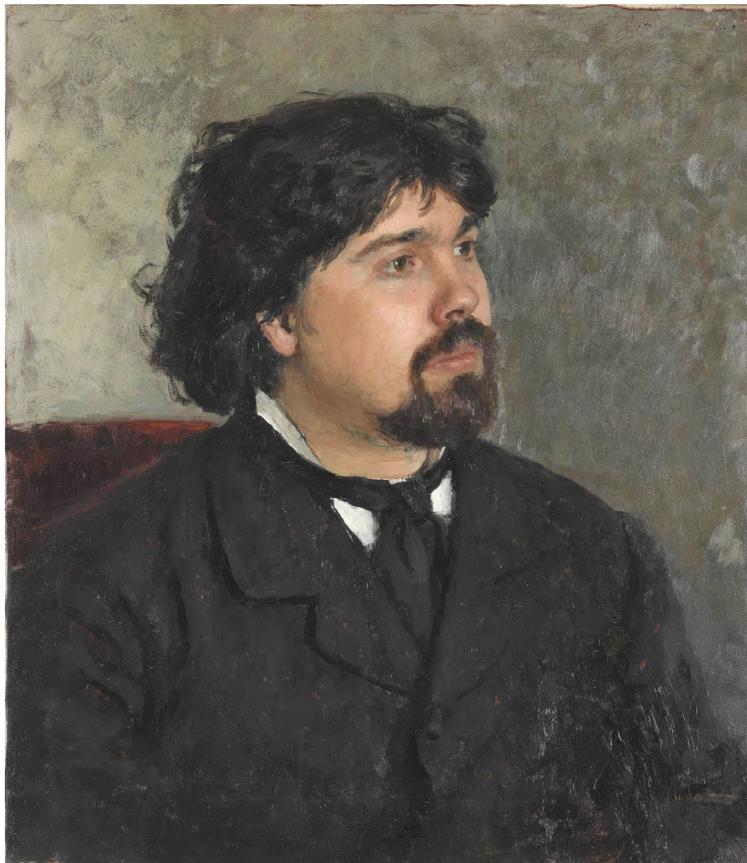
2. И.Е. Репин. Портрет В.И. Сурикова. 1977. Холст, масло. 62,5 x 54. Государственная Третьяковская галерея.