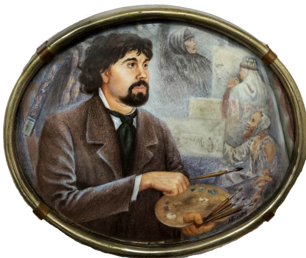
3. Б.М. Михайленко. Суриков В.И. 1983. Медь, эмаль, мельхиор; живопись по эмали, пайка. 8 x 9,5 x 1. Государственный музей-заповедник «Ростовский кремль».