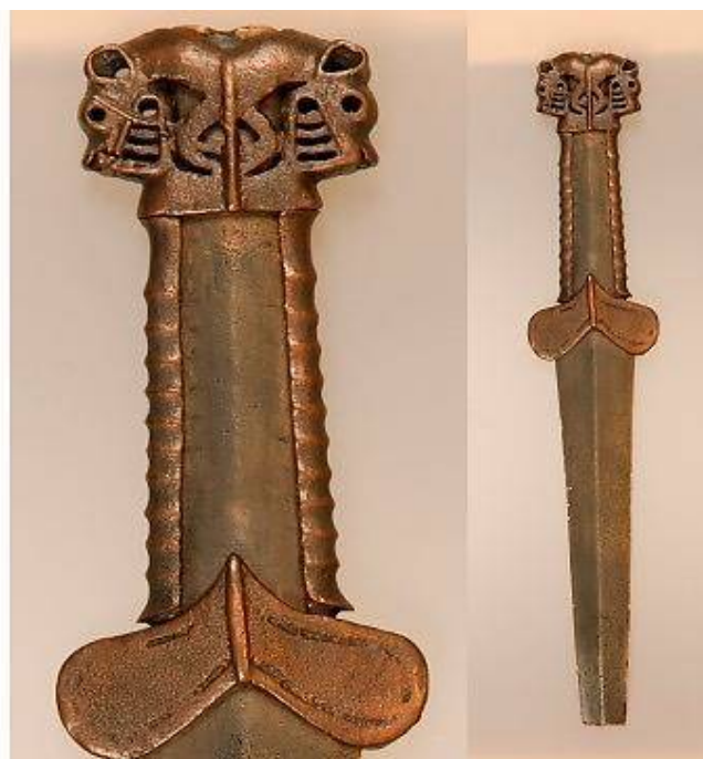
Рис. 3. Изображения хищника (волка) на предметах. 1 – на седельных подвесках из войлока: а – памятник Ак-Алаха, кург. № 1; б – памятник Башадар, кург. № 2 [2, с. 231, табл. СХХI, 1,2]); 2 – на навершии кинжала (Прибайкалье. Случайная находка МИБ нвф 1233/1). Фото: С.П. Ильина, 2006 г.