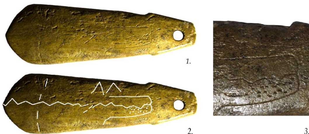
Рис. 1. Могильник Черемуховая падь. Подвеска из рога с изображением головы хищника (волка/собаки). 1. Общий вид изделия. 2. Общий вид с прорисовкой. 3. Макрофото части хищника, увеличение в 5 раз. Место хранения: МИБ ОФ-18671/2.

Подвеска 1 представляет собой изделие из рога, размеры 53,30 x 16,98 x 3,26 мм, диаметр отверстия 3,45 мм (рис. 1). Предмет выполнен из тонкой пластины, вытянутой каплевидной формы. Верхний конец предмета имеет конвергентный, зауженный спрямленный выступ. Чуть ниже отверстия отмечены мелкие пологие боковые уступчики (плечики).