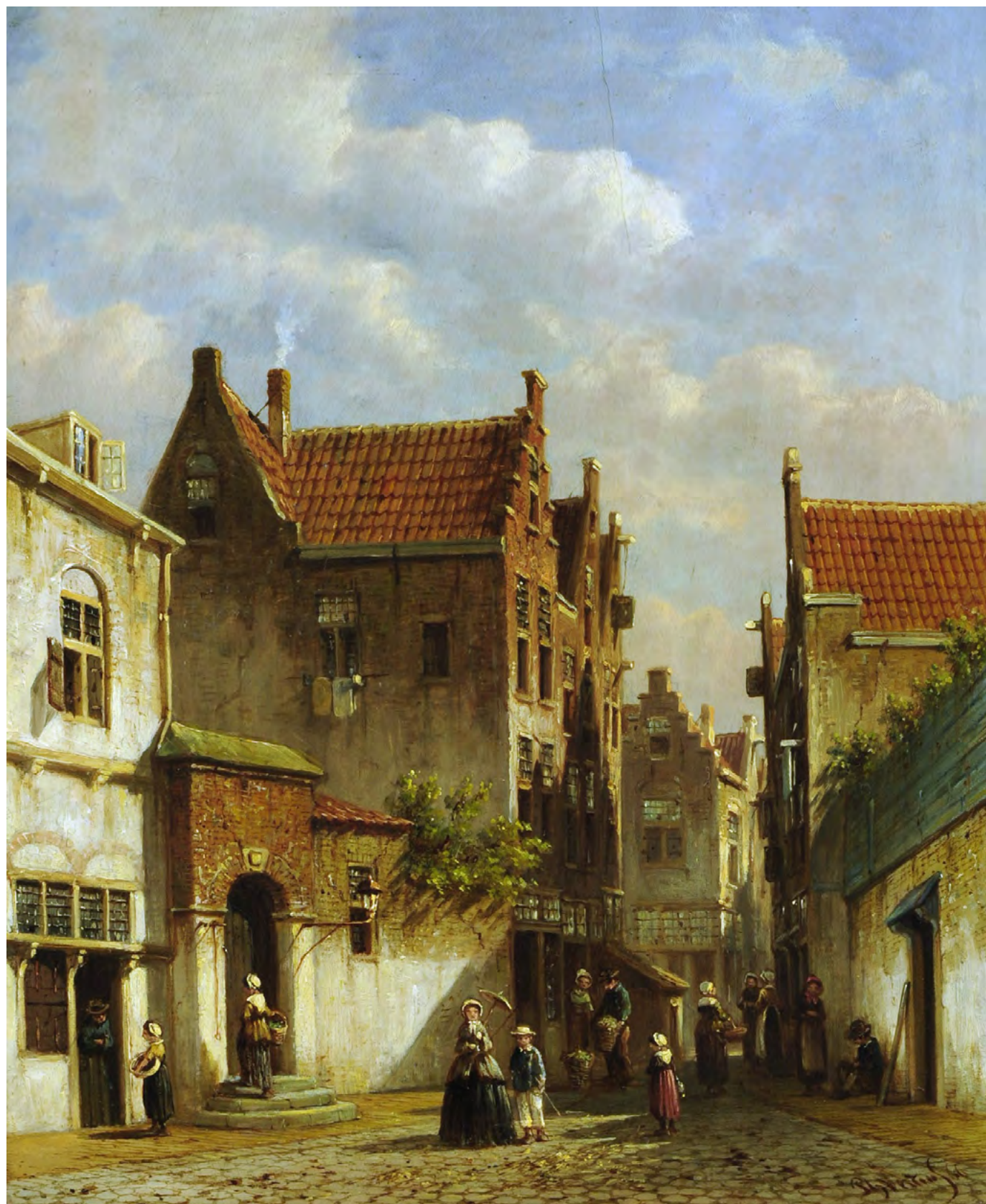
3. П.Г. Вертин. Городской пейзаж. 1866. Дерево, масло. 36 x 29,5. Саратовский государственный художественный музей имени А.Н. Радищева. Инв. Ж-1751