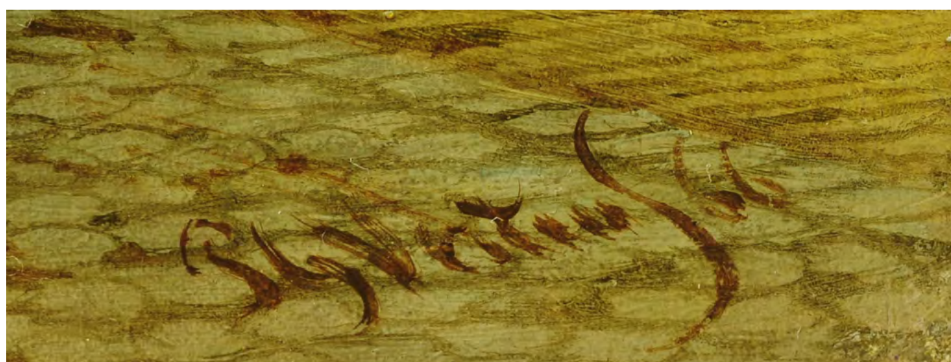
4. П.Г. Вертин. Городской пейзаж. 1866. Инв. Ж-1751. Подпись и дата