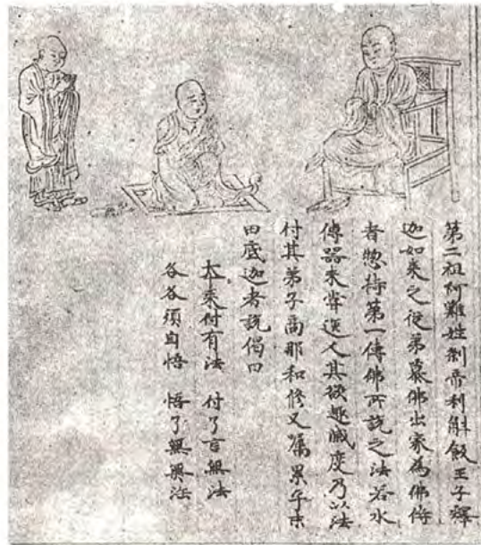
6. Ананда. Изображение 1761 г.