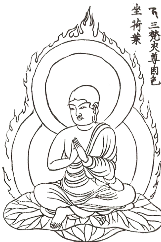
1. Ананда. Изображение в мандале Гарбхатхату 806 г.

В монгольском Ганджуре 1717–1720 гг. (монг. Ананда) он представлен сидящим, в правой руке — посох хаккара, в левой — чаша в мудре дхаяна. Таким же образом изображены Шестнадцать Шравиков (ученики — «слушатели» Будды, достигшие уровня архата. — Прим. перев.) [там же, с. 130].