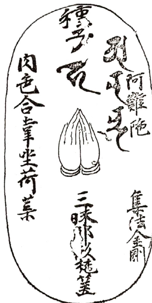
2. Ананда. Изображение в свитке Chojo mandara