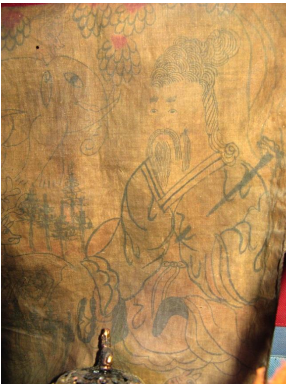
Рис. 6. Цаган Аав. Западная Монголия. Булган.