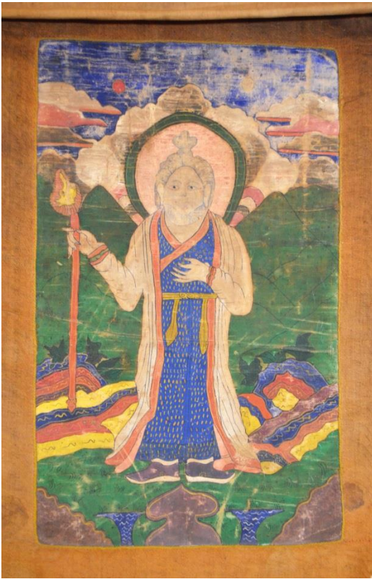
Рис. 4. Цаган Аав.