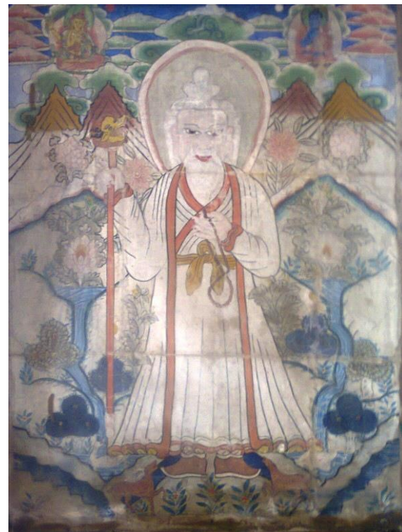
Рис. 7. Цаган Аав. Частная коллекция, Калмыкия.