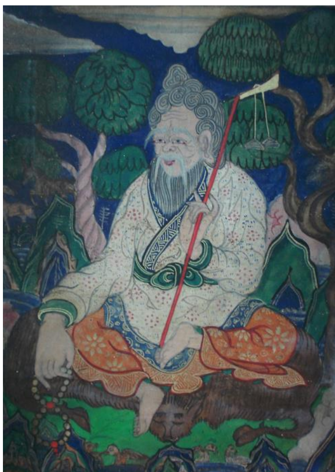
Рис. 2. Цаган Аав. Западная Монголия, Давст.

Отсутствие их в степном ландшафте не мешает верующим Калмыкии сооружать искусственные насыпи, совершая традиционную обрядность. Поэтому особую значимость в культовой практике калмыков обретают одинокие деревья в степи, воспринимаемые естественной вертикалью, соединяющей исходные начала традиционного мироощущения – Землю и Небо – в мироздании кочевника. Красноречивое свидетельство единых истоков культур, сегодня разделенных огромным расстоянием.