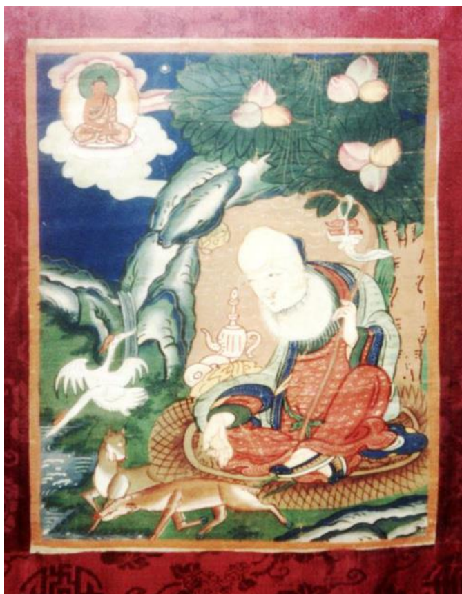
Рис. 3. Цаган Аав. Монголия.

Своеобычны детали дербетского образа, найденного в сомоне Давст: босой, сидит на шкуре в окружении животных и птиц, каноничных для иконографического сюжета, другой вариант представляет собой хорошо известную китайскую интерпретацию живописного образа Шоу Сина. Располагается изображение Цаган Аав, датируемое рубежом XIX–XX вв., рядом с образом Белой Тары в алтарной верхней части жилища.