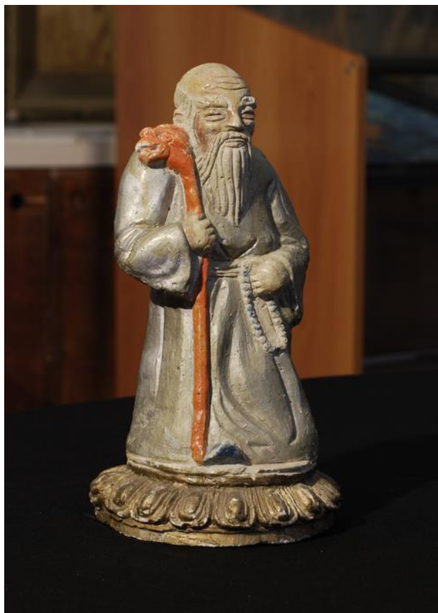
Рис. 1. Белый Старец. Коллекция Калмыцкого института гуманитарных исследований Российской академии наук (далее – КИГИ РАН).

колорита. Все это обуславливает локальную специфику иконографии в «своём» составе пантеона, позднем варианте центрально-азиатского.