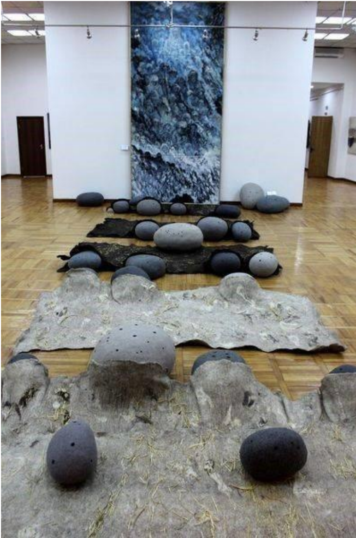
Рис. 7. В. Руппель. «Молчание войлока». 2014.

Обращение к традиционному искусству, подпитываемое живым народным творчеством, общением с носителями, помогает понимать и распознавать секреты прошлого, ценить корни и быть невидимым мостиком будущего для следующих поколений. Будущее войлока можно с уверенностью описать в позитивных тонах, он умеет увлечь и влюбить в себя раз и навсегда.