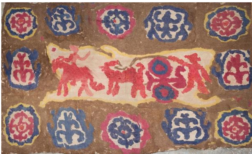
Рис. 1. Дж. Уметов. «Весенние мотивы». 1976. Бишкекский музей изобразительных искусств.

Интерес к войлоку в советский период был возрожден первым художником-прикладником Джумабаем Уметовым. Он, используя древнейшие технологии изготовления традиционных ала-кийизов (войлок, техника вваливания), чиев (тростник, декорированный цветной шерстью), начинает работать с войлоком как с холстом и красками.