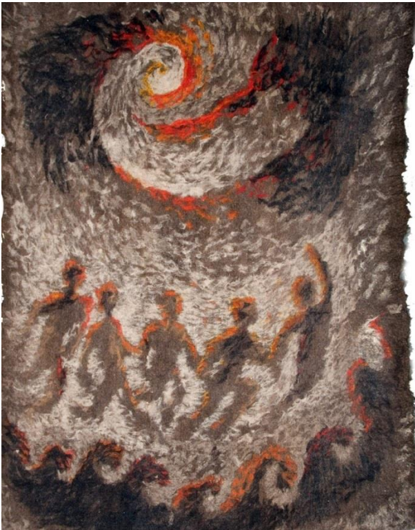
Рис. 5. Р. Акматова. «На Иссык-Куле». 1984.