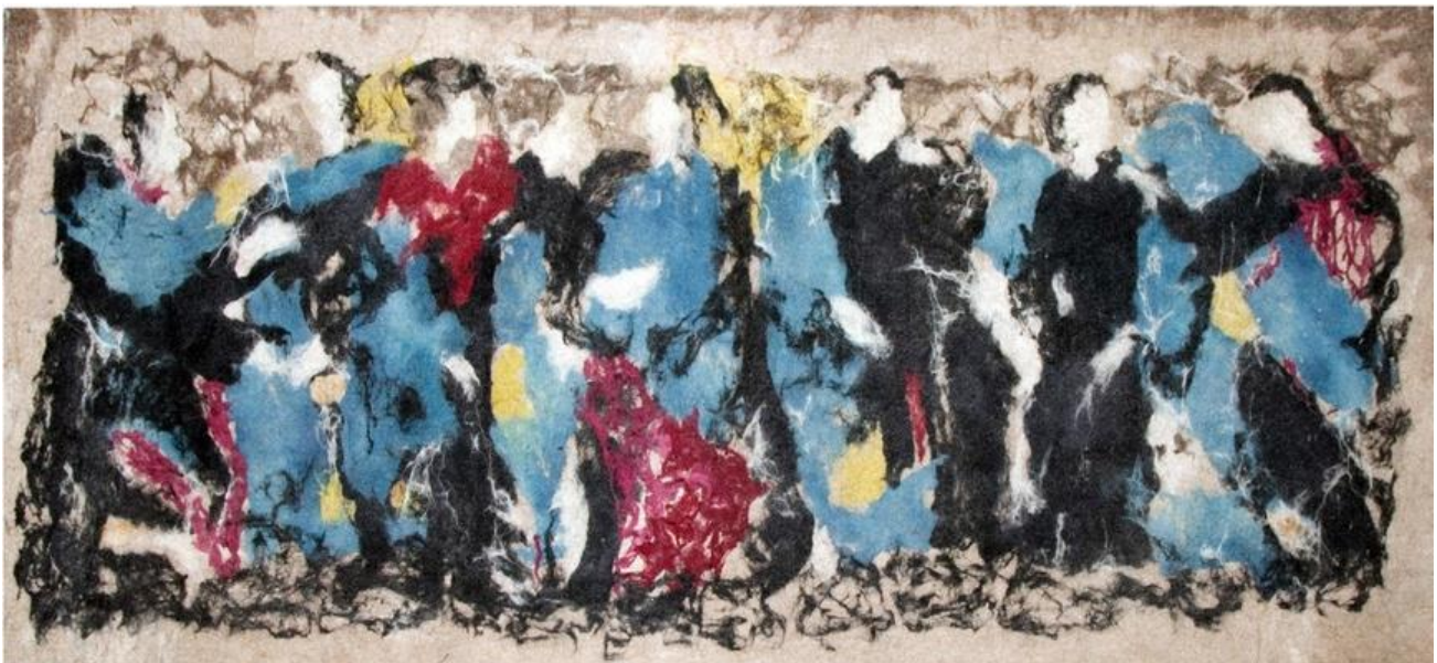
Рис. 6. Р. Акматова. «Разногласия». 1989.

Как доказательство вышеприведенных слов – инсталляция «Молчание войлока» (рис. 7): скромная, скупая и бессодержательная красота природных форм, отмеченная астрономическими «знаками вечности», раскрывает пространство и открывает новые горизонты целостного восприятия ландшафта во всей полноте. Войлок стал объектом, средством выражения новых форм искусства нынешнего времени.