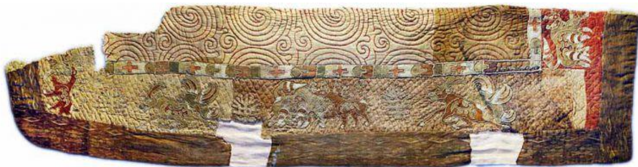
Рис 1. Войлочный ковер – ширмэл. Захоронение Ноён уул. 2,6 x 1,95 см.

При изучении традиции изображения зооморфных образов можно прийти к интересным результатам. Так, любопытные образы, подходы к их художественному решению можно увидеть в произведениях «классического ремесленного искусства гуннов из долины Орхона. В качестве примера можно привести войлочный ковер – ширмэл длиной 2,6 и шириной – 1,95 см, найденный в захоронении Ноён уул» [1, с. 16] (рис. 1).