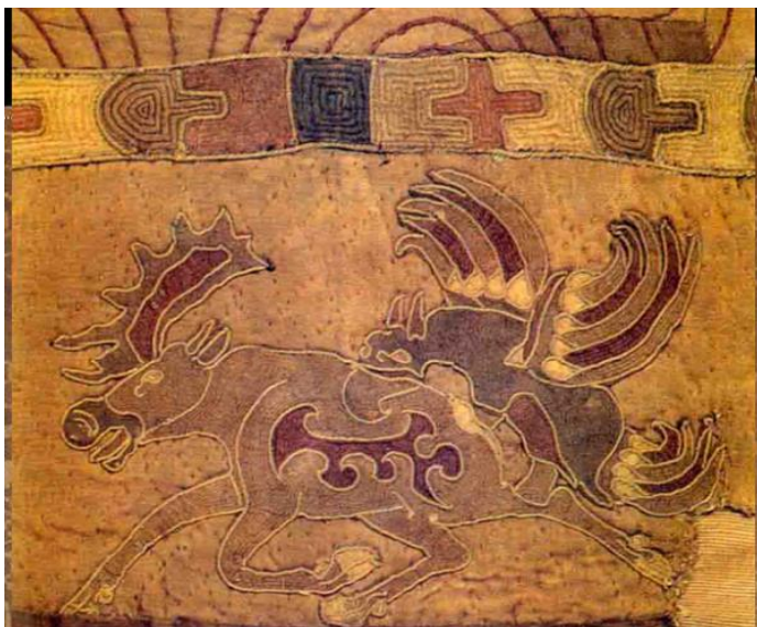
Рис. 2. Войлочный ковер – ширмэл. Захоронение Ноён уул. Фрагмент: скачущий олень и хищная птица.

Между главным орнаментом и его зооморфным окружением проходит узкая линия, оформленная узором из крестов, вертикальных и горизонтальных многоугольных фигур, которые отчетливо повторяются. В горизонтальном направлении кресты располагаются симметрично между двумя диаметрально противоположными прямоугольниками, оформленными тесьмой основных цветов.