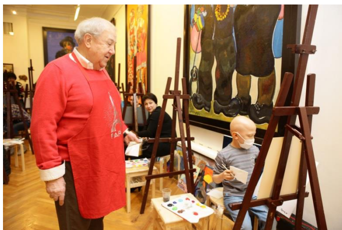
Рис. 1. Президент Российской академии художеств Зураб Константинович Церетели.

Распад Советского Союза коренным образом повлиял на жизнь отечественного искусства, государственных (Академия художеств СССР) и общественных организаций (Союз художников СССР). В значительной степени это было связано с реорганизацией, а фактически ликвидацией в 1992 году Художественного фонда СССР, что явилось полной утратой материально-технической базы и системы трудоустройства для огромного количества художников по всей стране, включая республики. Именно в этот период Академия художеств – главное государственное учреждение страны, определявшее культурную политику в области изобразительного искусства и архитектуры на протяжении почти трех веков, едва не прекратила свое существование.