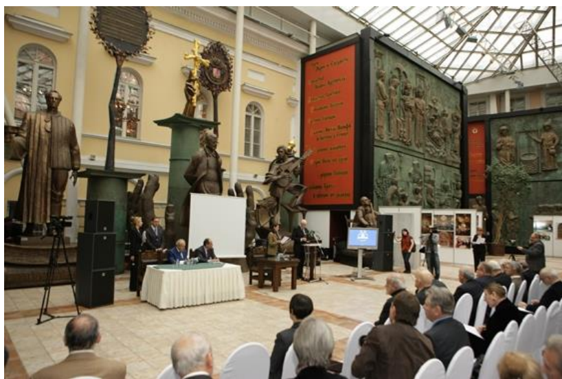
Рис. 4. Международная научная конференция «Искусство и наука в современном мире». 2009 г.

В 2009 году в Академии художеств состоялось знаковое событие – международная научная конференция «Искусство и наука в современном мире», ставшая совместным проектом двух государственных академий – Российской академии художеств и Российской академии наук.