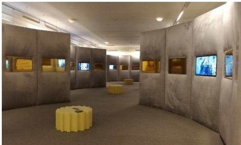
Рис. 5. Экспозиция выставки к 260-летию РАХ. 2017 г.