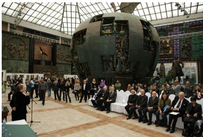
Рис. 3. Музейно-выставочный комплекс Российской академии художеств «Галерея искусств Зураба Церетели».

Музей разместился в одном из замечательных памятников архитектуры Москвы – дворце князей Долгоруковых. В советскую эпоху дворец пришел в упадок. Потребовалось немало усилий, чтобы восстановить его архитектурное пространство в прежнем великолепии – например, воссоздать знаменитые анфилады залов и Домовую церковь. В залах первого этажа с момента открытия музея располагается коллекция слепков с античной скульптуры и работы воспитанников Императорской академии художеств, принадлежащие прославленной школе русского рисунка. Гипсовые слепки из собрания Государственного музея изобразительных искусств им. А.С. Пушкина и рисунки из собрания Научно-исследовательского музея РАХ служат учебными пособиями для учащихся художественных лицеев и вузов, а также всех, кто стремится освоить технику рисования. В залах галереи постоянно сменяется экспозиция, раз в две недели проходят вернисажи. Деятельность Музейно-выставочного комплекса Российской академии художеств и Музея современного искусства заслуживает особого внимания специалистов, изучающих новейшее искусство, методологию и перспективы развития отечественного музееведения.