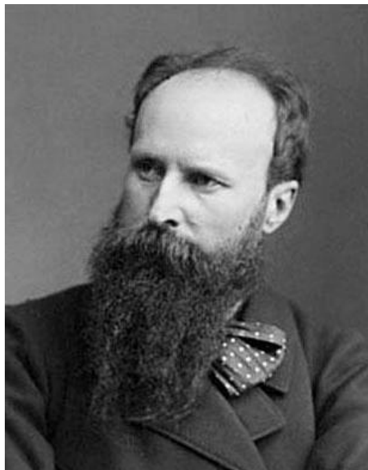
Василий Васильевич Верещагин (1842–1904)