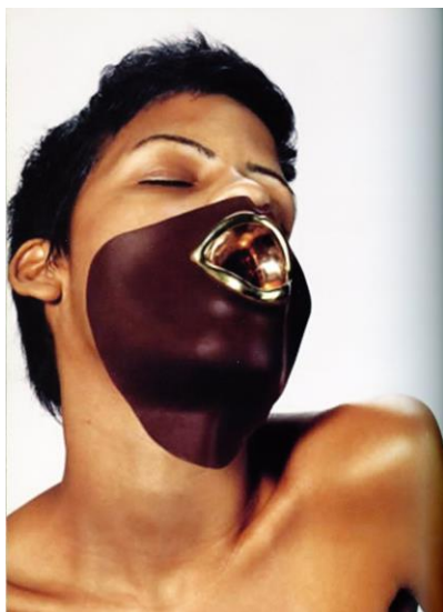
Рис.5. Филмер Н. Арт-объект «Шоколадная маска». 2001. Источник: Интервью с Наоми Филмер, британским дизайнером аксессуаров // Теория моды: одежда, тело, культура. 2010. № 16. С. 257-258, цв. вкл. 10.

На Западе в эти годы значительное место в ювелирных инсталляциях занимает осмысление зон тела, «неосвоенных в рамках традиционного ювелирного дизайна» [3, с. 234], – подмышки, подколенные впадины, пространства между пальцами рук и ног. Дизайнер Н. Филмер считает диктат со стороны вещи, принуждающей человека по-особенному осознавать свое тело и принимать те или иные позы, определяющим фактором современного искусства. В этом ее позиция близка экспериментам дизайнеров моды – Х. Чалаяна, А. Маккуина, Э. Хеш. Она разрабатывала украшения для их экстравагантных коллекций