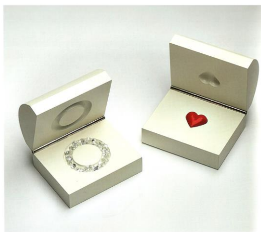
Рис. 6. Бак II. Арт-объект «Неприкасаемые украшения».

В продолжение темы Н.Филмер создала подлинно инсталляционные коллекции украшений из льда (1999) и шоколада (2001). По словам художника, они обостряли восприятие, «добавляя к гамме ощущений вкус и запах», предоставляя возможность