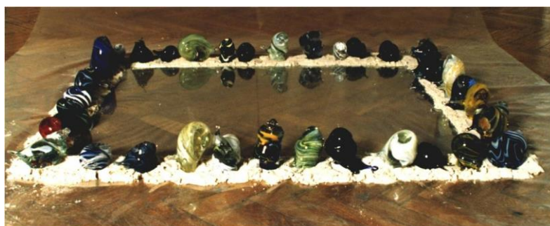
Рис. 2. Елена Апрашкевич «Зазеркалье» (1998). Стекло, песок. Инсталляция в рамках выставочного проекта «Glassiada».

Нейтрализация прямой функции утилитарной формы, применение приема разомкнутых, «не на своем месте» лепных деталей, включение в структуру произведения расколотых, лопнувших фрагментов – стали предвестниками вольного обращения со стеклом как средством художественного выражения. Формальные средства выразительности материала применялись художником и в ряде последующих произведений. В инсталляции «Рождение чистого звука» (1994) автором визуализируется