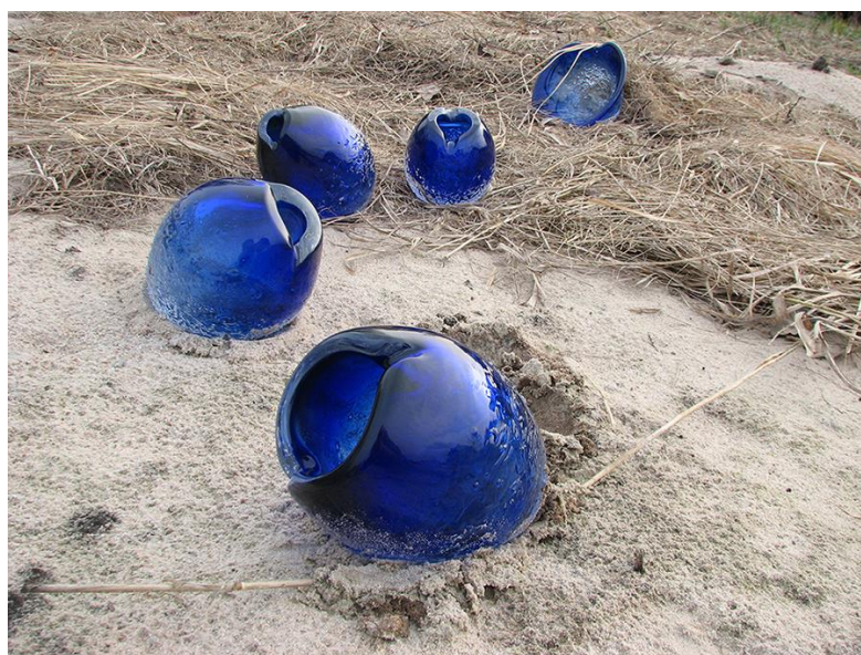
Рис. 4. Елена Ткачёва «Aqua caelestis (Вода небесная)» (2006). Стекло, гута. Фото: Елена Ткачёва