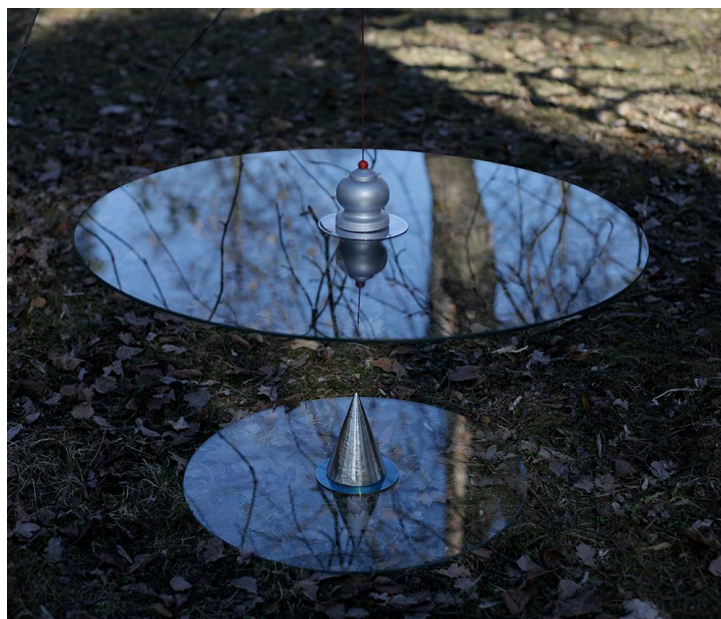
Рис. 9. Майре Пююкко, Аркадий Анищук «Pendulum» (2014). Стекло, металл, холодная обработка.

https://www.codaworx.com/project/iodine-black-rain