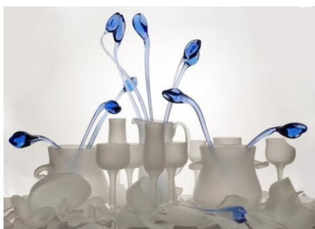
Рис. 1. Татьяна Артёмова «Бабье лето» (1993). Стекло, гута.

Этапы преобразования традиций декоративно-пространственной композиции на рубеже 1980-90-х гг. прослеживаются и утверждаются в творческой позиции Татьяны Артёмовой. Произведение художника «Бабье лето» (1993) представляет собой довольно масштабную инсталляцию, авторский контекст которой обращён к саморефлексии на тему времени, надежд и иллюзий (рис. 1).