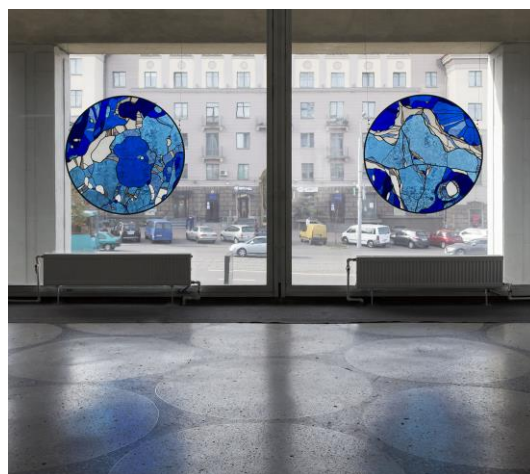
Рис. 6. Сергей Белоцкий «Синие глаза» (2016). Стекло, витраж.