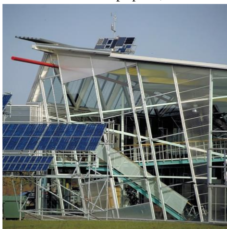
Рис. 1. Институт изучения Солнца в Штутгартском университете (Германия). Арх. Г. Бениш, 1989.

В построенном из стекла и стали Институте изучения Солнца в Штутгартском университете (Германия, арх. Г. Бениш, 1989. Рис. 1, 2) смещены горизонталы и вертикали, здесь обилие острых углов, наклоненные опоры, перекошенные окна и др. Стены и часть крыши – из стекла. Кажется бы, налицо некий архитектурный хаос. Но этот «хаос» приостанавливает, заостряет внимание, заставляет взглянуть и задуматься: о чем говорят эти искаженные формы, что хотел выразить автор?