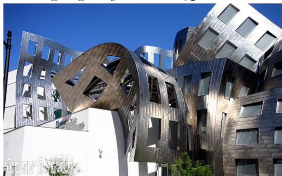
Рис. 4. Центр изучения мозга в Лас-Вегасе (США). Арх. Ф. Гери, 2009. Вид «непознанной вселенной мозга».

И... начинают проступать, становятся очевидными новые смыслы. Стеклоянная оболочка делает доступным для исследователей объект исследования Солнце, хотя и находящееся вне стен здания. Можно допустить, что в множественных неожиданных пересечениях конструкций и форм закодированы всевозможные мыслимые и немыслимые ракурсы, фиксирующие ежедневно смещающуюся ритуальную траекторию Солнца на