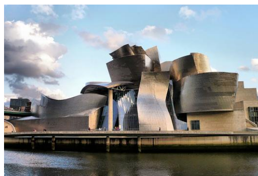
Рис. 6. Музей современного искусства в Бильбао (Испания). Арх. Ф. Гери, 1997. http://maindoor.delta-web.ru/news/frenk-geri