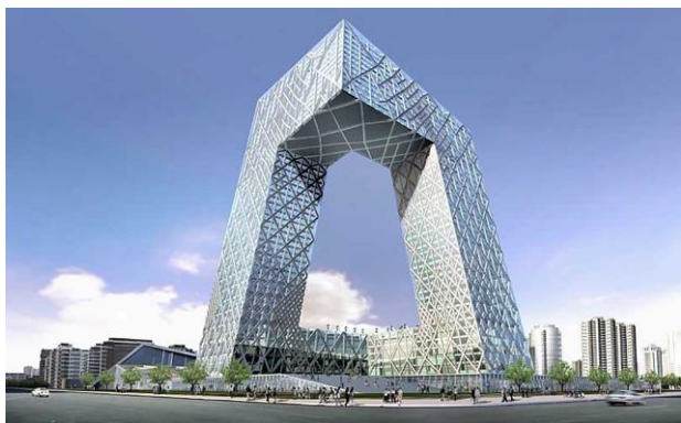
Рис. 9. Здание центрального телевидения в Пекине. Арх. Р. Колхас, О. Шерен, арх. бюро ОМА. 2012.

Быть может, примером подобного подхода является здание центрального китайского телевидения в Пекине, построенного архитекторами Ремом Колхасом, Оле Шереном и архитектурным бюро ОМА (2012) (рис. 9).