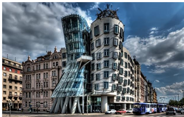
Рис. 10. Танцующий дом в Праге (Чехия). Арх. В. Милунич и Ф. Гери, 1996.