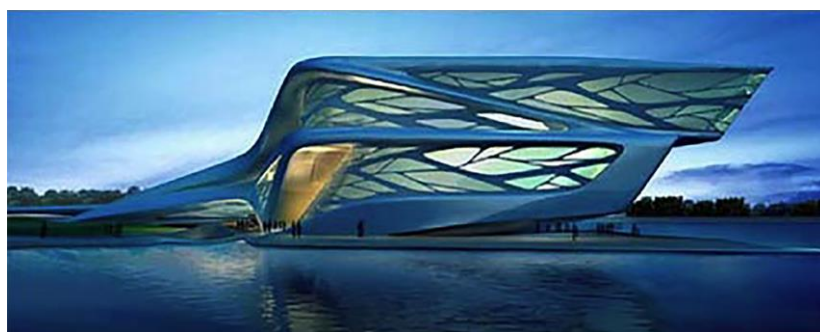
Рис. 8. Центр искусств в Абу-Даби (ОАЭ). Арх. Заха Хадид, 2016. Вид сбоку. Проект.

Интерьер второй части (рис. 5), такой же стихийный, как экстерьер, приспособлен лишь для проведения различных научных мероприятий – своего рода попыток проникновения в стихию мозга.