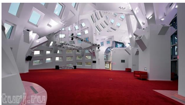
Рис. 5. Центр изучения мозга в Лас-Вегасе (США). Арх. Ф. Гери, 2009. Интерьер «непознанной вселенной мозга».

Сооружение состоит из двух частей (рис. 3), подобно тому, как мозг – из двух полушарий. Одна (на снимке справа) – привычно относительно упорядочена, здесь, собственно, и расположены все необходимые исследовательские помещения. Вторая (рис. 4) – необжитая, прочитывается как непознанная вселенная мозга: это странное скопление оболочек каких-то скругленных объемов или их фрагментов, а также отдельных плоскостей. Все прорезаны прямоугольными проемами «окон», то есть «открыты», ожидают исследователей.