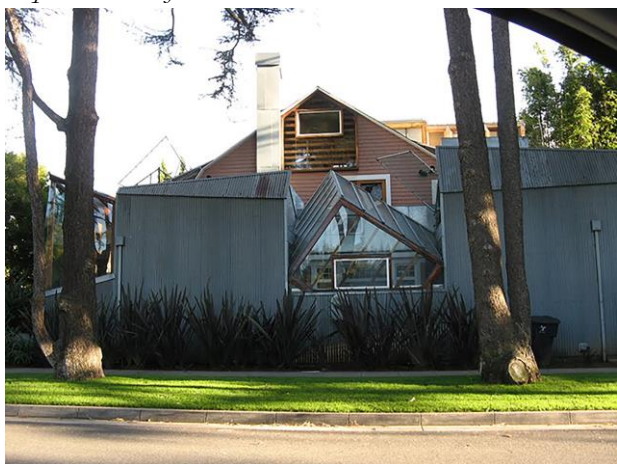
Рис. 11. Собственный загородный дом Ф. Гери в Санта Монике (США), 1978.