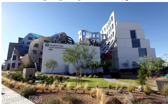
Рис. 3. Центр изучения мозга в Лас-Вегасе (США). Арх. Ф. Гери, 2009.