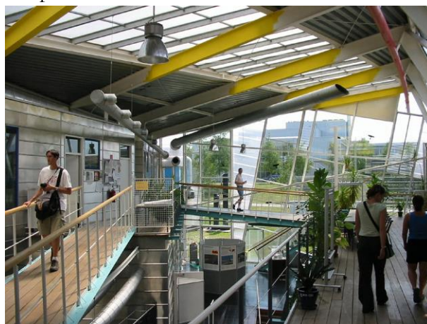
Рис. 2. Институт изучения Солнца в Штутгартском университете (Германия). Арх. Г. Бениш, 1989. Интерьер.