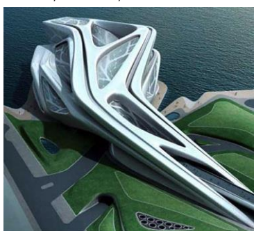
Рис. 7. Центр искусств в Абу-Даби (ОАЭ). Арх. Заха Хадид, 2016. Вид сверху. Проект.