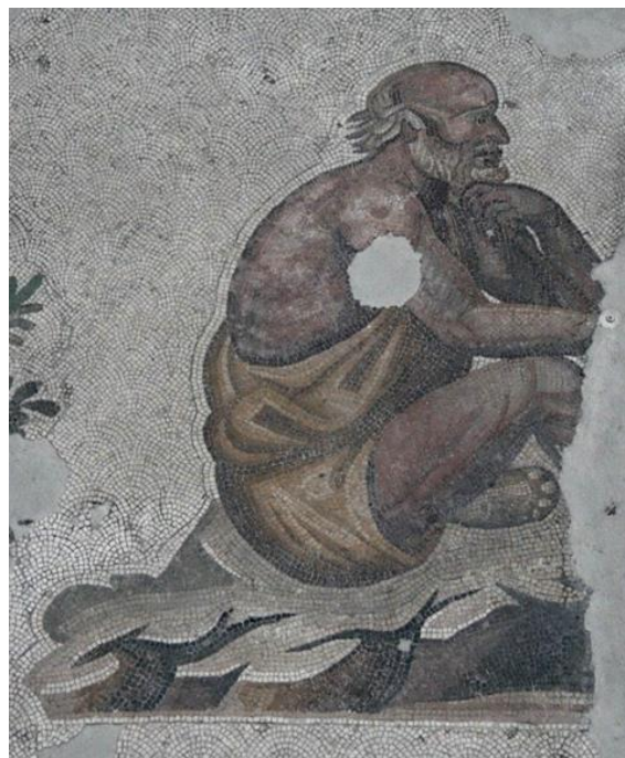
Рис. 5. Размышляющий персонаж. Фрагмент напольной мозаики триклиния Большого императорского дворца в Константинополе. Камень. VI в. Музей мозаики. Стамбул.

Сохранялась античная традиция и в светском придворном искусстве раннего средневековья, в частности, так изображен персонаж в напольной мозаике перистилия триклиния Большого дворца в Константинополе эпохи императора Юстиниана второй половины VI в. [4, с. 30-31] (рис. 5).