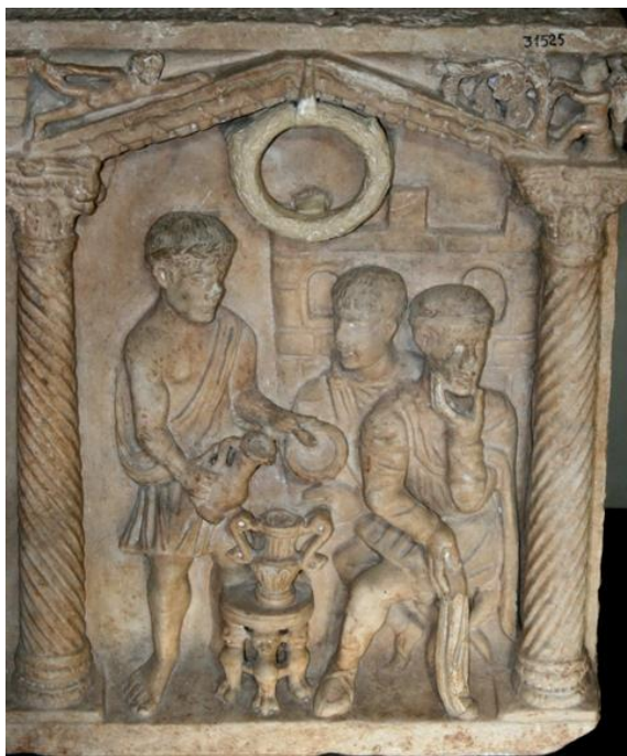
Рис. 4. Понтий Пилат, умывающий руки. Фрагмент «саркофага страстей». IV в. Музей Пио Клементино. Ватикан.

саркофага IV в. н.э. из Ватикана: один из «саркофагов страстей» (рис. 4) и точно датированный саркофаг Юния Басса 359 г. [31, 30]. Возможно, Роден видел именно эти, а также и другие саркофаги в музеях Рима.