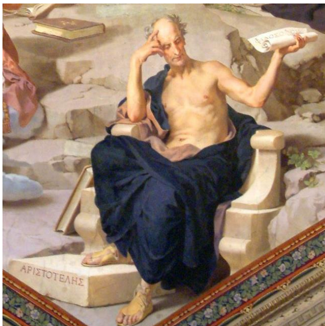
Рис. 7. Людвиг Зейтц. Аристотель. Деталь росписи плафона. 1883–1887 гг. Галерея канделябров. Музей Пио Клементино. Ватикан.