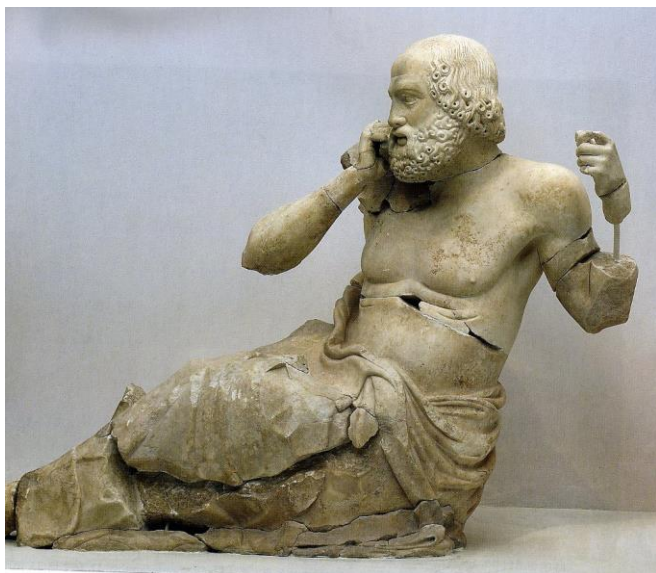
Рис. 2. Оракул. Фрагмент скульптуры восточного фронтона храма Зевса в Олимпии. Мрамор. 468–456 гг. до н.э. Археологический музей, Олимпия.

Обращаясь к классической Греции, формулу задумчивого человека встречаем в разных видах искусства, но прежде всего, в скульптуре. Так, например, изображен Оракул на восточном фронте храма Зевса в Олимпии 472-456 гг. до н.э. (Олимпия, Археологический музей) [24]. Сама поза соответствует образу пророческого сосредоточения Оракула и контактов с божеством.