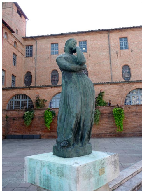
Рис. 8. (Илл. 8) Антуан Бурдель. Большая Пенелопа. Бронза. Высота 240 см. 1912 г. Монтобан.

Завершить этот краткий обзор образов «мыслителей» от первобытной древности до современников Родена будет уместно скульптурой его ученика Эмиля Антуана Бурделя «Пенелопа» (рис. 8), созданной в 1912 г., ровно через тридцать лет после Мыслителя (г. Монтобан) [16].