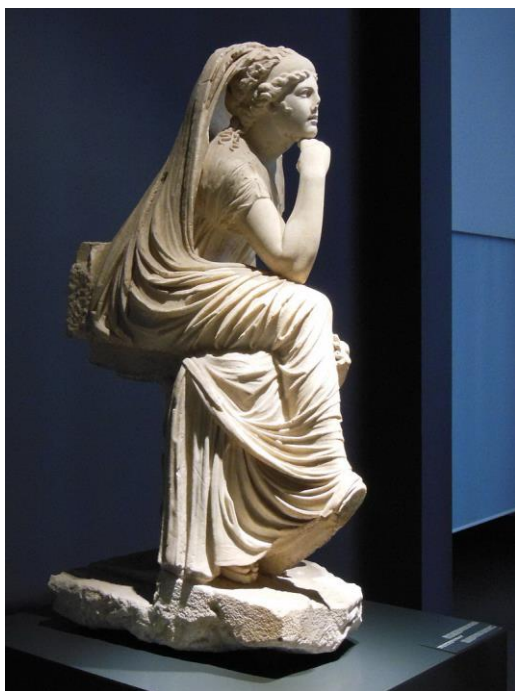
Рис. 3. Морская богиня с Тритоном, так называемая Фетида. Мрамор. Римская копия II в. н.э. с эллинистического оригинала. Национальный музей, Палаццо Массимо. Рим.

Формула изображения задумчивого человека была распространена и в римском искусстве. Таков образ Анаксимандра – римская копия греческого оригинала (Национальный музей, Рим) [15]. Аналогично представлено женское морское божество, предположительно, Фетида или Нереида с тритоном. Вновь это римская копия II в. н.э. с греческого оригинала эпохи эллинизма (Национальный музей, Рим) [38].