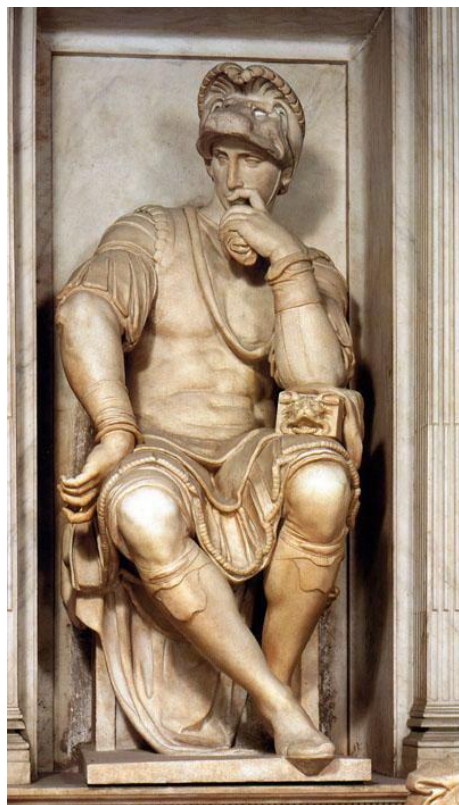
Рис. 6. Микеланджело Буонарроти. Статуя Лоренцо Медичи. Мрамор. 1524–1531. Капелла Медичи, Новая Сакристия церкви Сан Лоренцо. Флоренция.

И, наконец, обращаясь к произведениям самого Микеланджело, неизбежно и необходимо упомянуть статую Лоренцо II Медичи из капеллы Медичи 1526–1534 гг. во Флоренции [5, с. 22]. Эта фигура получила в Италии прозвище «Il pensieroso», «созерцательный», то есть некое подобие мыслителя. Скульптура не является буквальным портретом Лоренцо Медичи, а неким идеализированным изображением [27, р. 188].