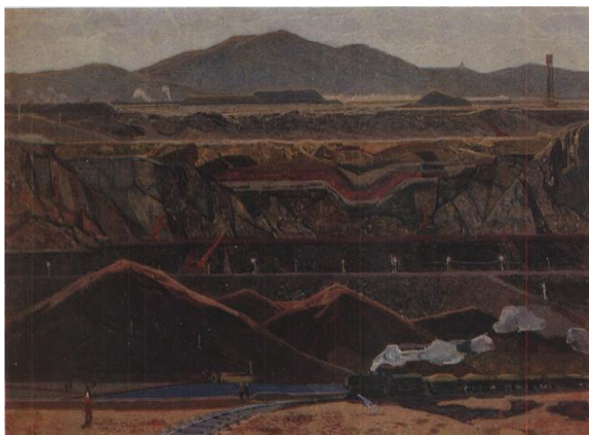
Рис. 8. А.В. Пантелеев. Медный рудник. 1961. Холст, масло. 105×154. БГХМ им. М.В. Нестерова.

неразличимой по своей структуре и плотности. При этом именно предметное восприятие окружающего пространства позволило А.В. Пантелееву увидеть производственную среду по-новому.