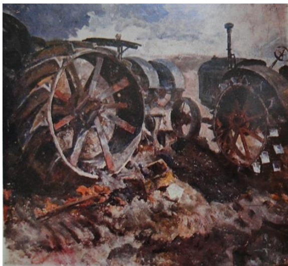
Рис. 6. А.Э. Тюлькин. Тракторы. Этюд. 1930. Фанера, темпера. 77x78,7. БГХМ им. М.В. Нестерова.

В творчестве А.В. Пантелеева получил развитие индустриальный пейзаж. В своих работах на производственную тему художник ярко демонстрировал свой аналитический, рациональный подход к изображению.