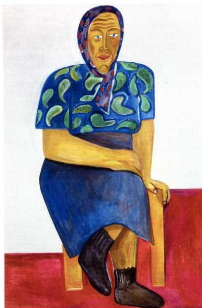
Рис. 4. М.А. Назаров. Портрет М.Н. 1966. Холст, темпера. 138x95. Собственность автора.

сотрудником, читал лекции по искусству. Он рано начал увлекаться русскими сезаннистами, так как произведения некоторых из них всегда можно было видеть в экспозиции уфимского музея.