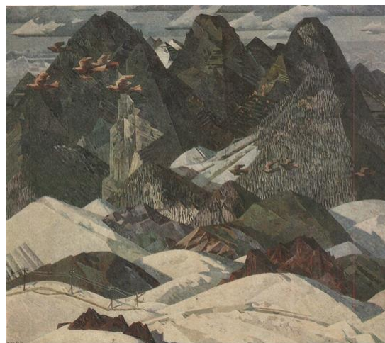
Рис. 9. А.В. Пантелеев. Горлицы. 1969. Холст, масло, 140×160. Пермская областная картинная галерея.