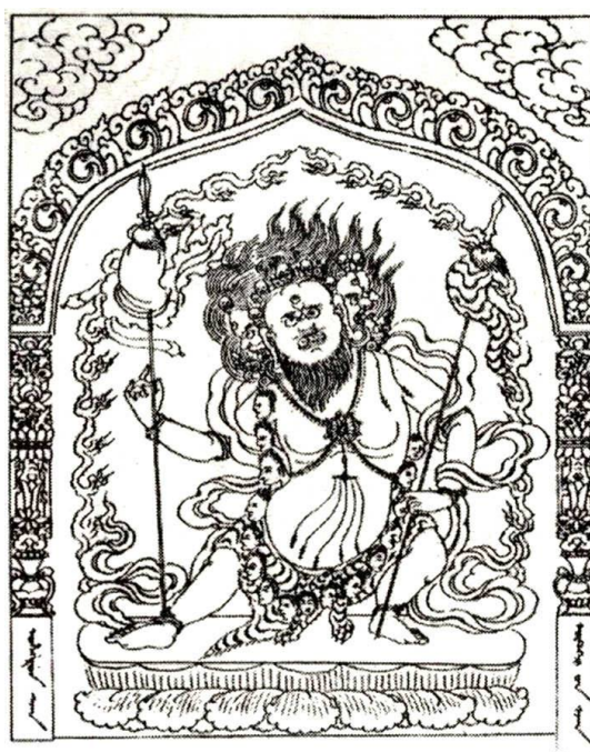
Рис. 5. Изображение Ситипати в монгольском Ганджуре (1717-1720 г.)