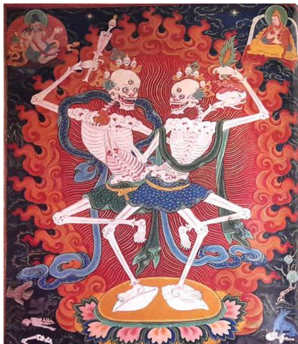
Рис. 4. Цветное изображение Ситипати.

2. Ситипати является одним из восьми сопровождающих Панджары Махакалы в монгольском Ганджуре (1717–1720 г.) [5, с. 328], монг. Укегер-ун ежен, в правой и левой руках – копья со знаменем, стоит в позе алидха (рис. 5).