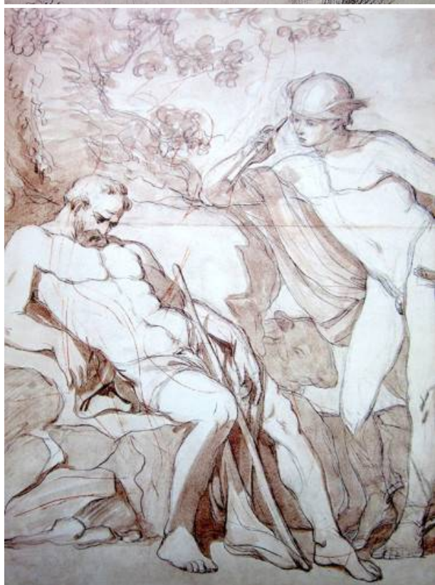
Рис. 6. П.И. Соколов. Меркурий и Аргус. Эскиз-вариант одноименной картины. 1776 г. Бумага, итальянский карандаш, коричневая и розовая акварель, сангина. 60,5 x 47,7. ГРМ. [15].