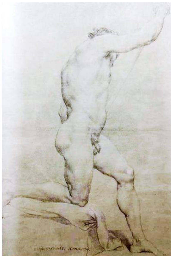
Рис. 10. П.И. Соколов. Натурищик . 1774 г. Бумага тонированная, итальянский карандаш, мел. 54,8 x 39. НИИМ РАХ. [7].