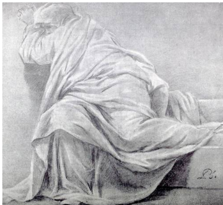
Рис. 7. П.И. Соколов. Рисунок драпировок. 1770-е гг. Бумага тонированная, итальянский карандаш, мел. 38 x 39. ГРМ. [17].

Кроме того, он посещал классы французской академии в Риме. В рапорте от 29 июня 1774 года Петр Соколов сообщал: «Не упуская, хожу во французскую академию рисовать с натуры и пользуюсь советами лучших господ пенсионеров, рисую с работ Караччия, также получаю наставления от профессора Батония» [10].