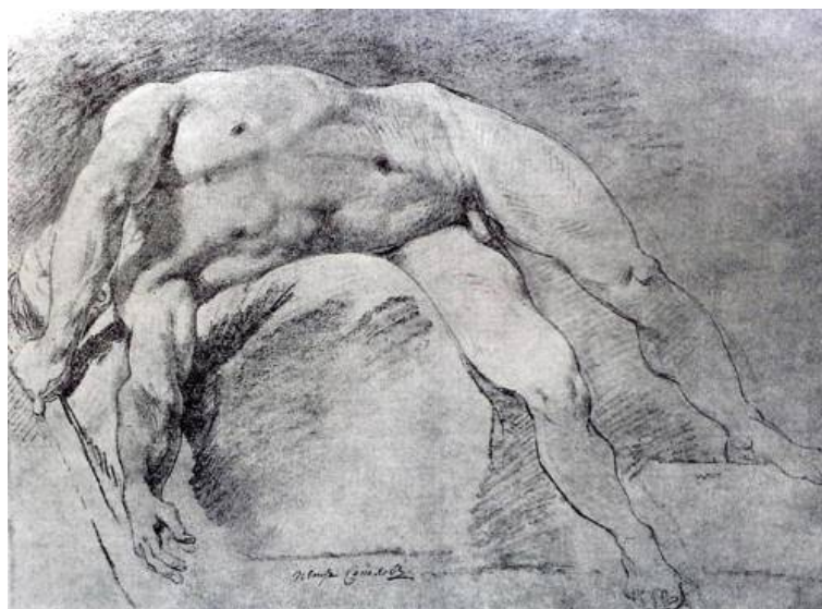
Рис. 9. П.И. Соколов. Лежащий натуращик . 1770-е гг. Бумага тонированная, итальянский карандаш, мел. 40 x 55. НИИМ РАХ. [17].