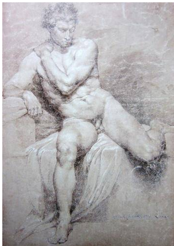
Рис. 11. П.И. Соколов. Сидящий натуращик . 1776 г. Бумага серая, итальянский карандаш, мел. 55,7 x 40,7. ГРМ [15].