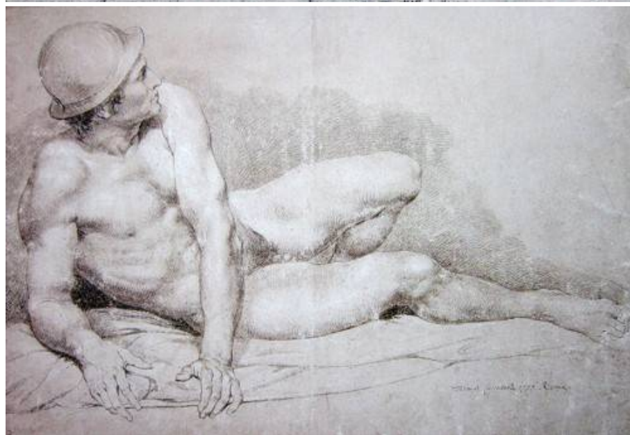
Рис. 3. П.И. Соколов. Лежащий натуралик в шлеме. 1775 г. Бумага серая, итальянский карандаш, мел. 39,5 × 54,9. ГРМ. [15].