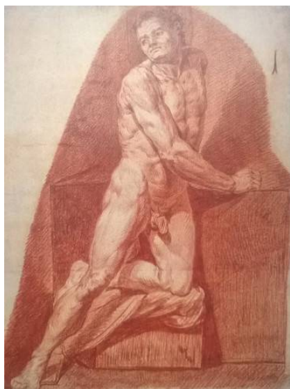
Рис. 8. П.И. Соколов. Натурищик . 1768 г. Бумага, сангина. 58 x 42,6. ГТГ. [14].