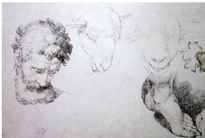
Рис. 4. П.И. Соколов. Голова и нога Аргуса. Голова овцы. 1776 г. Бумага голубая, итальянский карандаш, мел. 24 x 35,2. ГРМ. [15].