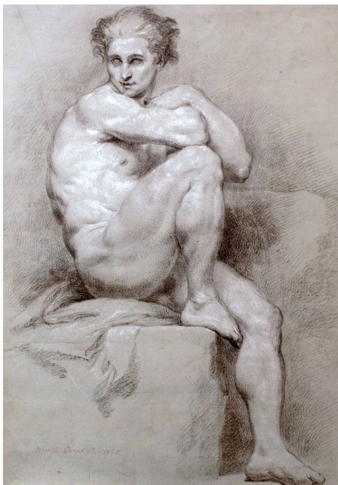
Рис. 12. П.И. Соколов. Сидящий натуращик. 1785 г. Бумага, итальянский карандаш, мел. 56,5 x 39,2. НИИМ РАХ [6].

Сохранилось большое количество графических работ художника 1780–1790-х годов. Большинство из них – однофигурные и двухфигурные постановки. В этих работах прослеживается отказ художника от идеализации, свойственной его графике ранее.