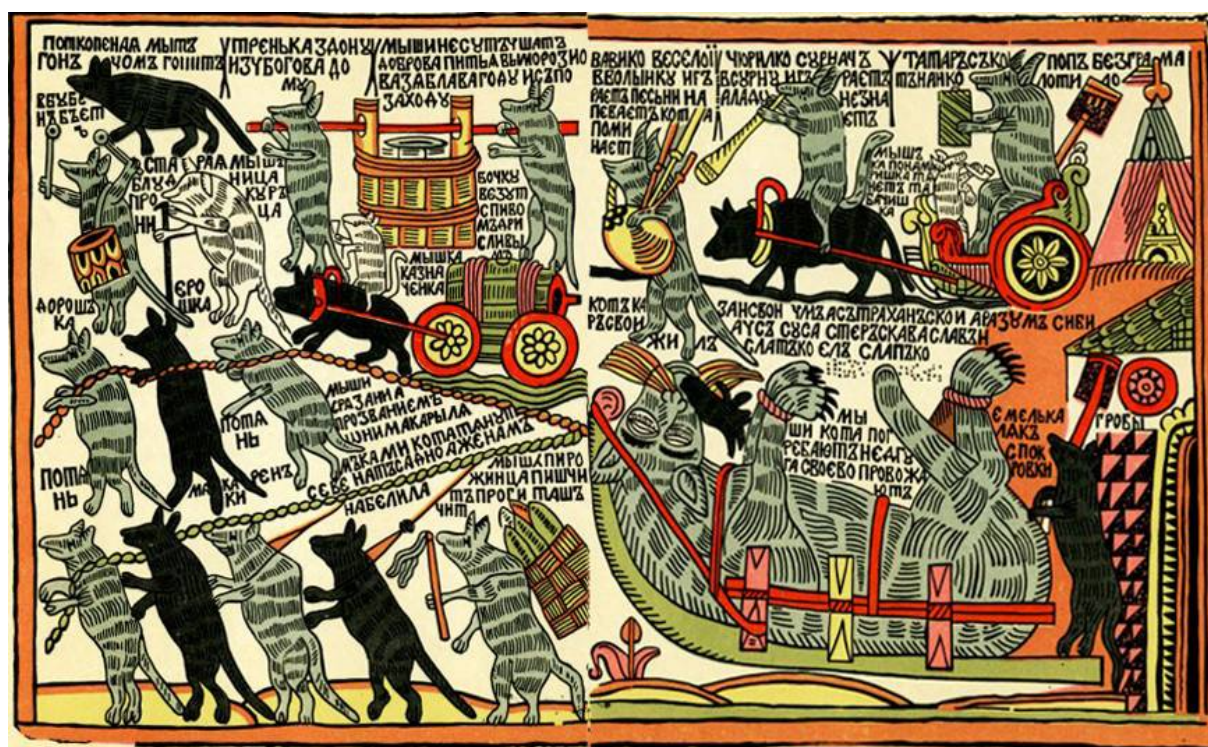
Рис. 1. Мыши кота погребают. Конец XVII – начало XVIII в. Оттиск 1760-х гг. Техника: Раскрашенная гравюра на дереве. Размеры: 32,8 x 57,3 см. Отпечатана с 2 досок на 2 листах, затем склеена. Из экспозиции Музея народной графики (г. Москва).

В ходе работы коллектива Мастерской народной графики, насчитывающего более 120 художников из разных регионов страны, за 1980-е годы были восстановлены канонические печатные формы по 120 различным лубочным сюжетам: 36 листов «Библии для бедных» Василия Кореня, духовный лубок, сатирический лубок, исторический лубок, бытовой, песенный лубок и др. Воссоздан альбом «Библия для бедных» Василия Кореня, ранние гравюры XVII–XVIII вв., литографский лубок XIX в., реконструированы лубки XVII–XVIII вв. Логическим продолжением целенаправленной собирательской, исследовательской и творческой деятельности коллектива Мастерской явилось учреждение в 1989 году единственного в России Музея народной графики. Основу фондовой коллекции составило личное собрание Виктора Петровича Пензина, переданное в дар Музею, и коллекция Мастерской. Наряду с редкими образцами ранней народной гравюры, отпечатанной в соответствии с традициями мастеров, авторской гравюры времен Отечественной войны 1812 года (Алексей Венецианов, Иван Тербенев и др.), в собрании Музея представлены произведения современных мастеров [2]. В 1992 году состоялось официальное открытие, и Музей обрел свой дом, расположенный в знаменитом историческом месте Москвы, по переулку Малый Головин, № 10, в районе Сретенки, где когда-то процветал лубочный промысел. Отсюда и местная топонимика: Лубянка, Печатников переулочек, церковь Успения в Листах (на храмовой ограде картинка вывешивались для продажи) (рис. 1).