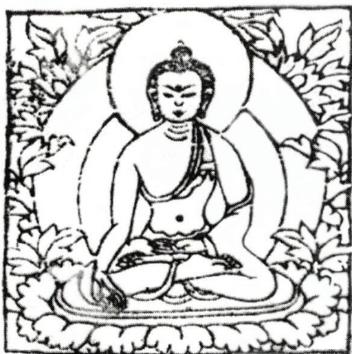
Рис. 9. Дипанкара в Ганджуре Дэргэ 27а (1729–1733 гг.).

3. Дипанкара (тиб. Mar.me.dzad) в Ганджуре Дэргэ 27а (1729–1733 гг.) изображен сидящим, правая рука в мудре бхумиспарса, левая – в мудре дхьяна.