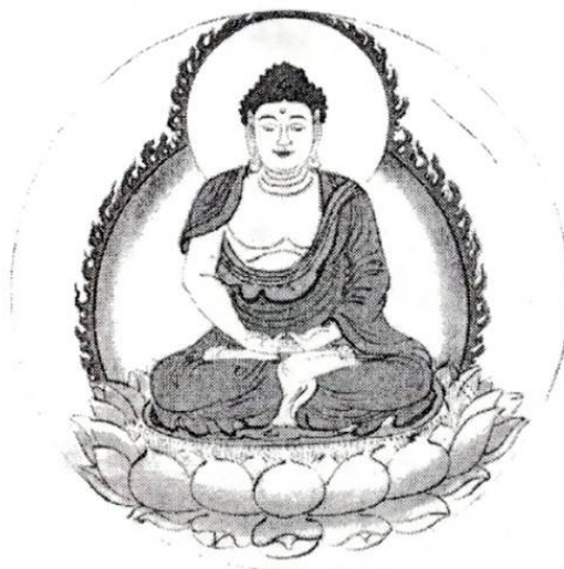
Рис. 6. Изображение Дипанкары.

Его мантра – Om samadhijala svaha в 24, с. 86.17.