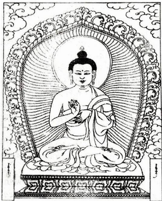
Рис. 10. Дипанкара в монгольском Ганджуре.

Авалокитешвара, а в верхней левой части – зеленый Ваджрапани [7, с. 2.190, № 8]. Изображение из позолоченной латуни эпохи Канси 1662 г. сделано в монастыре Smin.grol.glin. [23, с. 540, рис. 152E]: правая рука – в мудре абхайя, левая рука – в мудре варада. Также имеются изображения в верхней части тибетского свитка Самвары XVIII века [29, с. 138, рис. 192 на с. 140] в монгольском Ганджуре [5, с. 47], 1717–1720 гг., монг. – Дипанкар-а, и в Пантеоне Пао-сян Лоу 1В29 (1771 г.) с китайским именем Жань-тэн фо на пьедестале. Изображен на с. 1005.