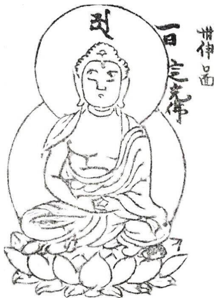
Рис. 8. Дипанкара, посвященный первому дню месяца в Санджучи-хи-буцу-цзу «Фигуры Будд, посвященные 30 дням месяца».

Так посвященным первому дню месяца он изображен в Санджучи-хи-буцу-цзу «Фигуры Будд, посвященные 30 дням месяца» [26, с. 104.1].