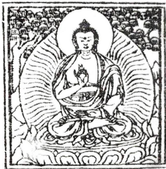
Рис. 11. Мудра Дипанкары в Танжуре Дэргэ.

Вариант мудры Дипанкары (тиб. Mar.me.mdzad) в Танжуре Дэргэ 278а: правая рука – мудра абхайя, левая – мудра дхьяна в круге. Изображен на странице 1005.