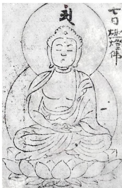
Рис. 5. Изображение Дипанкары.

Другое имя Дипанкары – Джоко («свет медитации» – дхьяналака). В трактате Махавьютпатти даны два китайских эквивалента имени Дипанкары. У Джоко биджа – «А», что означает «алока» (медитация. – Прим. ред. ), и посвящен он первому дню месяца. Изображен в Цзучзо-шо «Собрание фигур» за авторством Ёгена (1075–1159 гг.) [26, с. 86.17] и в Бессон-цзакки «Описание божеств» автора Шинкаку (1117–1180 гг.) [26, с. 87.24].