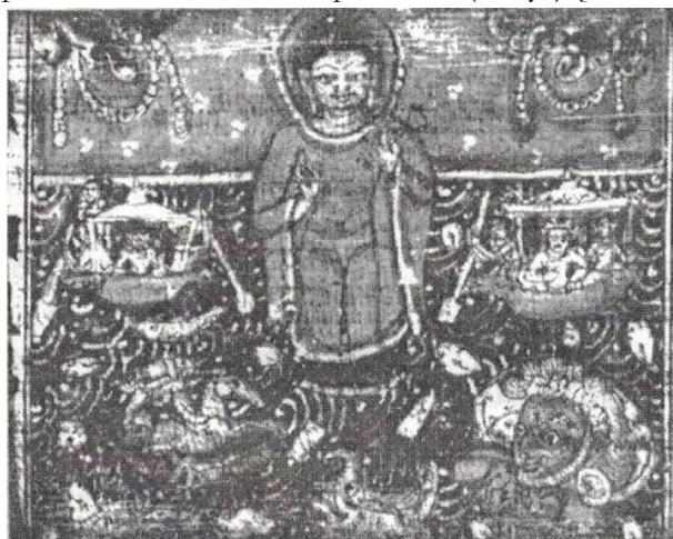
Рис. 4. Махасамудре Рахуркта Абхайяпани, 1015 г.

1015 г. Махасамудре Рахуркта Абхайяпани, в океане, изображены черепаха, рыба, лошадь, голова ракшаса (Раху?) [7, с. 2.190] № 7.