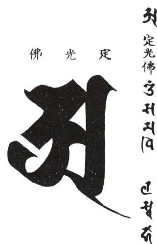
Рис. 7. Мантра «Om samadhijala svaha».

Его мантра – Om samadhijala svaha в 24, с. 86.17.