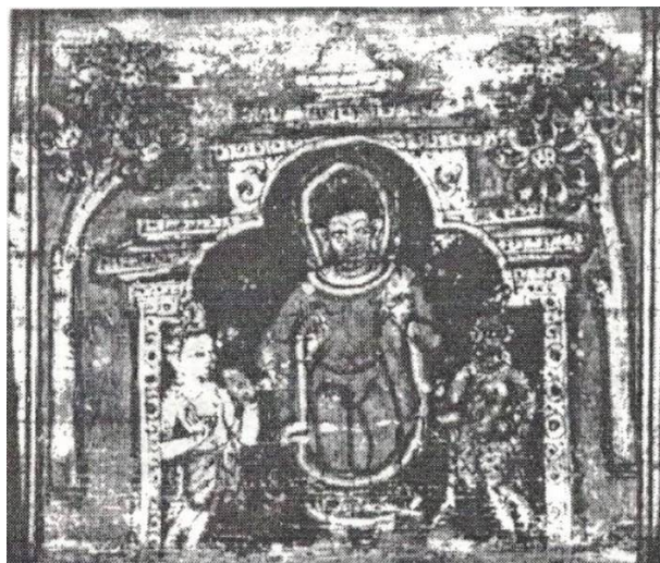
Рис. 3. Симхаладвипе Дипанкара, 1015 г.

1015 г. Симхаладвипе Дипанкара, справа – белый Авалокитешвара, слева – зеленый Ваджрапани [7, с. 2.189] № 3, 1.78.