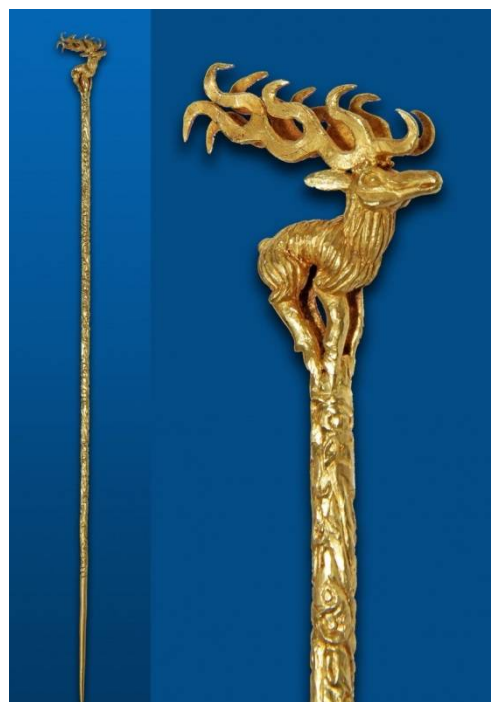
Рис. 2. Фигурка оленя – навершие золотой шпильки, украшения «царицы». Находка из кургана Аржаан-2. 2-я половина VII в. до н. э. Золото, литье. Длина шпильки – 30 см. Национальный музей им. Алдан-Маадыр Республики Тыва.

Золотой олень с ветвистыми рогами (рис. 2) – своеобразный символ скифского искусства. По мнению исследователей, его образ символизировал царскую власть как воплощение могущества солнечного божества на земле. Так же как и лошадь (конь), олень считался священным животным, посвященным солнечному божеству.