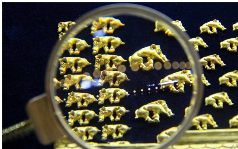
Рис. 4. Профильные фигурки кабанов – украшения горита (колчана). находка из кургана Аржаан-2. 2-я половина VII в. до н. э. Золото, литье. Размеры малых бляшек – 1,2-2,1 см., размеры больших бляшек – 1,6-2,4 см. Национальный музей им. Алдан-Маадыр Республики Тыва.

Можно смело утверждать, что скифский звериный стиль актуален и востребован. Его заимствуют, по-новому переосмысляя. Можно даже говорить, что зооморфный код, оставленный древними мастерами, современные мастера интерпретируют как послание во времени. Его образы органично накладываются на современный культурный слой, придавая произведениям народно-прикладного искусства флер эпичности. Тувинская сувенирная продукция, выполненная с использованием стилистических элементов, смотрится представительно и самобытно, тем самым выделяя регион среди других субъектов РФ.