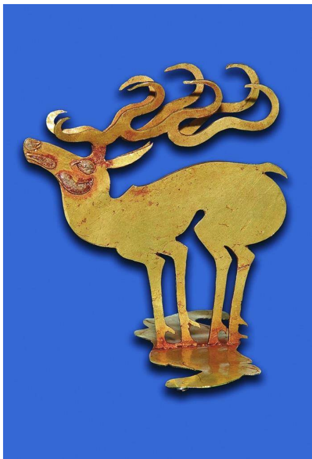
Рис. 5. Олень, стоящий «на цыпочках». Навершие головного убора «царя». находка из кургана Аржаан-2. 2-я половина VII в. до н. э. Золото, резьба, пайка. Национальный музей им. Алдан-Маадыр Республики Тыва.

Олени, стоящие «на цыпочках» (рис. 5), огненные небожители; лошади с подогнутыми под туловище ногами (рис. 6), точно повторяющие позу погребенных царских коней из захоронения, – все они копируются на современном сувенирном рынке юга Восточной Сибири. Известно, что при раскопках исследователи обратили внимание на изображения лошадей; они представляли собой золотые отражения погребенных 14 жертвенных лошадей, обнаруженные в общей могиле на площади кургана. Идеальная сохранность некоторых тончайших элементов дает право утверждать, что фигурки были изготовлены специально для совершения погребального обряда.