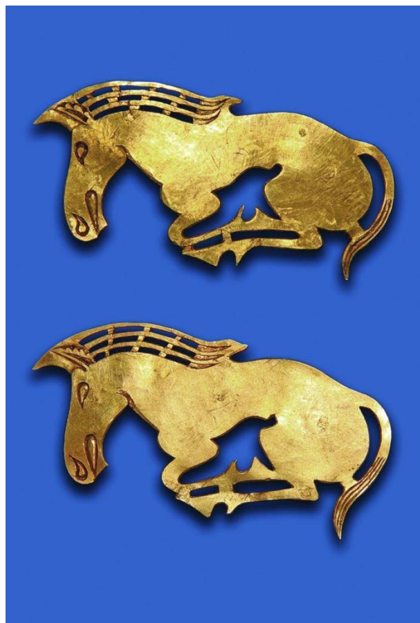
Рис. 6. Бляхи в виде лошадей – украшения головного убора. находка из кургана Аржаан-2. 2-я половина VII в. до н. э. Золото, эмаль, резьба. Длина – 8,2 см. Национальный музей им. Алдан-Маадыр Республики Тыва.