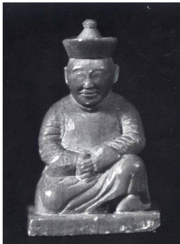
Рис. 6. Сидящий чиновник. Дерево, минеральные красители. ТОКМ. Коллекция тувинской пластики С.К. Просвиркиной (в составе Восточной коллекции). 1917 г. Инв. № 3134-130.