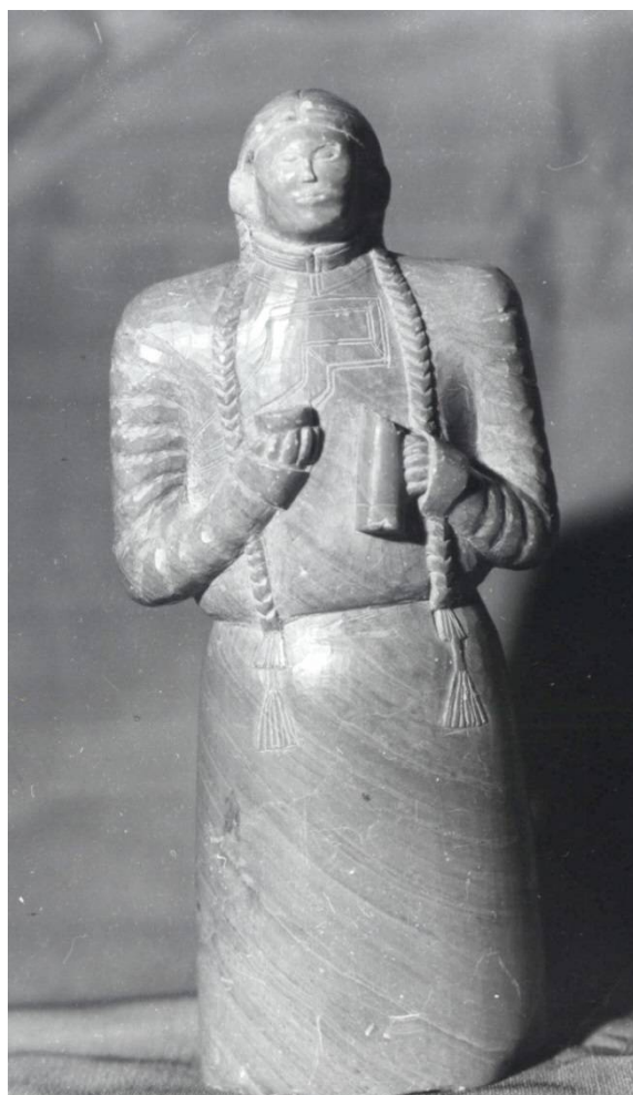
Рис. 3. Фигура простоволосой женщины, стоящей с чашкой и кувшином в руках. Агальматолит. ТОКМ. Коллекция тувинской пластики С.К. Просвиркиной (в составе Восточной коллекции). 1917 г. Инв. № 3134-90.