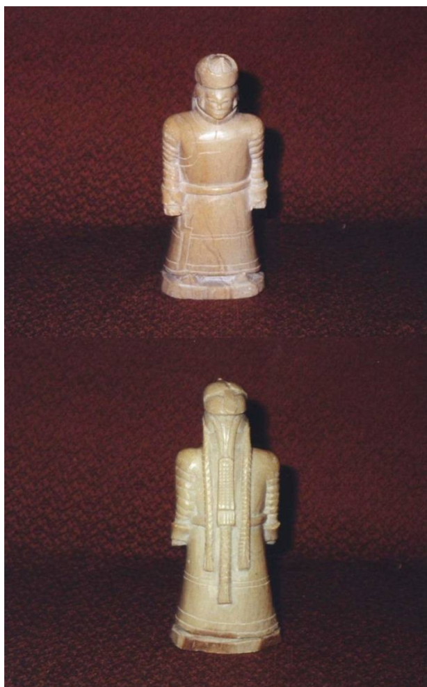
Рис. 2. Фигура стоящей женщины (в остроконечной шапке). Агальматолит. ТОКМ. Коллекция тувинской пластики С.К. Просвиркиной (в составе Восточной коллекции). 1917 г. Инв. № 3134-93.