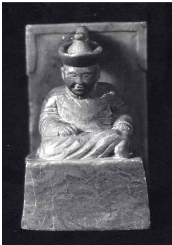
Рис. 5. Фигура сидящего мужчины (чиновник). Агальматолит. ТОКМ. Коллекция тувинской пластики С.К. Просвиркиной (в составе Восточной коллекции). 1917 г. Инв. 3134-99.