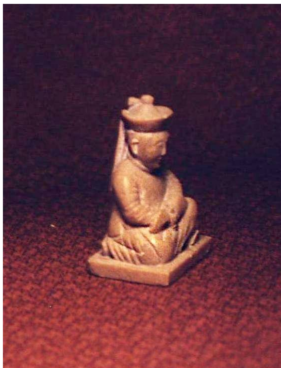
Рис. 4. Фигура сидящего мужчины (чиновник). Агальматолит. ТОКМ. Коллекция тувинской пластики С.К. Просвиркиной (в составе Восточной коллекции). 1917 г. Инв. № 3134-98.