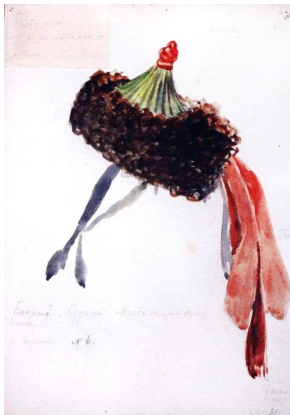
Рис. 8. ТОХМ НВ608 – Мужской головной убор (Тува). Бумага, акварель. ТОХМ. Коллекция рисунков С.К. Просвиркиной. 1910–1917 гг.