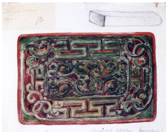
Рис. 9. ТОХМ НВ612 – лицевая сторона кожаной подушки; набросок кожаной подушки – общий вид (Тува). Бумага, акварель. ТОХМ. Коллекция рисунков С.К. Просвиркиной. 1910–1917 гг.