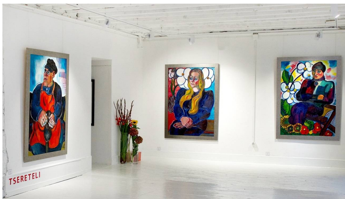
Рис. 16. «Monimental». Выставка произведений Зураба Цертели в Женеве.