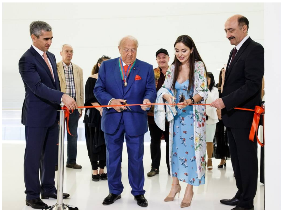
Рис. 2. «Возможные миры». Выставка произведений З.К. Церетели в Баку.