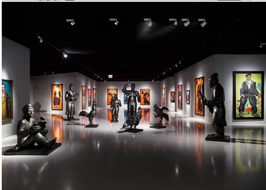
Рис. 3. «Возможные миры». Выставка произведений З.К. Церетели в Баку.

Обратим внимание здесь на экспозиции, представленные в крупнейших музеях и известнейших галереях мира. Одной из наиболее ярких выставок стала экспозиция под названием «Зураб Церетели: Больше, чем жизнь» («Zurab Tsereteli: Larger than Life») в Великобритании с 23 января по 19 февраля 2019 года в лондонской галерее Саатчи. Выставка включала около 100 картин, скульптур, книг с рисунками, эмалей З.К. Церетели. Также на ней демонстрировались архивные видеоматериалы, посвященные творчеству художника. Эта выставка наиболее полно раскрывает основные составляющие художественного метода З.К. Церетели: монументальность, этнографическая символика соседствуют с неоекспрессионистскими тенденциями.