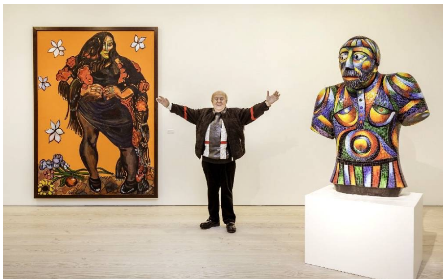
Рис. 4. Выставка «Зураб Церетели: Больше, чем жизнь» в Saatchi Gallery (Лондон).