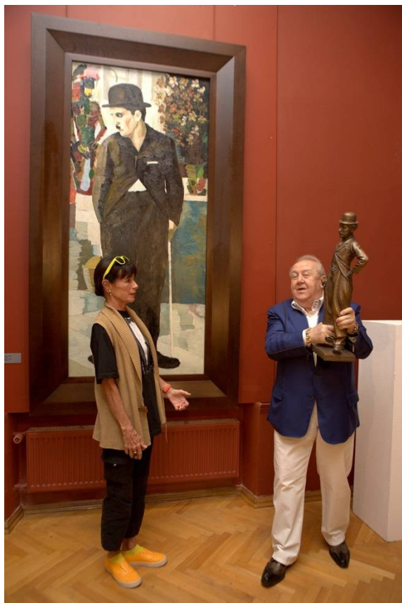
Рис. 12, 13, 14. «Чарли Чаплин в Тифлисе» – экспозиция Музея современного искусства Зураба Церетели в Тбилиси.

Образ «маленького бродяги» Чарли Чаплина вдохновил З.К. Церетели на создание серии произведений, в которых смешались сцены из кино и вымысел художника, поместившего своего героя в придуманные им самим ситуации. Он погрузил Чарли в атмосферу старого Тифлиса, где этот персонаж сразу стал своим, как будто здесь родился и вырос. Все произведения художника добрые и светлые, что делает выставку привлекательной.