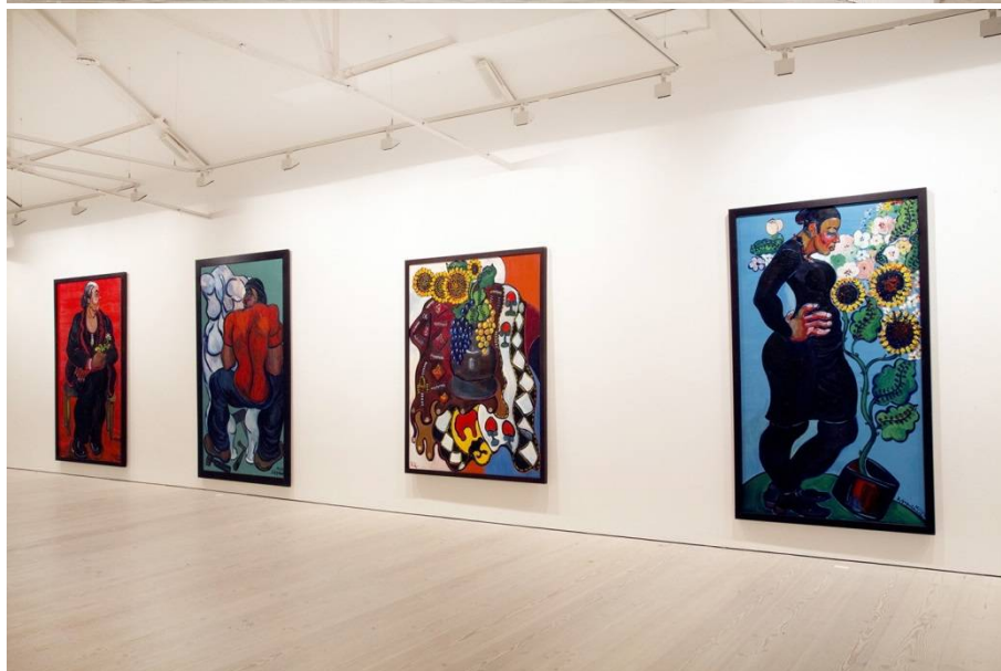
Рис. 5. Выставка «Зураб Церетели: Больше, чем жизнь» в Saatchi Gallery (Лондон).

Яркой и запоминающейся была выставка работ художника на международной художественной ярмарке ESTE ARTE 2019 в г. Пунта-дель-Эсте (Уругвай) в начале января 2019 г. Живописные работы З.К. Церетели – портреты и натюрморты, полные энергии цвета и жизнеутверждающей силы, покорили зрителя авторским позитивным отношением к миру, непосредственностью, внутренней свободой.