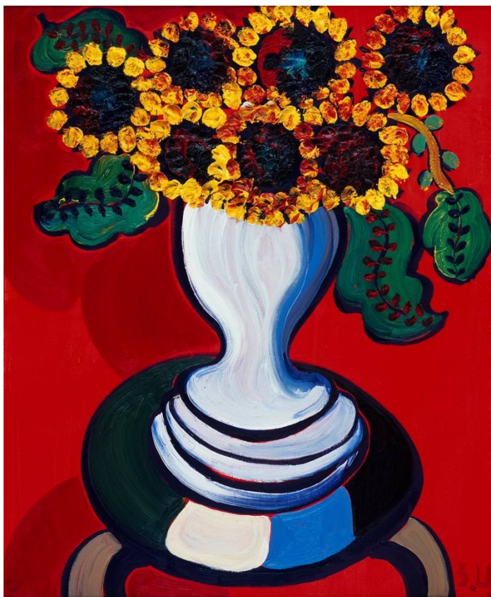
Рис. 6, 7. Произведения из экспозиции З.К. Церетели на международной художественной ярмарке ESTE ARTE 2019 в Уругвае.