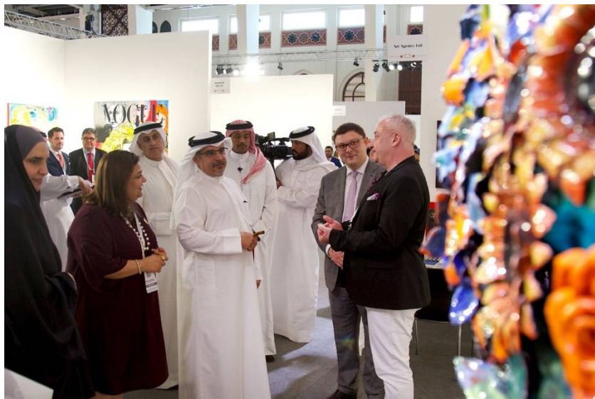
Рис. 10. Выставка произведений З.К. Церетели в Бахрейне.

Заслуживает отдельного упоминания и выставка работ З.К. Церетели на Международной художественной ярмарке «Art Bahrain Across Borders 2019» . Выставка посвящена центральному объекту в творчестве Зураба Церетели – цветам. Цветы для художника – не просто натюрморт, это концепция его творческого развития, особого художественного видения. На языке цветов мастер делится со зрителем радостями и печалью, стремится выразить живописным языком все то, что невозможно высказать. Для него писать цветы – значит постоянно тренировать зрение, воображение, восприятие окружающего мира.