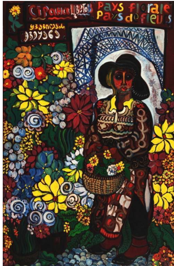
Рис. 8, 9. Произведения из экспозиции З.К. Церетели на международной выставке современного искусства «АртПариж» в Гран Пале.