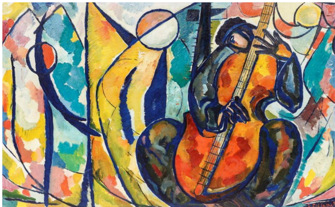
Рис. 15. На выставке «Персоналии – Зураб Цертели» в Лихтенштейне.

Совсем другим представлено творчество З.К. Цертели на выставке «Персоналии – Зураб Цертели» в Государственном музее княжества Лихтенштейн. В экспозиции – живописные работы и рисунки, чьи сюжеты основаны на традициях, фольклоре, мифах и религиозных мотивах. Свойственная работам художника монументальность в данном случае означает величие, великолепие в лучшем смысле этого слова, нечто значимое и возвышенное в масштабе создаваемых человеком творений. Его произведения пронизаны религиозным чувством и мифологическими мотивами.