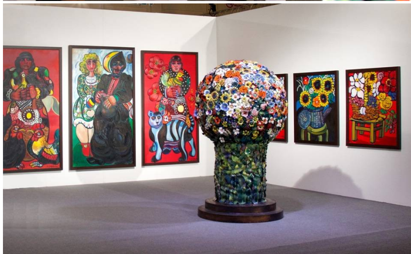
Рис. 11. Выставка произведений З.К. Церетели в Бахрейне.

«Почти везде, где я живу, работаю, будь то Москва, Париж или Нью-Йорк, мне недостает света. Посмотрите, как много серых дней, когда не хватает солнца. А я свою порцию солнца получаю от цветов! Они передают мне ощущение цвета живого, объемного», – любит говорить художник. Именно в этих цветочных натюрмортах проявилось то особое свойство работ Зураба Константиновича, которое можно назвать геном позитива и жизнерадостности.