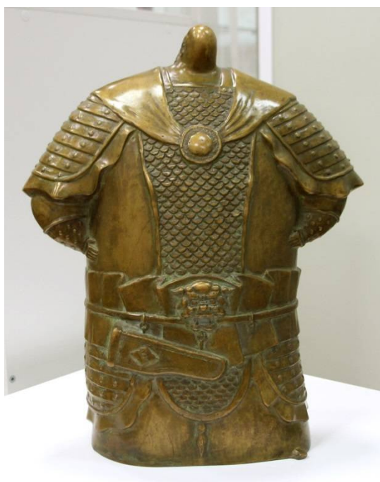
Рис. 9. Бато Дашицыренов. Генерал. 2007. Бронза. 36 x 24 x 16 см.