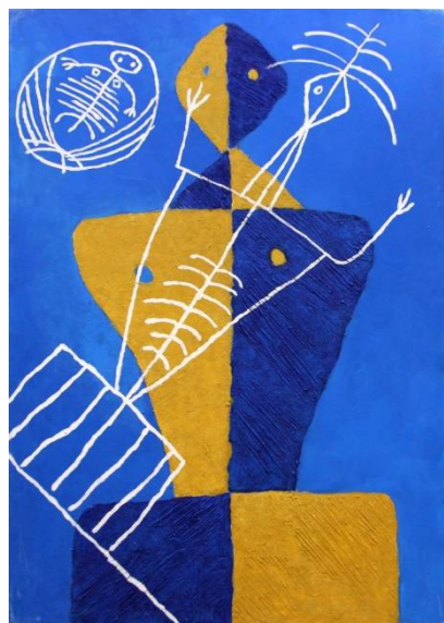
Рис. 11. Бато Дашицзыренов. Материнская линия II. 2007. Холст, масло. 148 x 102 см.