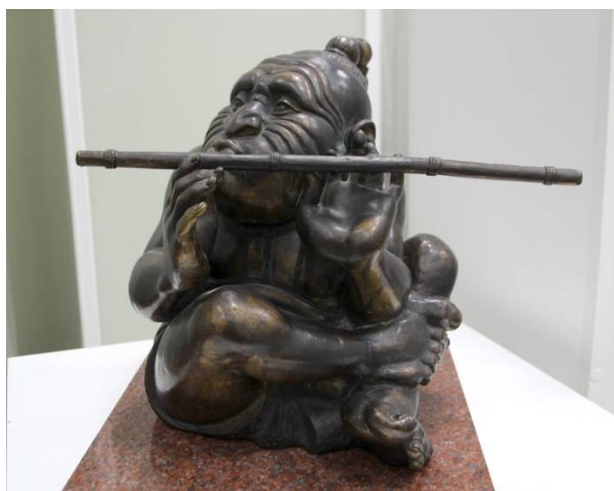
Рис. 4. Бато Дашицыренов. Музицирующий демон II. 2004. Бронза.