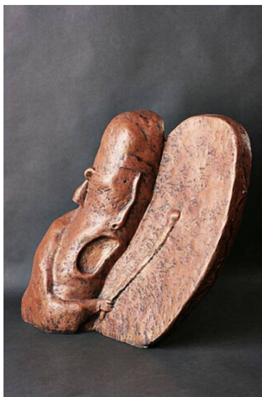
Рис. 16. Бато Дашицыренов. Шаман. Бронза 88 × 80 × 50 см.