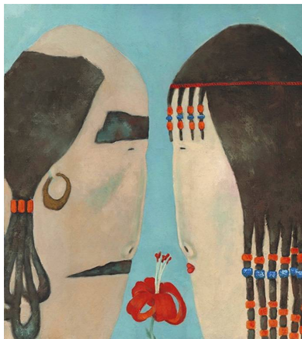
Рис. 7. Бато Дашицыренов. Алая саганка. 2005. Холст, масло. 85 x 95.

Совсем по-иному решены головы в скульптурных работах Дашицыренова. Укрупненную гипертрофированную голову всадника и воина можно увидеть также в скульптурах Даши Намдакова – современника и земляка, например, «Генерал» (2010), где голова военачальника как бы подменяет собой тело, становится сутью образного выражения (рис. 8). Зато в скульптурном решении Дашицыренова образы воинов решены в другом ключе (рис. 9).