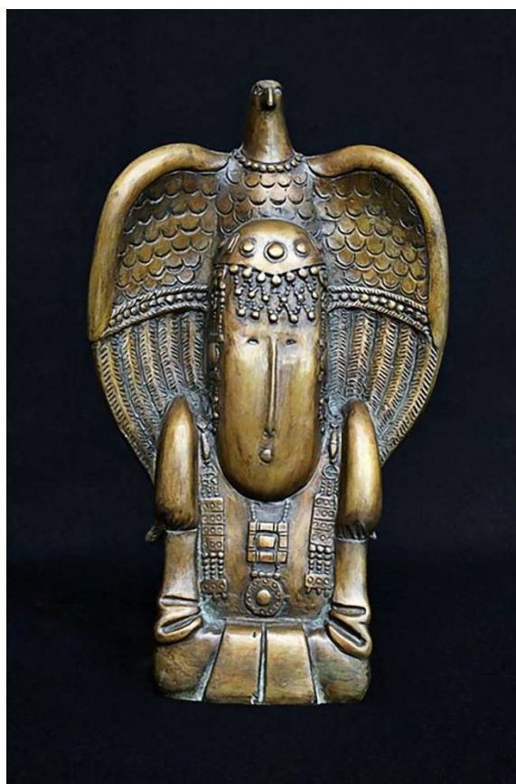
Рис. 18. Бато Дашицыренов. Тотем. Бронза. 26 x 16 x 6 см.

Именно к этому кругу ассоциаций относится и скульптурная композиция Дашицыренова «Тотем» (рис. 18). Здесь художник удачно обыгрывает головной убор монгольских женщин (наподобие рогов), в качестве завершения которого иногда использовались перья птиц.