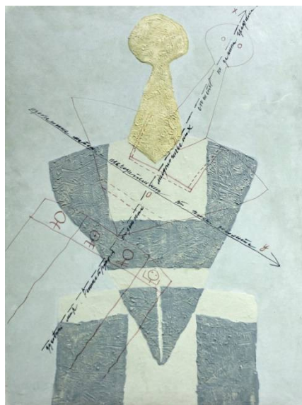
Рис. 12. Бато Дашицзыренов. Материнская линия IV. 2007. Холст, масло. 148 x 102 см.