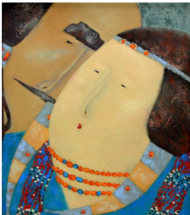
Рис. 6. Бато Дашицыренов. Флирт. 2004. Холст, масло.