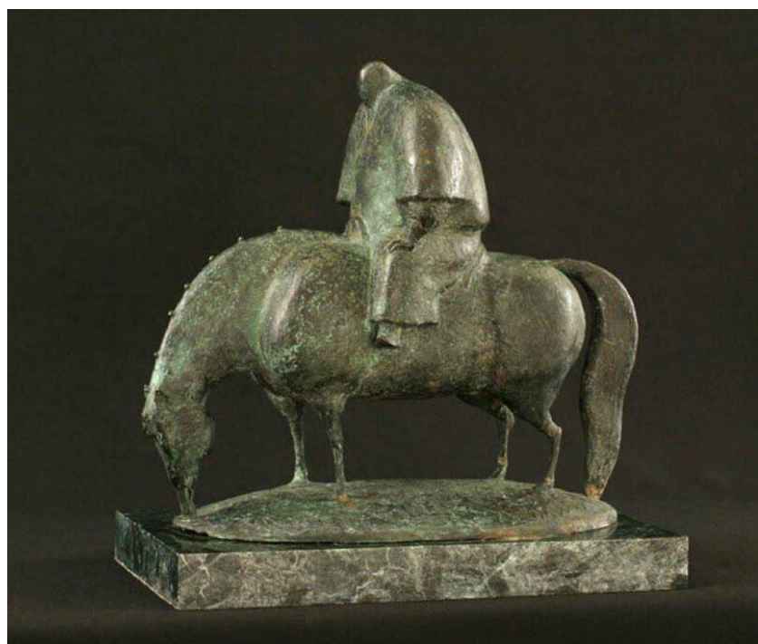
Рис. 10. Бато Дашицыренов. К последнему морю. 2004. Бронза. 28 × 27 × 14 см.

Особенно выразительны образы воина на коне. У Дашицыренова конь и всадник слиты воедино, их невозможно разъединить. Воин на своем верном скакуне предстает вечным путником степного мира, этого космического пространства со своими особыми законами, своими обитателями. Особенно выразительна скульптура «К последнему морю» (рис. 10). Воин прошел множество дорог, склонил голову – все тот же небольшой круглый шар, и конь, верный своему хозяину, уткнулся мордой в землю. Темно-зеленая патина, словно патина времени, покрывает фигуру коня и частично всадника.