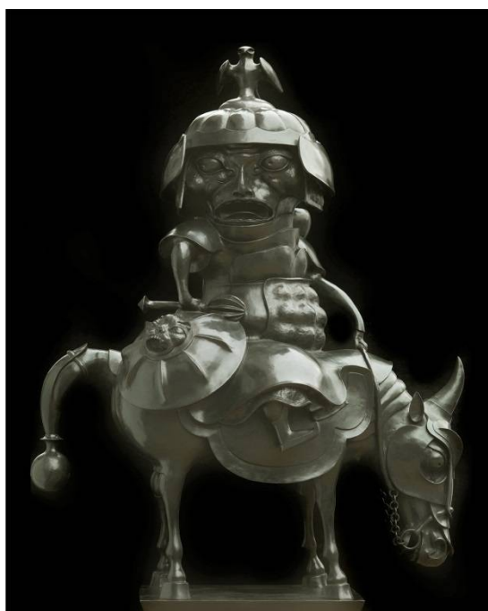
Рис. 8. Даши Намдаков. Генерал. 2010. Бронза; литье, патинирование. 170 x 116 x 73 см.

Совсем по-иному решены головы в скульптурных работах Дашицыренова. Укрупненную гипертрофированную голову всадника и воина можно увидеть также в скульптурах Даши Намдакова – современника и земляка, например, «Генерал» (2010), где голова военачальника как бы подменяет собой тело, становится сутью образного выражения (рис. 8). Зато в скульптурном решении Дашицыренова образы воинов решены в другом ключе (рис. 9).