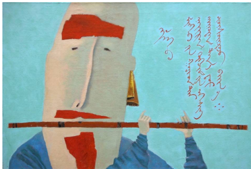
Рис. 2. Бато Дашицыренов. Мелодия. 2008. Холст, масло.

Для Дашицыренова состояние души выражено не только в цвете, пластике, но и в настроении, звучащем, как голос души, как музыка. Отсюда отчетливая приверженность музыкальной тематике. Так, в живописной композиции «Мелодия» (рис. 2) художник создает особое музыкальное настроение. Холст предельно декоративен, выглядит, почти как аппликация. Крупные головы и небольшие руки музыкантов, подчеркнутые яркостью и насыщенностью цвета, передают игру на традиционных инструментах монгольских народов. Для завершения композиции художник вводит как фон тонкую вязь вертикального монгольского письма.