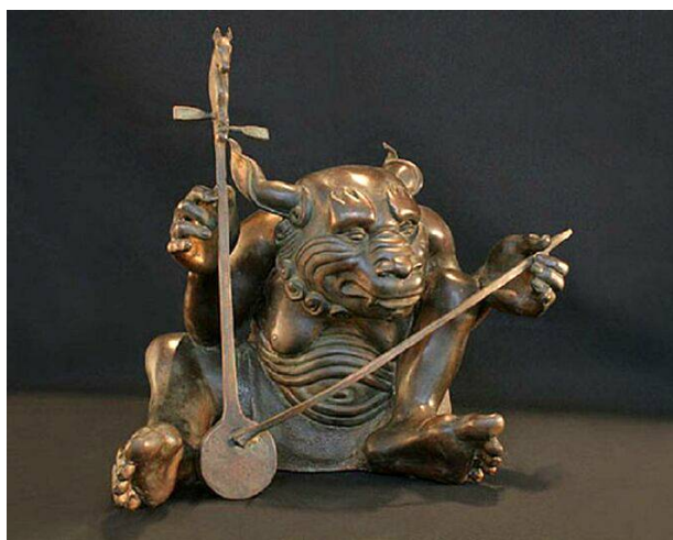
Рис. 3. Бато Дашицыренов. Музицирующий демон I. 2004. Бронза. Источник: [4].

Образы музыкантов представлены в еще одной серии – скульптурной – «Музицирующие демоны» (рис. 3-5). В легком и свободном освоении круглой скульптуры, изображающей музицирующих персонажей, пригодился опыт театрального художника. Сама пластика демонических фигур, инструменты, на которых они самозабвенно играют ( морин-хур , лимбэ , бубен), близки к средневековой монгольской скульптуре. Но прототипы этих образов можно найти и в древних языческих культах многих народов. Фигуры с демоническими отметинами, с коряво-уродливыми укрупненными конечностями выступают контрастом состоянию и выражению творческого экстаза на лицах этих мифологических существ.