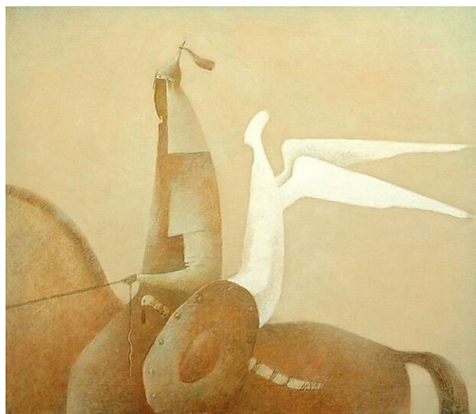
Рис. 14. Бато Дашицзыренов. Ангел. 2003. Холст, масло. 70 x 80 см. Источник: [4].

Наряду с интересом к маскам и «каменным бабам» Дашицзыренов обращается к другим излюбленным темам и сюжетам. Среди таких работ можно назвать композицию «Ангел» (рис. 14).