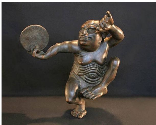
Рис. 5. Бато Дашицыренов. Музицирующий демон III. 2004. Бронза.

В живописи Бато Дашицыренова постепенно выработался свой почерк: крупные головы наподобие масок, обобщенно, в виде аппликаций решены брови, усы и борода – прием, восходящий своими истоками к шаманским онгонам. Художник делает акцент только на голове, которая занимает практически всю поверхность холста или листа картона. Именно в голове, по представлениям бурят, сосредоточен источник души ( сулдэ ) человека. Черты лица прописаны широким мазком. Голова и лицо мужчины в живописных работах («Флирт», 2004; «Алая саранка», 2005) узнаваемы, в них явственно прочитываются портретные черты самого художника (рис. 6, 7).