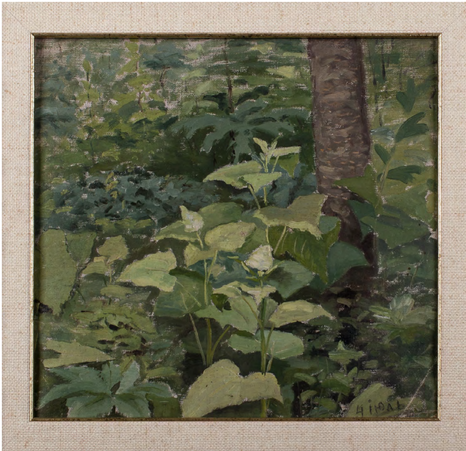
3. В.Г. Шешунов. Какалия копьевидная. Нач. XX в. Марлевка, толстый картон, масло, живопись, кисть. 32,4 x 34. Хабаровский краевой музей имени Н.И. Гродекова

организовано “Амурское общество поощрения художеств”, а в Иркутске (в 1909–1915 годах) он трижды выставлял свои картины на художественных выставках музея Восточно-Сибирского отдела Русского географического общества. И уже не для продажи — для души» [12, с. 23]. В 1920 году по инициативе В.Г. Шешунова и других местных художников в Никольске-Уссурийском было открыто художественное училище, «...созданное с целью “содействовать художественному развитию местного населения и доставлять образование для лиц, желающих изучать живопись, скульптуру и архитектуру, имея в виду поступление этих лиц в Высшее художественное училище при Академии