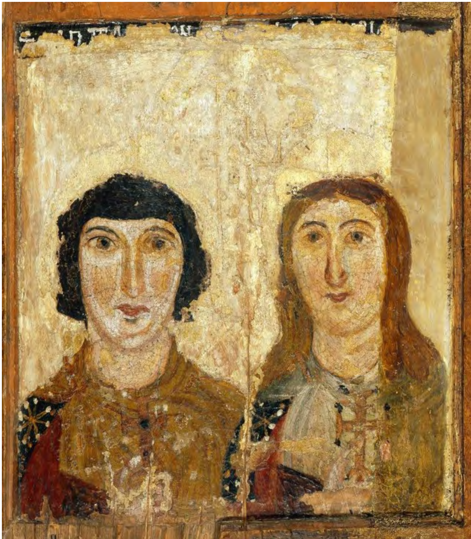
5. Икона «Мученик и мученица (Платон и Гликерия?)» из коллекции Порфирия Успенского. VII в.

Восковая живопись. 54,2 x 48,6 x 0,7-0,8. Национальный музей искусств имени Богдана и Варвары Ханенко, Киев.