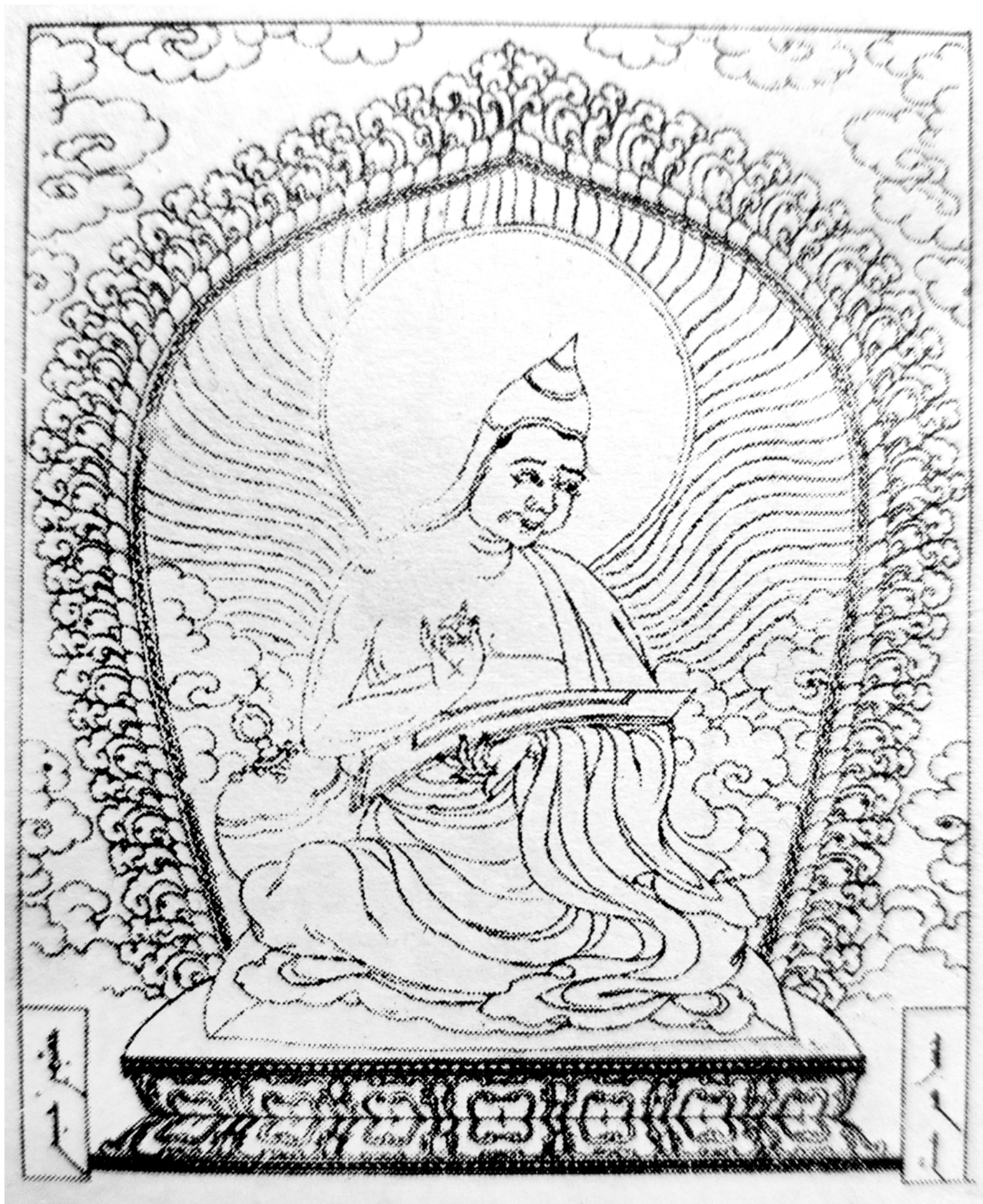
1. Изображение Дигнаги в монгольском Ганджуре