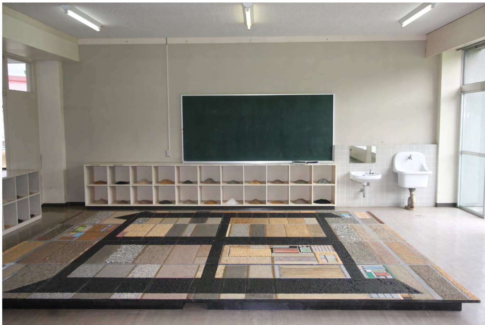
3. В. Наседкин. Google Earth. Поля Токомати. (Фрагмент).