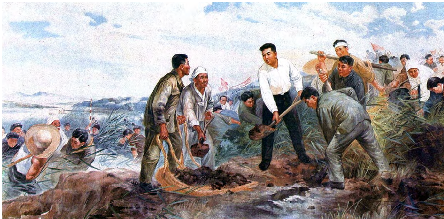
2. Чон Ёнман. Великий вождь товарищ Ким Ирсен делает первый взмах лопатой на месте работ по изменению русла реки Потхонган.