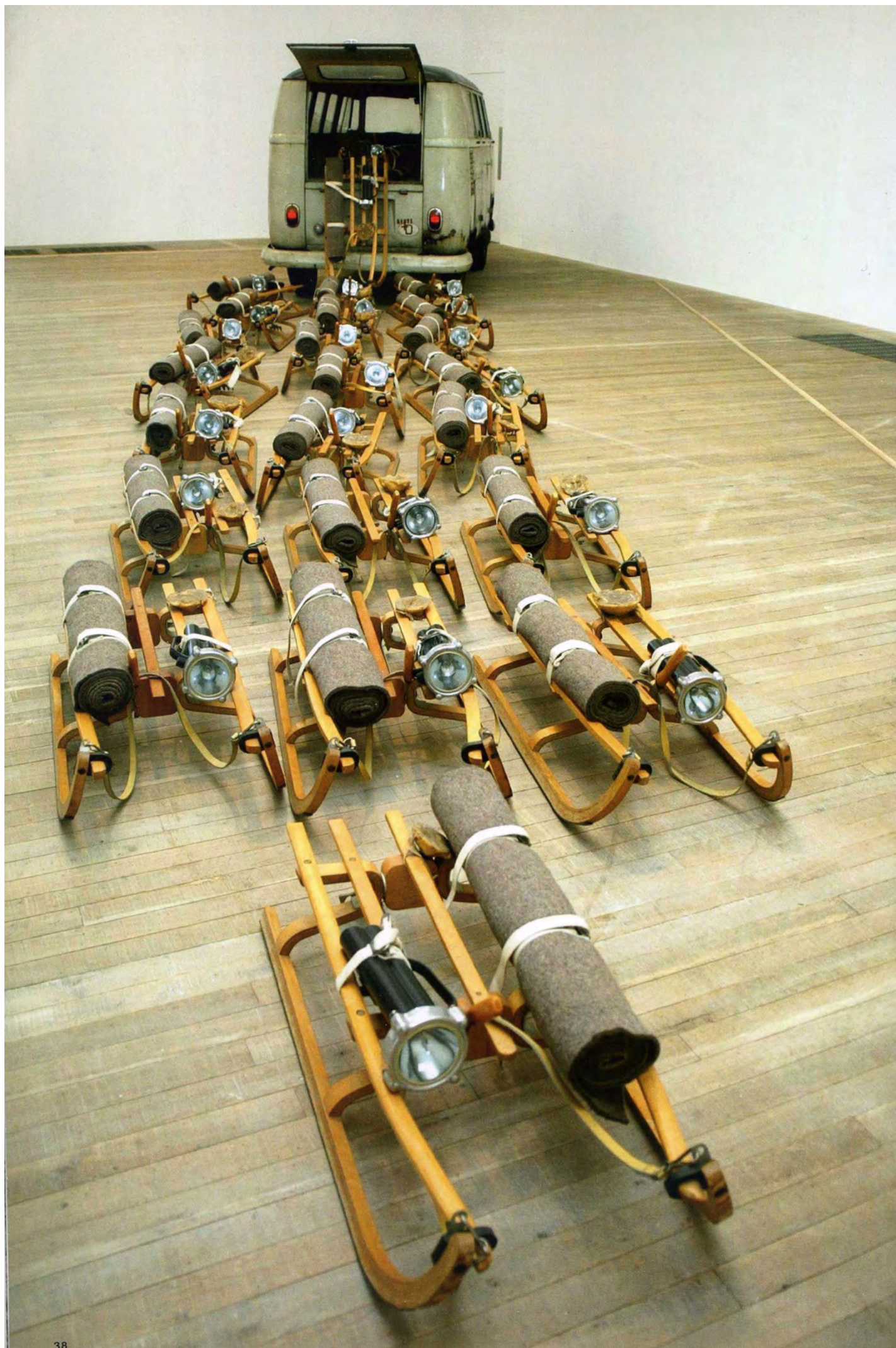
4. Йозеф Бойс. Инсталляция «Стая». 1969. Новая галерея, Кассель, ФРГ.