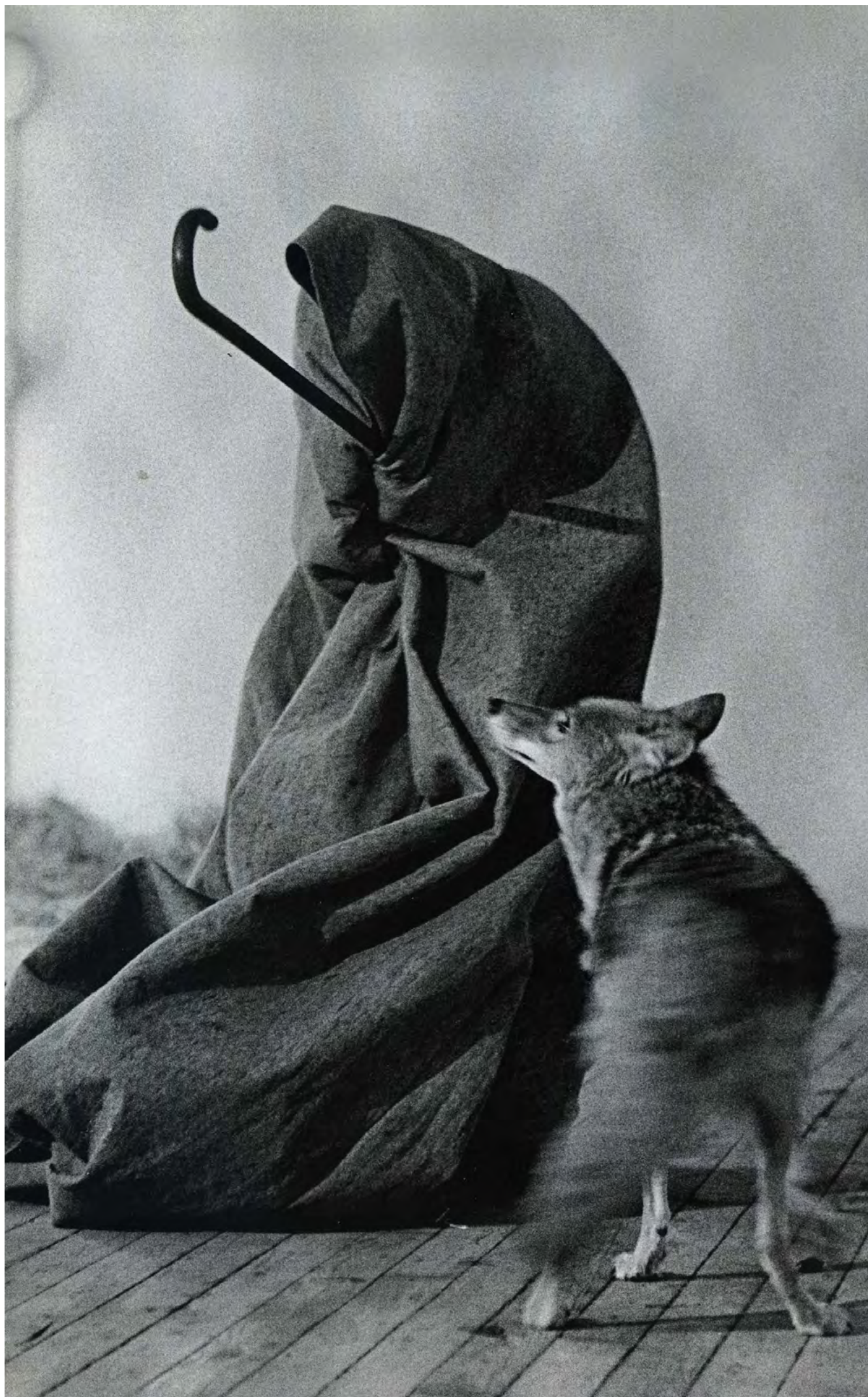
7. Йозеф Бойс. Перформанс «Койот: Я люблю Америку, и Америка любит меня» (Coyote: I Love America and America Loves Me).