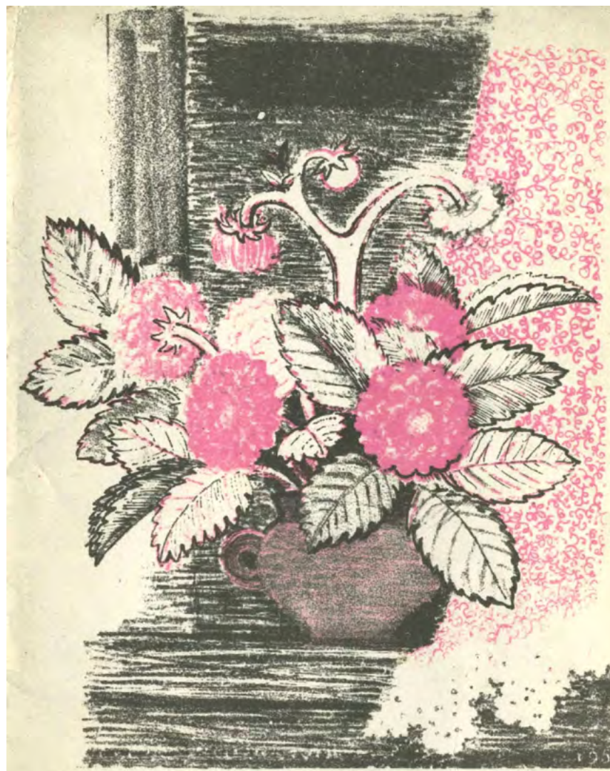
8. А.Н. Якобсон.