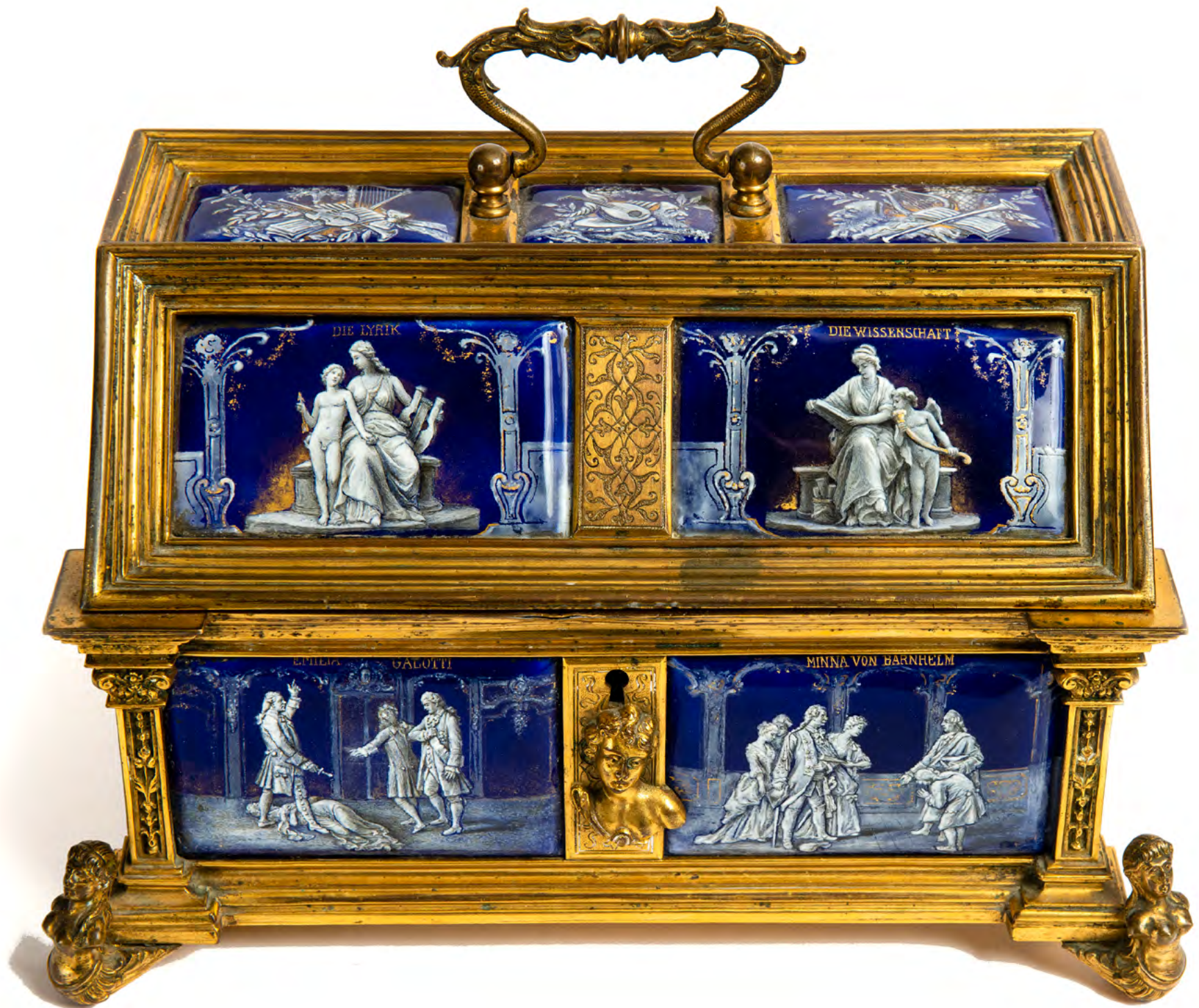
12. Неизвестный мастер. Сундук-реликварий с портретом и сценами из произведений Готхольда Эфраима Лессинга.

Эмаль, металл, гравировка. Высота 15,5 см. Частное собрание.