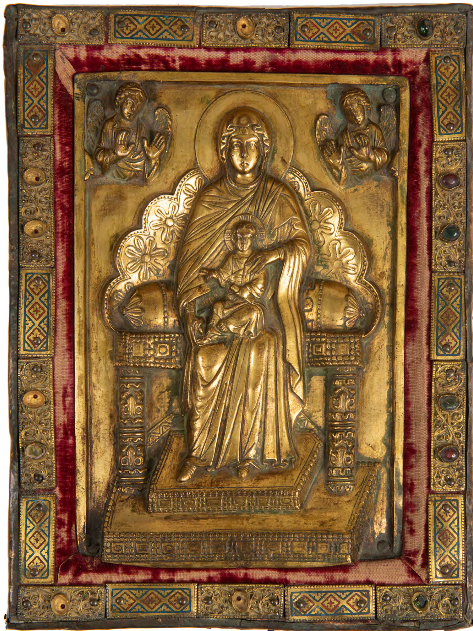
5. Неизвестный мастер. Плакетка-оклад книжного переплета с изображением Мадонны на троне с Младенцем Христом.