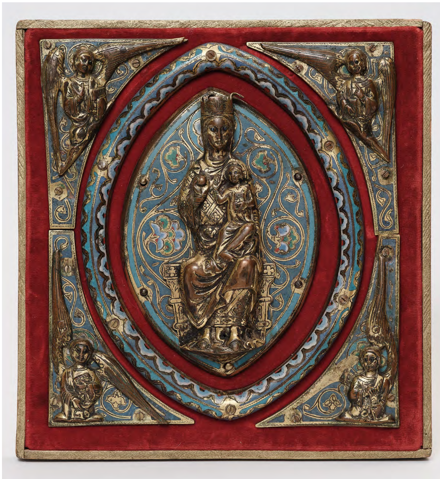
3. Неизвестный мастер. Плакетка с пластиной выемчатой эмали с изображением Мадонны на троне с Младенцем Христом.