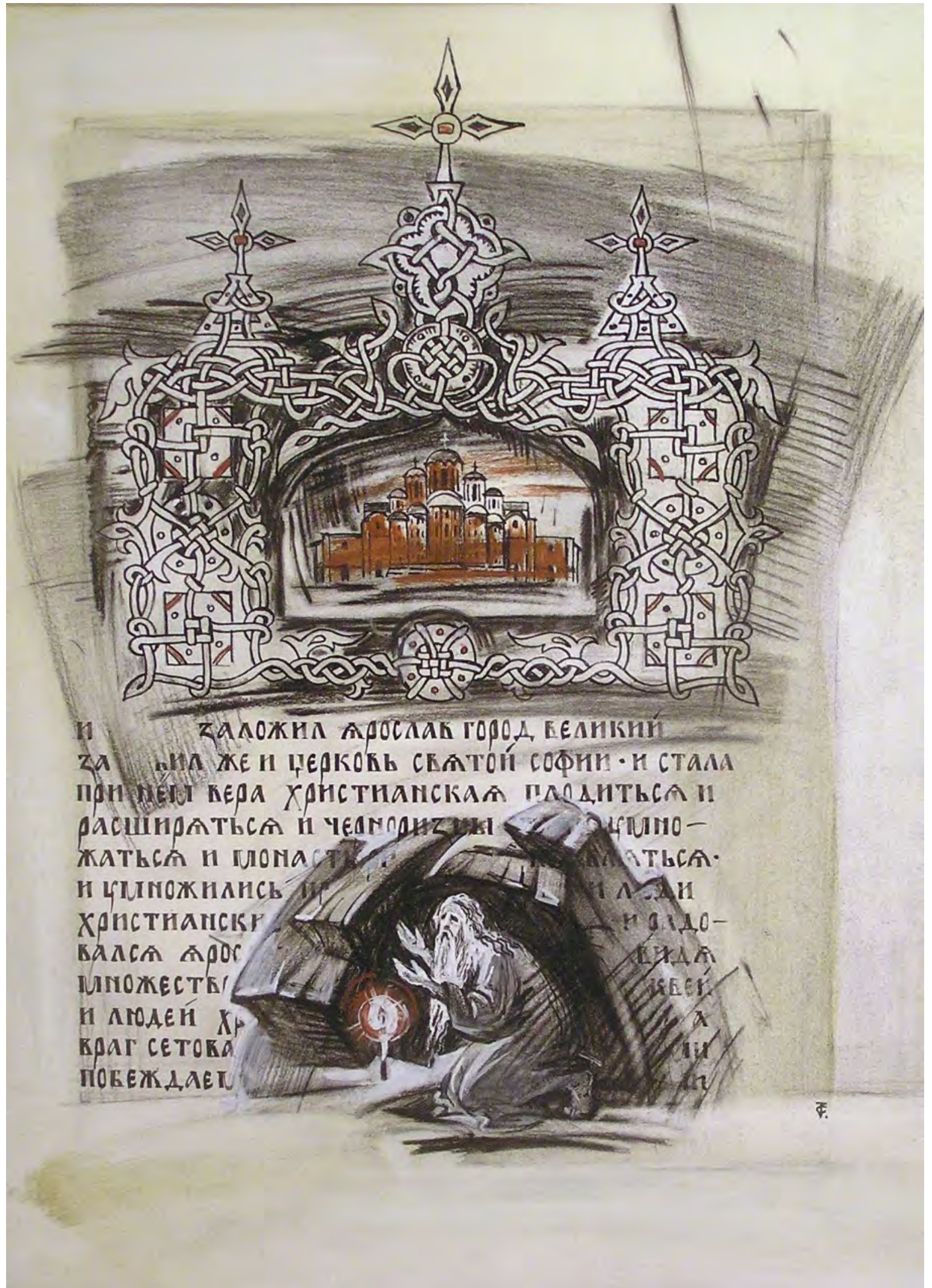
5. С.В. Тимохов. История Софии Киевской. Из серии «Страницы русской истории». 2009. Бумага, тушь, гуашь. 41 × 30. Собственность художника