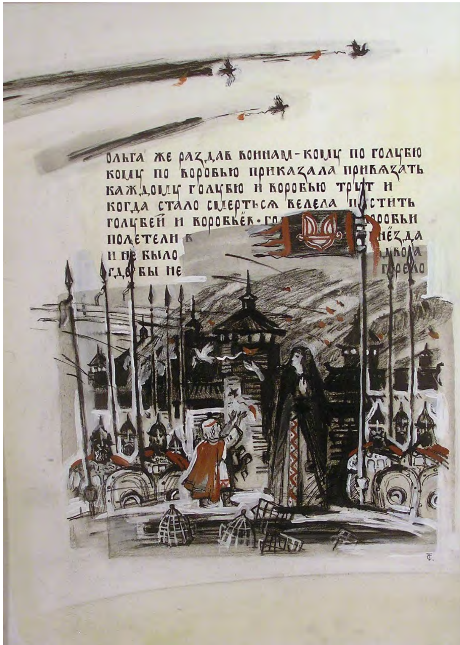
2. С.В. Тимохов. Четвертая мечь Ольги древлянам. Сожжение Искоростеня. Из серии «Страницы русской истории». 2009. Бумага, тушь, гуашь. 41 × 30. Собственность художника