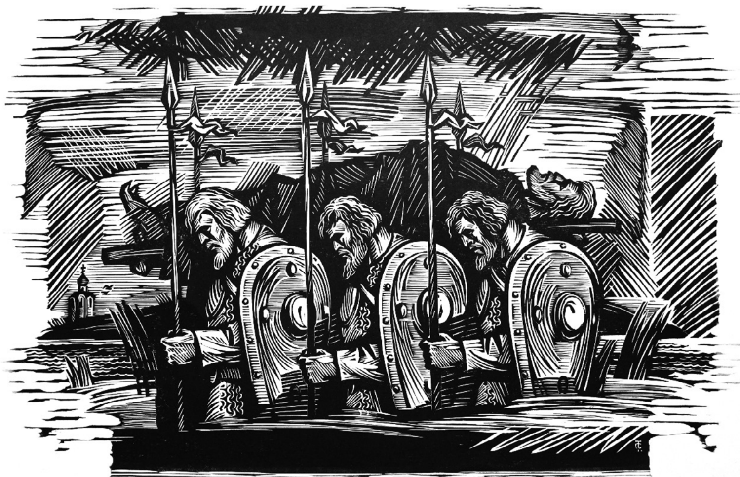
10. С.В. Тимохов. Евпатий Коловрат. Из серии «Лихолетье». 2016. Обрезная ксилография. 37 × 60. Собственность художника

контрасты...» [5, с. 51], в лаконичных черно-белых станковых гравюрах Тимохова парадоксальным образом проступают колористические особенности живописи — кажется, зритель воспринимает не только сюжет, но и чувствует всю палитру красок, заложенную в композиции, что придает еще большей драматичности изображенному.