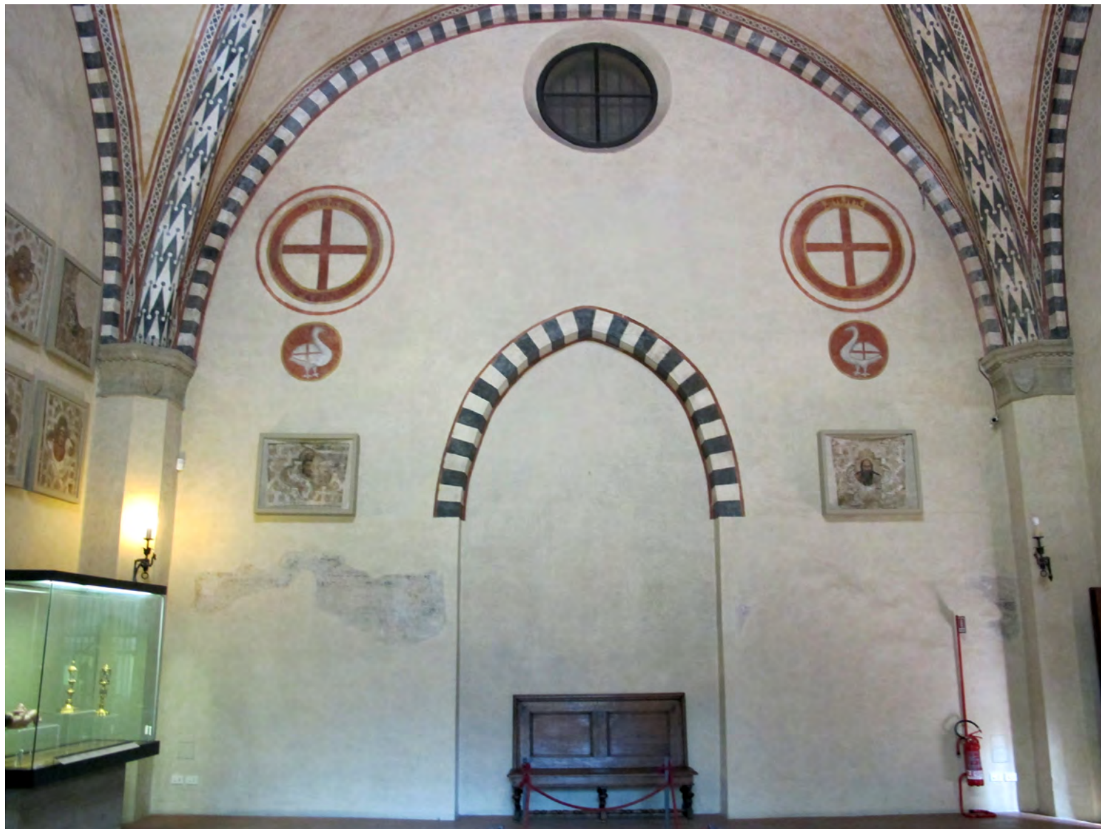
1. Неизвестный мастер. Восточная стена капеллы Убриаки, церковь Санта Мария Новелла.