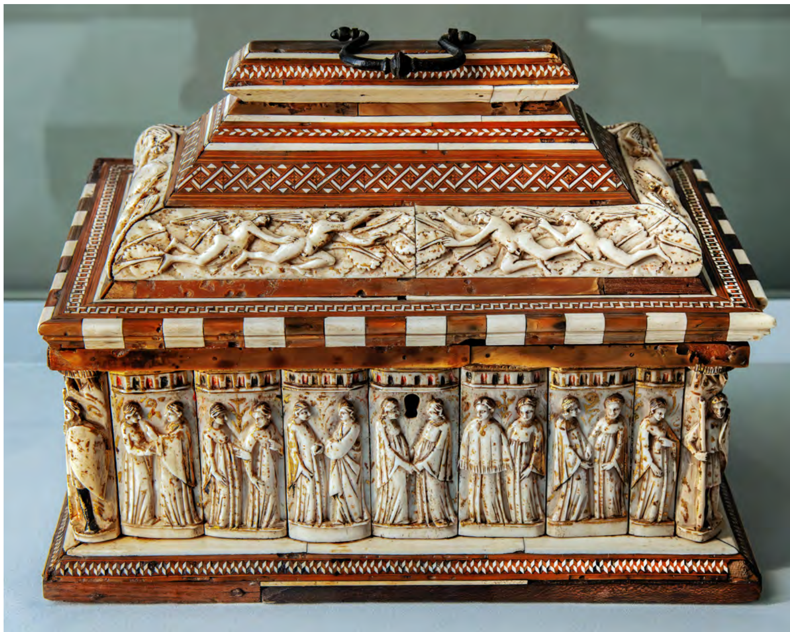
6. Мастерская во владении Бальдассаре Убриаки или ранние подражатели. Ларец с парами.