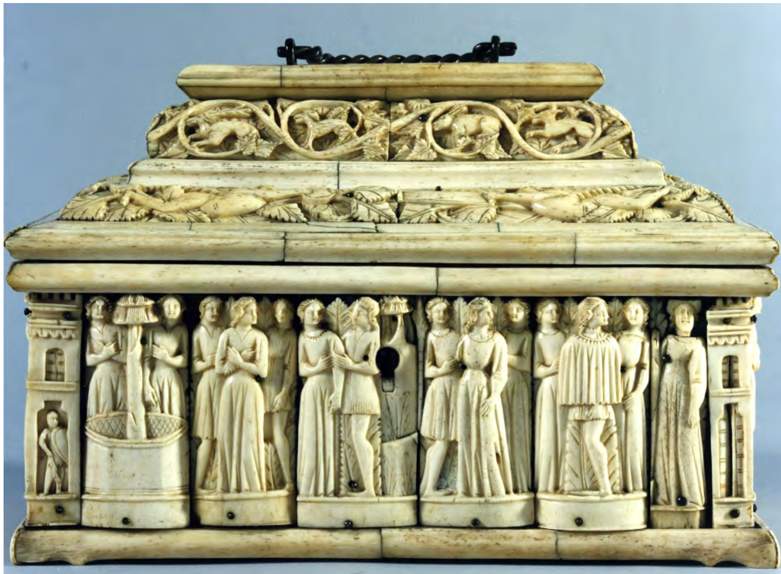
10. Мастерская фигур на гвоздях. Ларец с куртуазными сценами. Ок. 1370. Дерево, кость, медь. 19 × 29,5 × 15,5. Палаццо Босси Бокки, Парма.

в палитру ни зеленый, ни лазурный цвета, сохраняя верность сочетанию алого, черного и золотого — триаде цветов, полюбившейся венецианским мастерам росписи кости в XIII–XIV веках [9, с. 213]. Строгое сочетание оттенков, отобранное «Мастерской фигур на гвоздях», было выдержано и в изысканной интарсии, которую выкладывали исключительно из черных и белых элементов, формирующих пересекающиеся круги. В противоположность более поздним мастерским, ремесленники «фигур на гвоздях» не задумывали сложных пространственных построений и не вырезали детали пейзажа: иллюзорная глубина в данном случае может быть прочитана только по наслаивающимся друг на друга силуэтам персонажей, которые изображают группы придворных. В сравнительно небольших шкатулках «Мастерской фигур на гвоздях» нет сложных повествований: все сцены здесь связаны с радостями аристократической жизни, часы которой отведены любви, охоте с соколами и псами, беседам у фонтана. На крышках ларцов изображены аллегории добродетелей, которые в дальнейшем перешли в репертуар мастерской