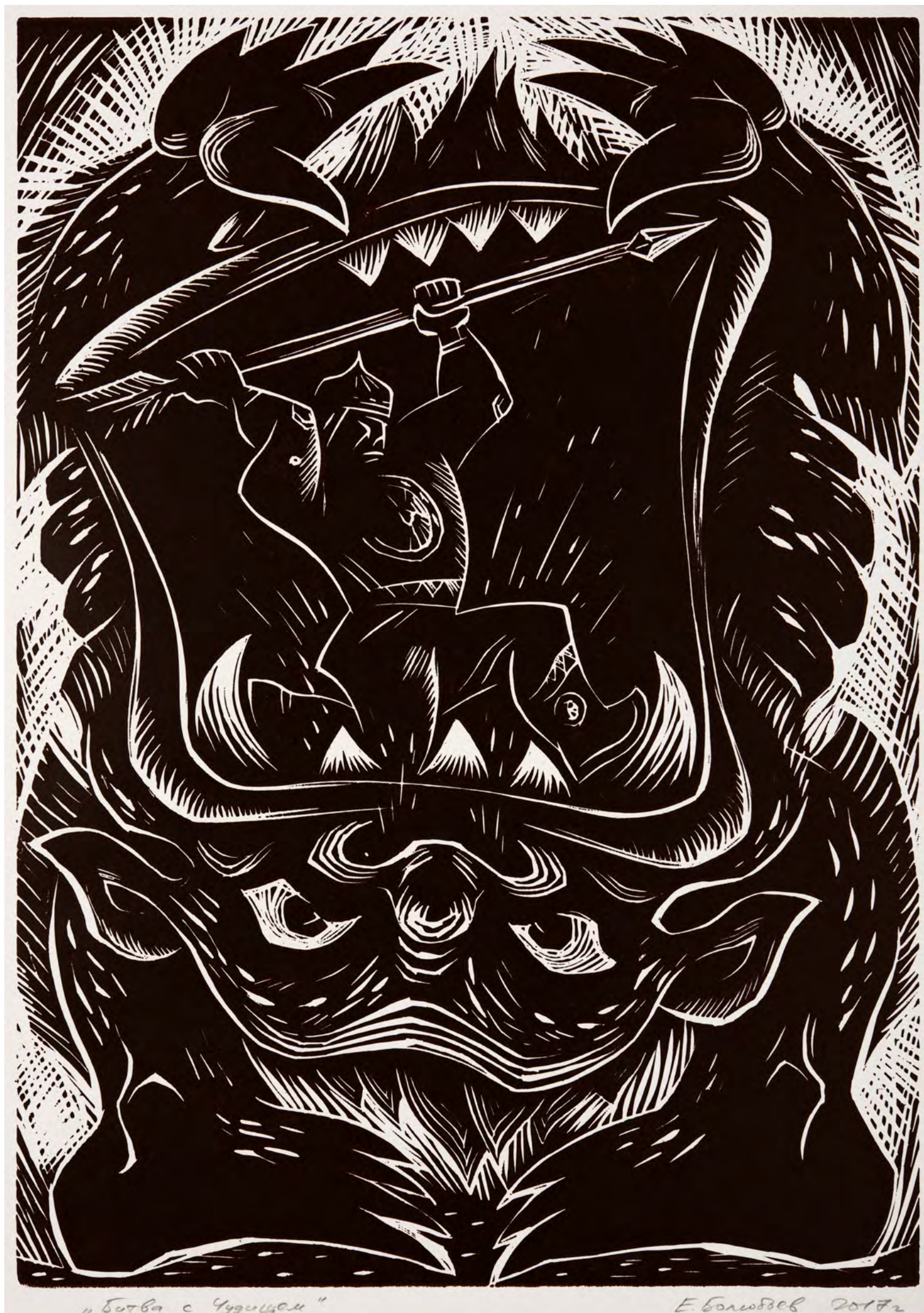
15. Е.А. Болсобоев. Битва с чудовищем. Из серии «Эпос Гэсэр». 2017. Бумага, тушь, гравюра на пластике. 61 × 43; 50 × 35. Национальный музей Республики Бурятия.