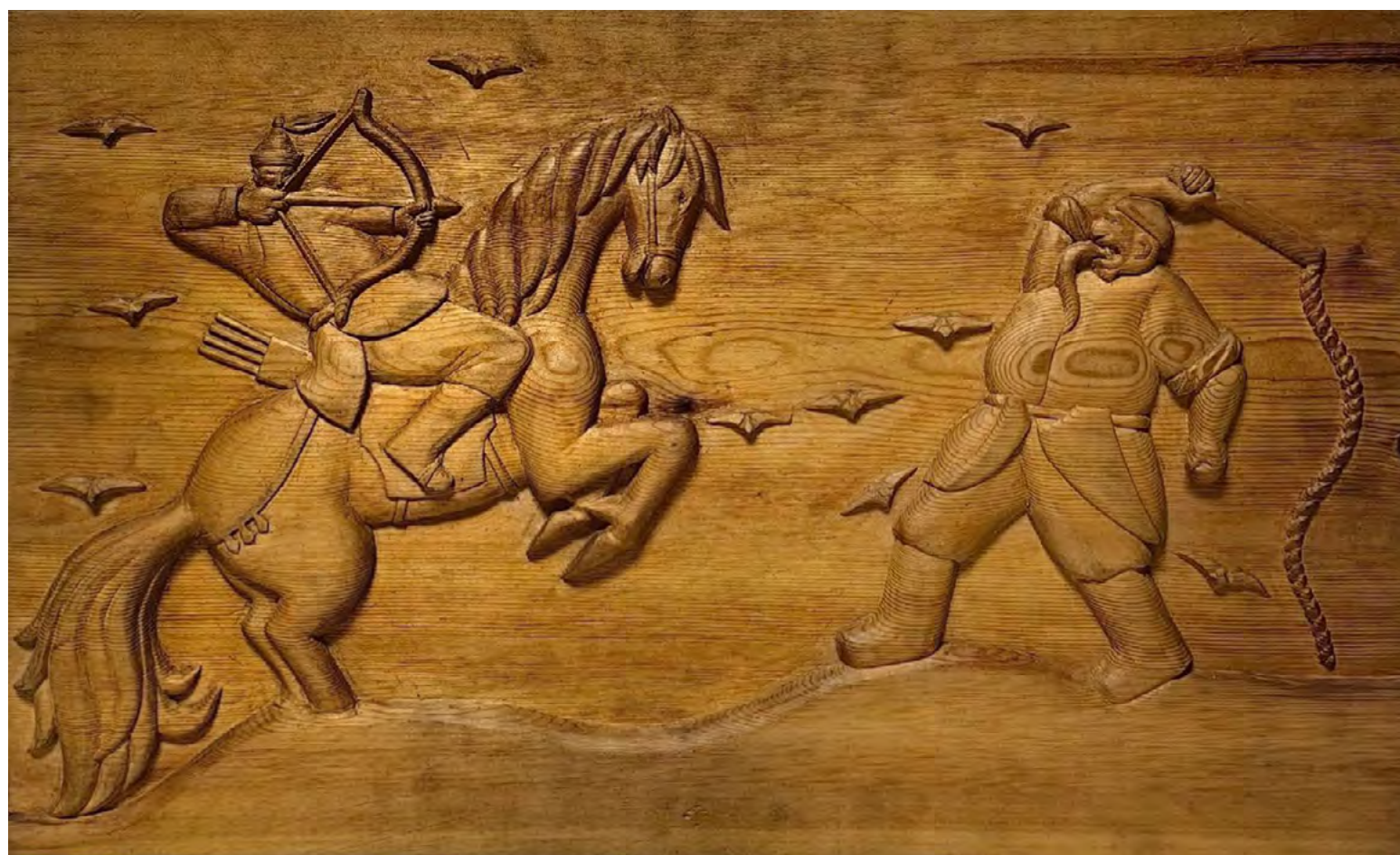
11. Мастера Всебурятской ассоциации развития культуры (ВАРК, 1991). Сэргэ (становое знамя) Гэсэра.