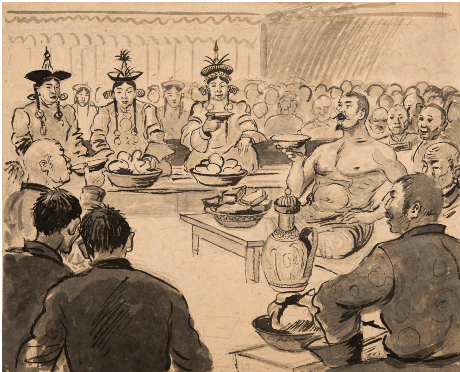
1. Ц.С. Сампилов. Эскиз к эпосу «Гэсэр». 1940–1944. Картон, тушь, акварель. 39 × 54. Национальный музей Республики Бурятия.

[8, с. 67]. Каждый лист насыщен энергией борьбы добра со злом и торжества над врагом. Особо примечателен сюжет, запечатлевший победу Гэсэра, где он отрывает голову чудовищу. Художник подчеркнул могучую силу младенца через гиперболизированное изображение отлетающего тела монстра, а роль героя-защитника дополнительно акцентирована образами родителей, застывших в оцепенении и страхе у колыбели (ил. 2). Серия работ Ф.И. Балдаева, созданная в 1958 году, состоит из пяти листов, выполненных в технике гуаши. Здесь Гэсэр предстает уже в образе зрелого воина, уверенно сражающегося с врагами.