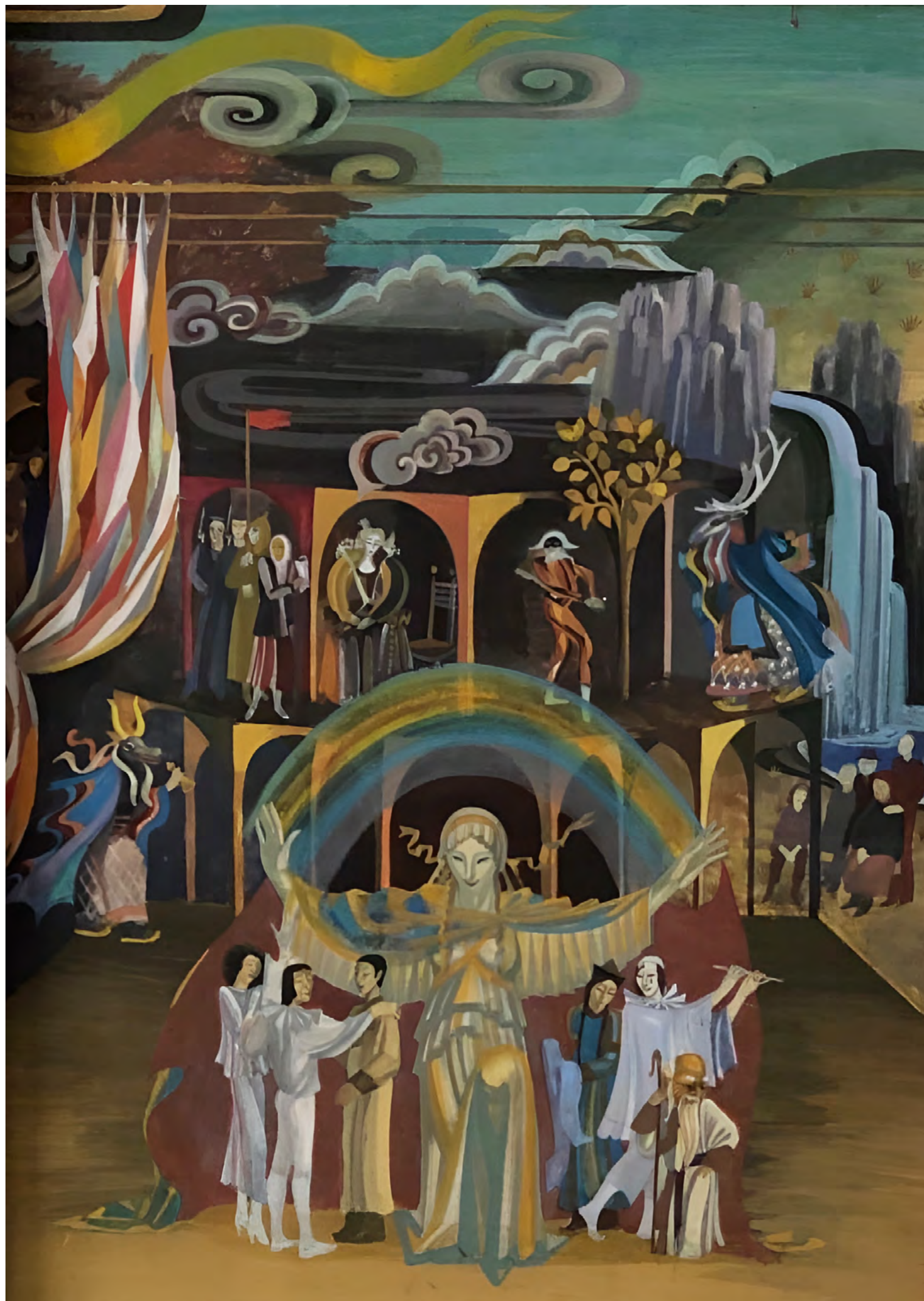
8. А.О. Цыбикова. На земле Гэсэра. Триптих, центральная часть. Эскиз.