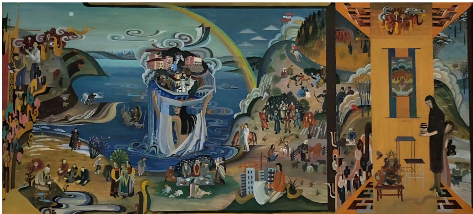
9. А.О. Цыбикова. На земле Гэсэра. Триптих, правая часть. Эскиз. 1982. Картон, гуашь, темпера. 70,5 × 126. Национальный музей Республики Бурятия.

осуществлялся тщательный отбор иконографических мотивов, выбор материалов и технологий, что позволило создать произведения, сочетающие в себе традиции бурятского искусства и современные художественные тенденции. В конце 2000-х годов президентом ВАРКа Г.Н. Манжуевым предметы были переданы в дар музею, где и хранятся в коллекции декоративно-прикладного искусства.