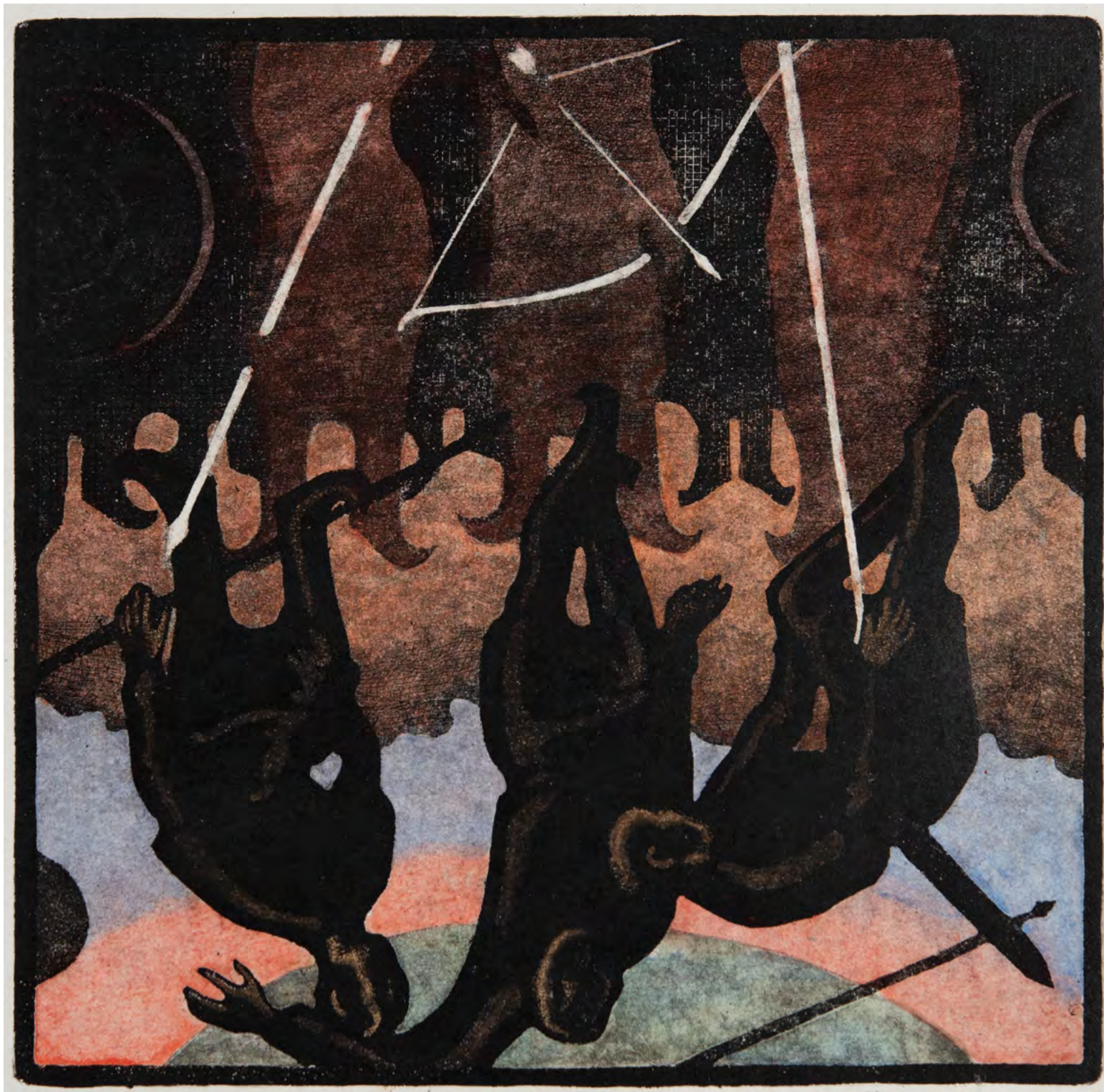
17. Д.В. Кантакова. Три брата. Из серии иллюстраций к эпосу «Гэсэр». 2020. Бумага, смешанная техника, акватинта. 33,2 × 37,2; 24,6 × 24,8. Национальный музей Республики Бурятия.