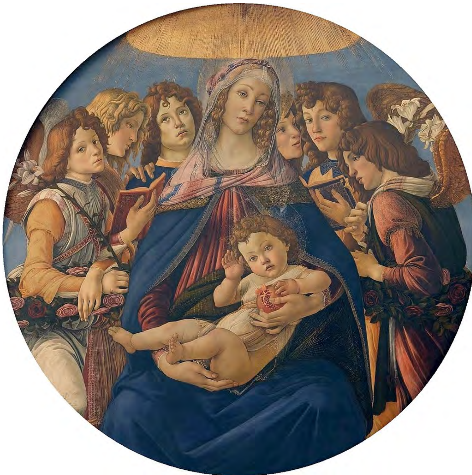
6. Боттичелли. Мадонна с гранатом. 1487. Дерево, темпера. D: 143,5. Уффици, Флоренция.

обрамлении, замыкающем узкое пространство, где показано действие. К трону, на котором восседают Мадонна с Младенцем, ведут высокие ступени. По сторонам от него предстоят святые. Одни ангелы раскрывают занавес над этим видением, другие демонстрируют орудия Страстей. В картину целого вводятся напоминания о христианской мистерии, начиная с рельефов «Благовещения» под аркой свода до постоянно звучащего мотива крестных мук Христа.