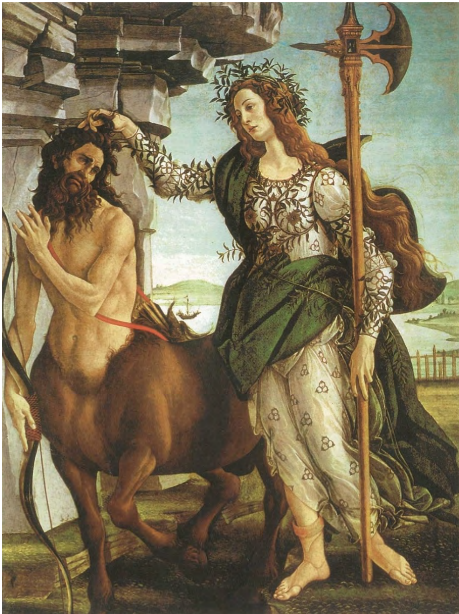
18. Боттичелли. Паллада и Кентавр. 1482. Холст, темпера. 207 × 148. Уффици, Флоренция.