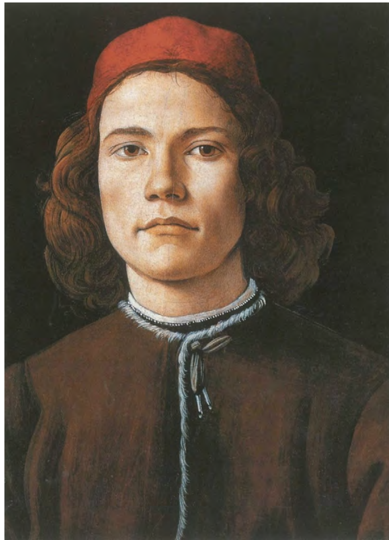
13. Боттичелли. Портрет Джулиано Медичи.

Ок. 1478. Дерево, темпера. 75,5 × 52,5. Национальная галерея, Вашингтон.