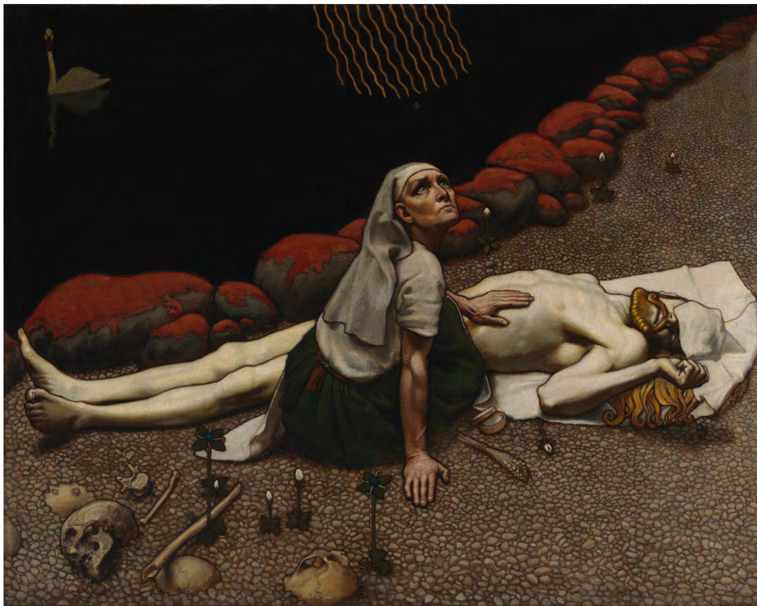
1. А. Галлен-Каллела. Мать Лемминкяйнена.