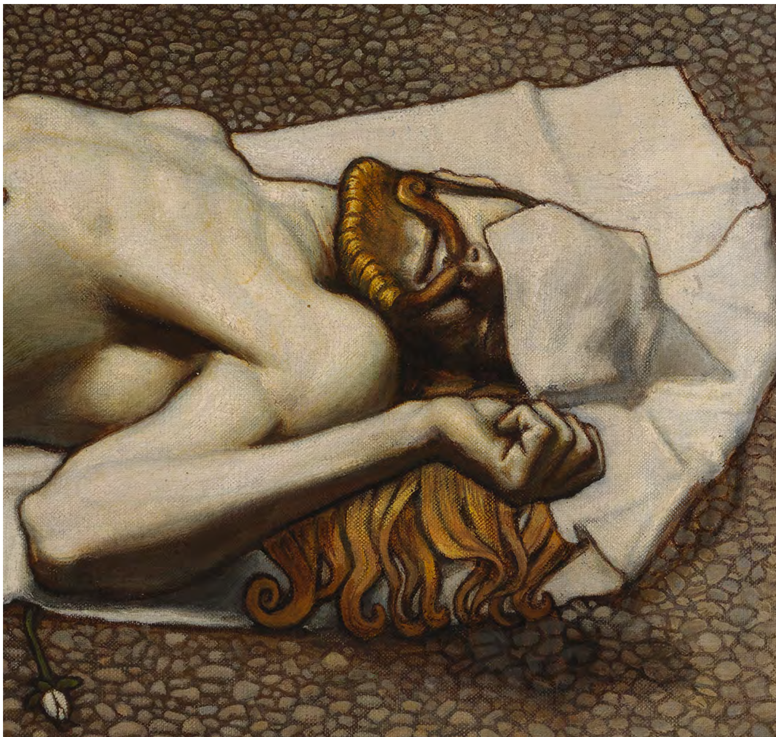
4. А. Галлен-Каллела. Мать Лемминкяйнена. Фрагмент. 1897. Холст, темпера. Художественный музей «Атенеум», Хельсинки, Финляндия

фигуры преимущественно белого цвета. Она распостерта слева направо, в очередной раз разделяя пространство произведения на верх и низ. Это позволяет предположить, что белая форма в центре произведения играет важную роль и выделяется на фоне остальных, нарушая общую для всей картины динамику перспективы.