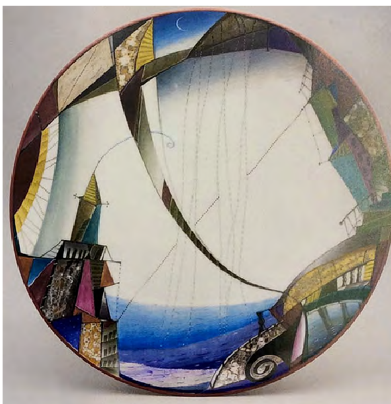
11. Т.В. Афанасьева (роспись). Тарелка «Красная пантера». 1991.

Фарфор; роспись подглазурная монохромная, надглазурная полихромная, позолота. 2,9 × 19,6. Государственный Эрмитаж. Музей Императорского фарфорового завода.