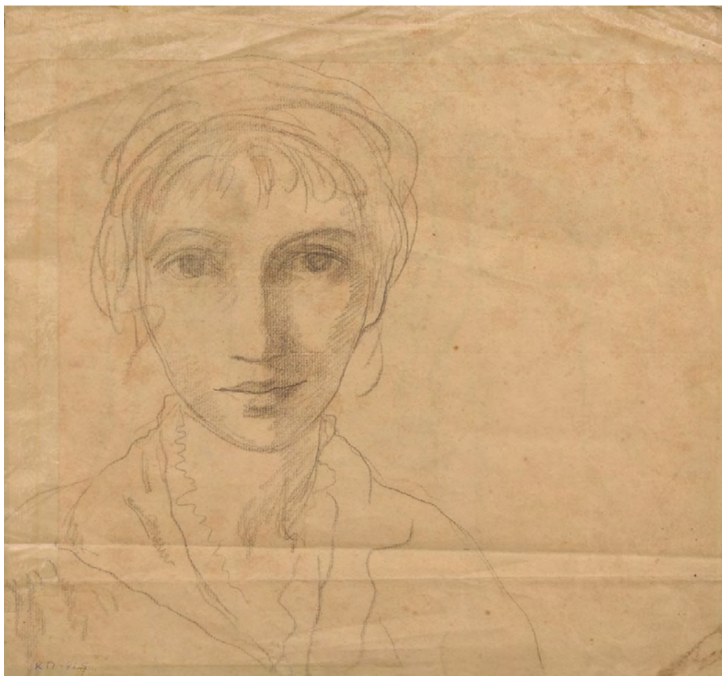
7. З.Е. Серебрякова. Автопортрет.