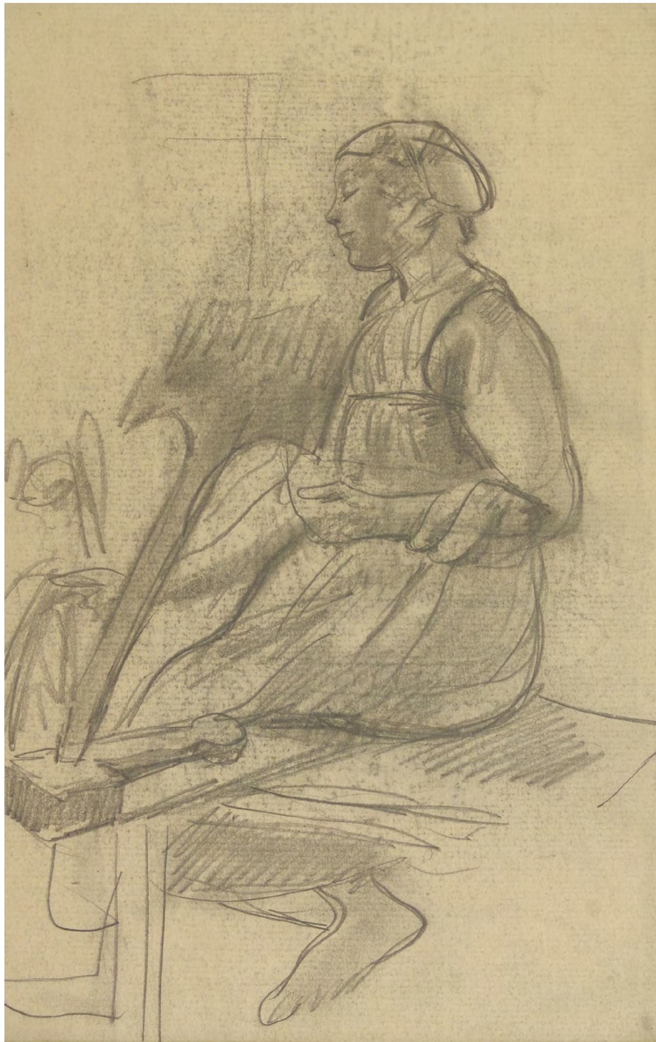
1. З.Е. Серебрякова.