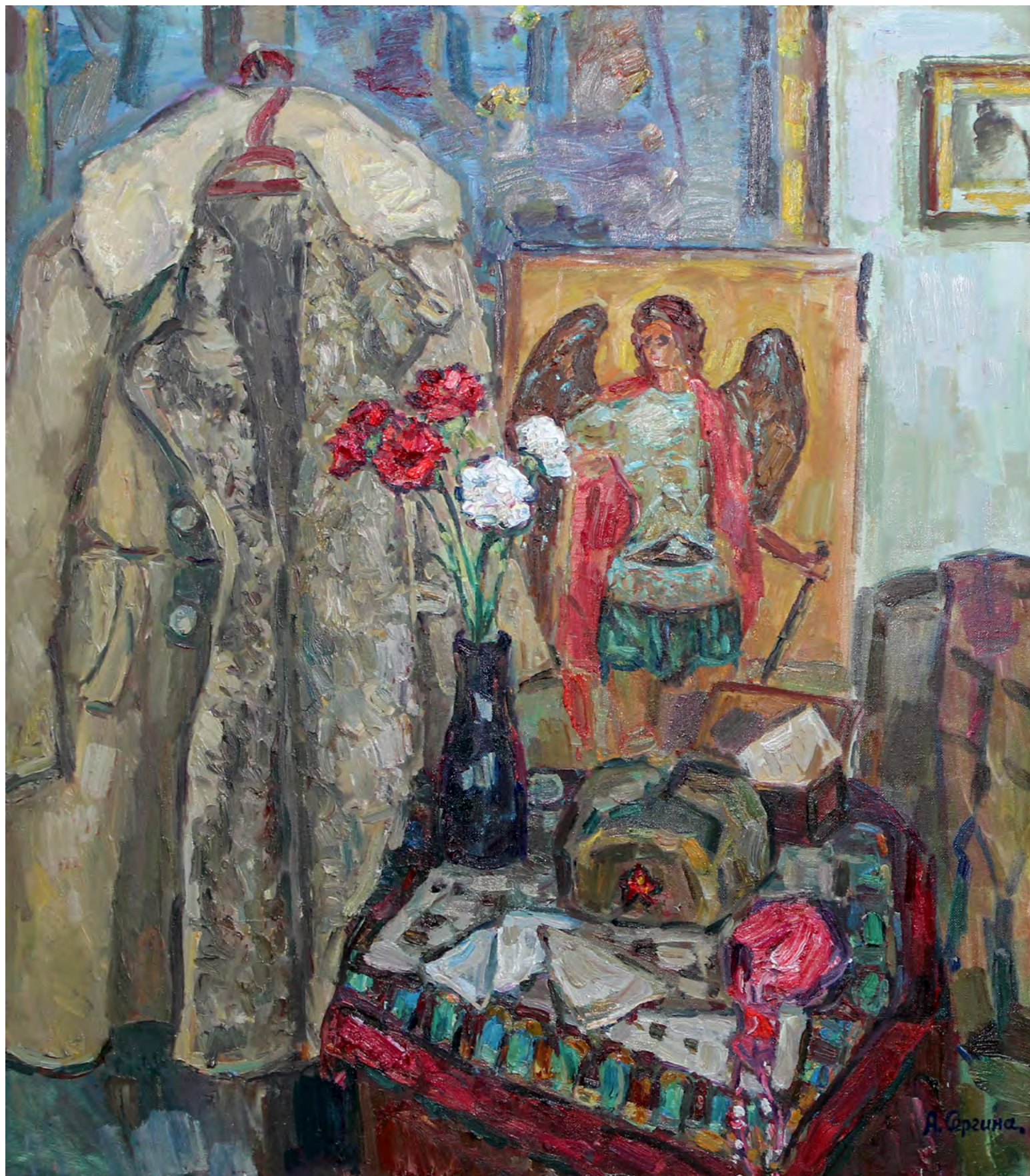
11. А.С. Сергина. Памяти военных дней. 2016. Холст, масло. 115 × 100. Собственность художника