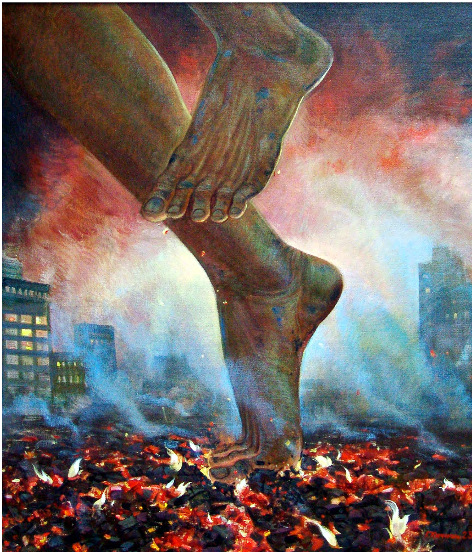
16. Г.П. Кичигин. Танец на углях. 2023. Холст, масло. 80 × 70. Собственность художника