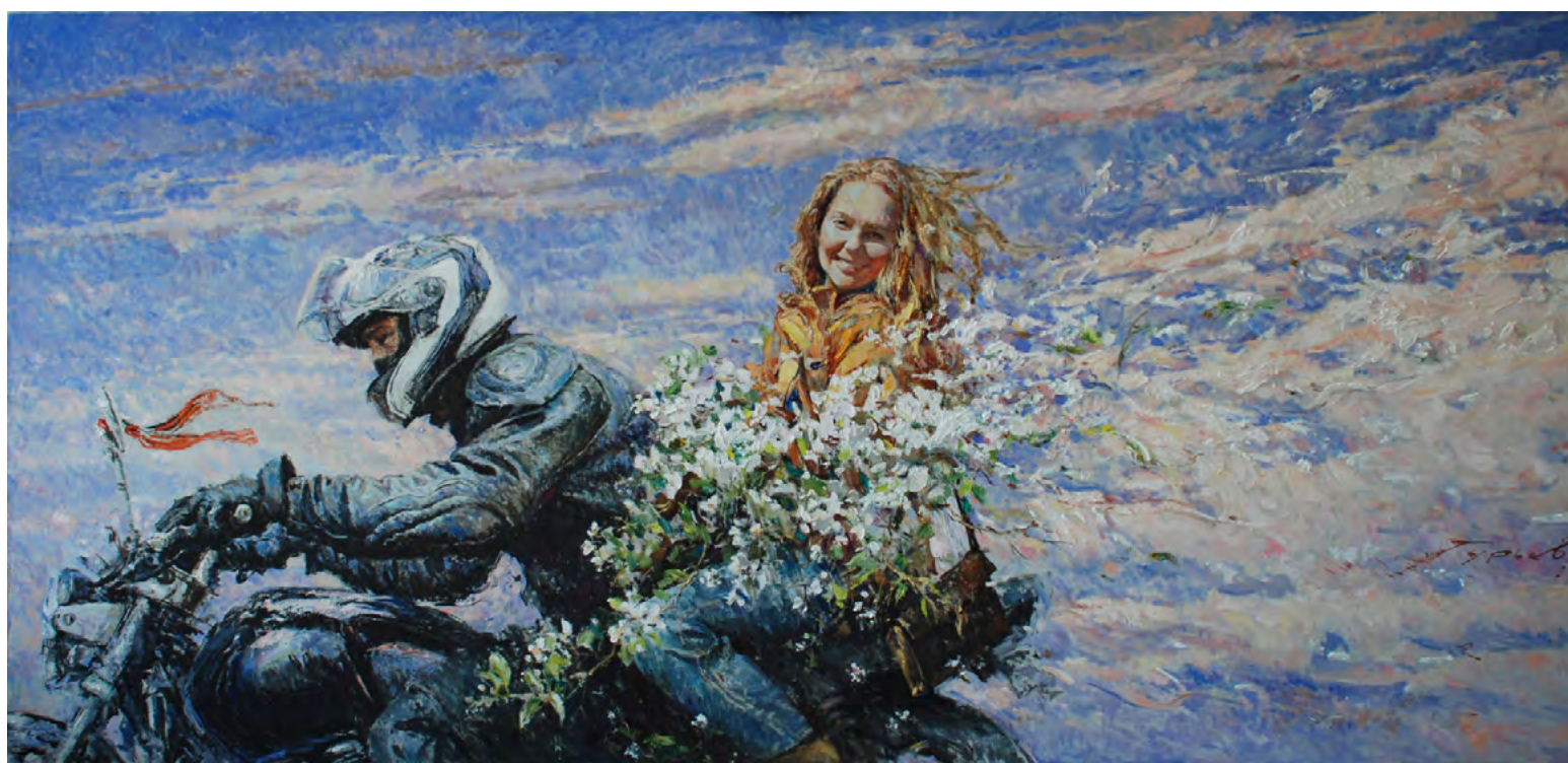
13. С.В. Гурьев. Весна. 9 мая. 2015. Холст, масло. 110 × 231. Собственность художника