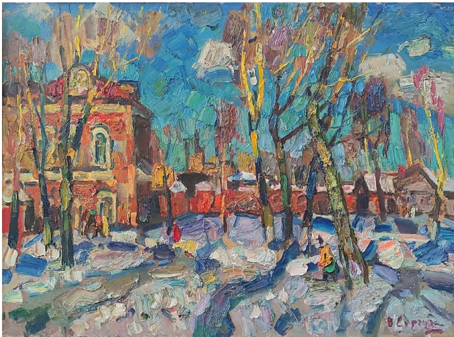
12. В.А. Сергин. Март. Военный госпиталь. 2020. ДВП, масло. 90 × 125. Собственность художника