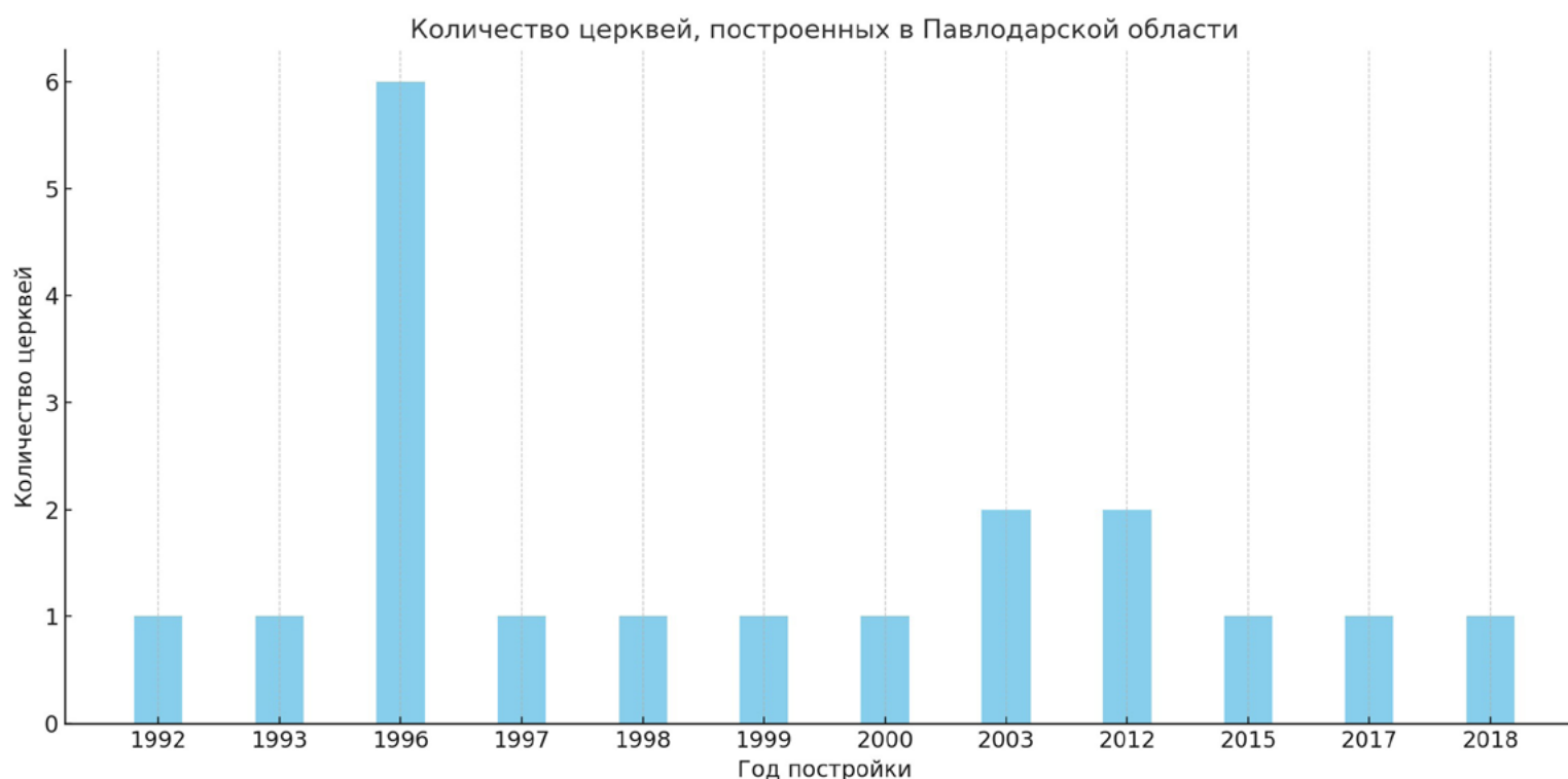
1. Количество возведенных церквей в Павлодарской области в 1992–2018 годах

Благовещенский собор в Павлодаре (ил. 2) является ключевым духовным и архитектурным центром Русской Православной Церкви в регионе. Его официальное открытие 23 октября 1999 года стало значимым событием в религиозной и культурной жизни города. Возведение собора началось в 1990 году по благословению архиепископа Алма-Атинского и Казахстанского Алексия, однако строительство вскоре приостановилось. Лишь в 1998 году, благодаря поддержке местных властей, работы были возобновлены, и уже к следующему году храм был полностью завершен. 22 октября 1999 года архиепископ Алексий совершил чин великого освящения, после чего состоялось торжественное открытие, собравшее представителей духовенства и городского руководства.