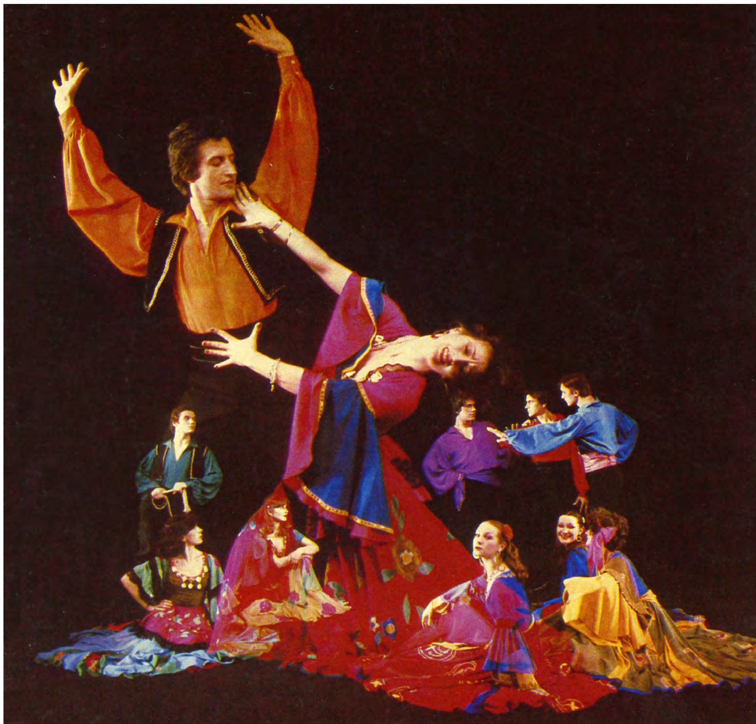
6. Танцевальная сцена «Цыганский танец». Государственный ансамбль танца России. 1981.

от выступления, — это рисунок движения артистов, перемещение костюмов в пространстве, — рассказывает Мария Владиславовна. — Костюмы — это мазки, а сцена — мой холст. Картина всякий раз меняется, живет».