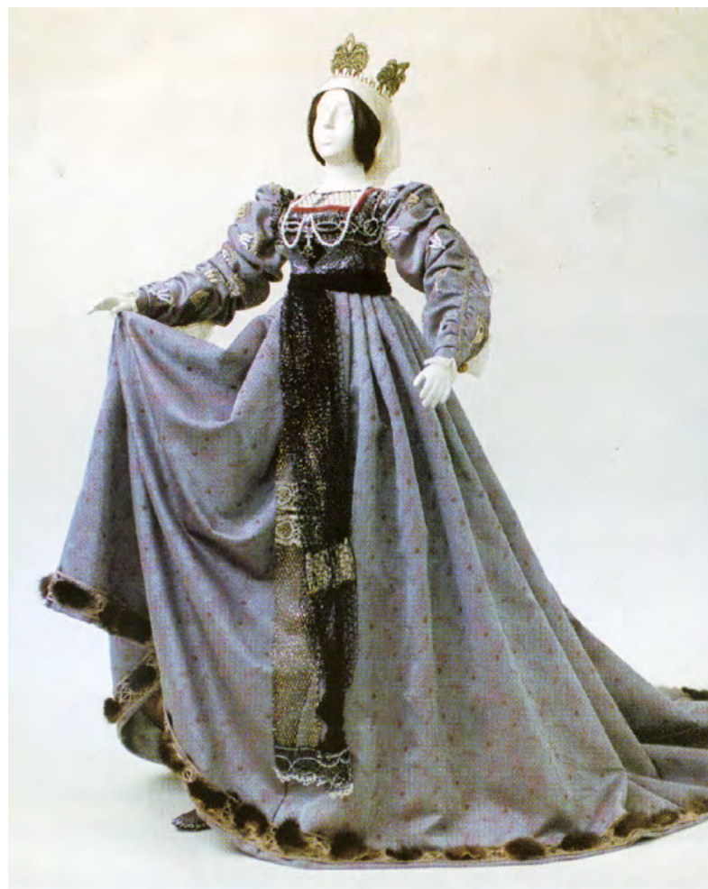
13. М.В. Фёдорова. Изабелла Испанская. Эскиз куклы. 1999. Бумага, гуашь, аппликация. Собрание семьи художника