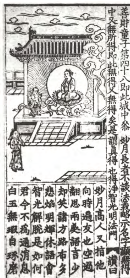
1. Сучандра в пантеоне Астасакшрика