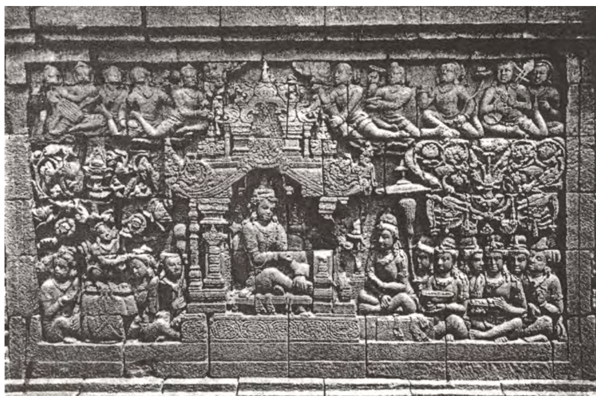
3. Рельефное изображение Сучандры на главной стене второй галереи буддийского святилища Боробудур, остров Ява [5, vol. 1, part II, p. 122].

великих Дхармараджей, которому сопутствовали двадцать пять царей Кулики из Шамбалы.