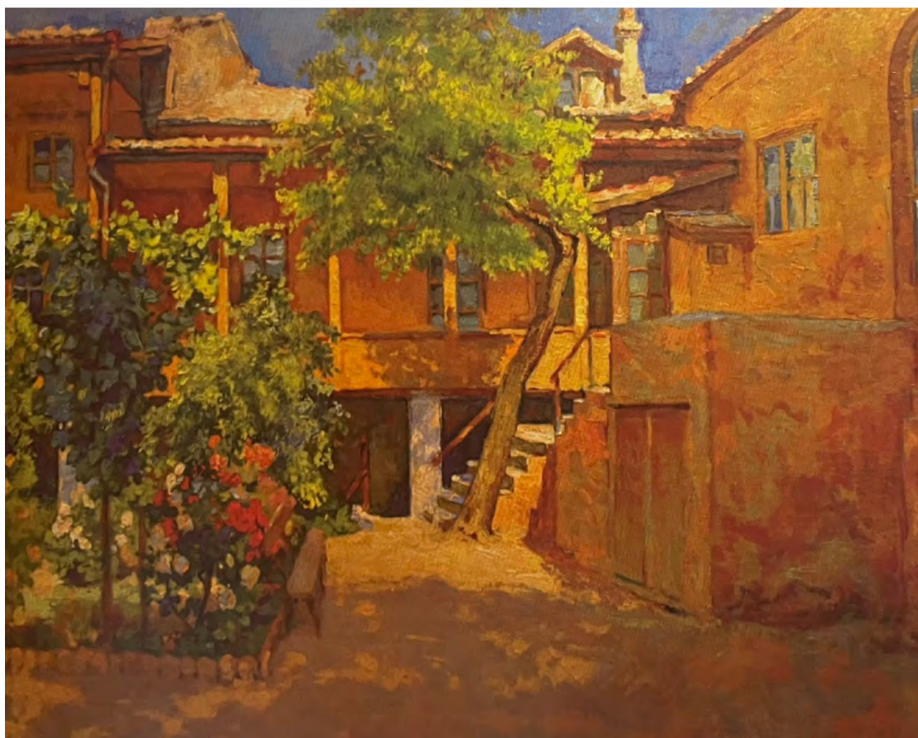
Фото: [1, с. 113]