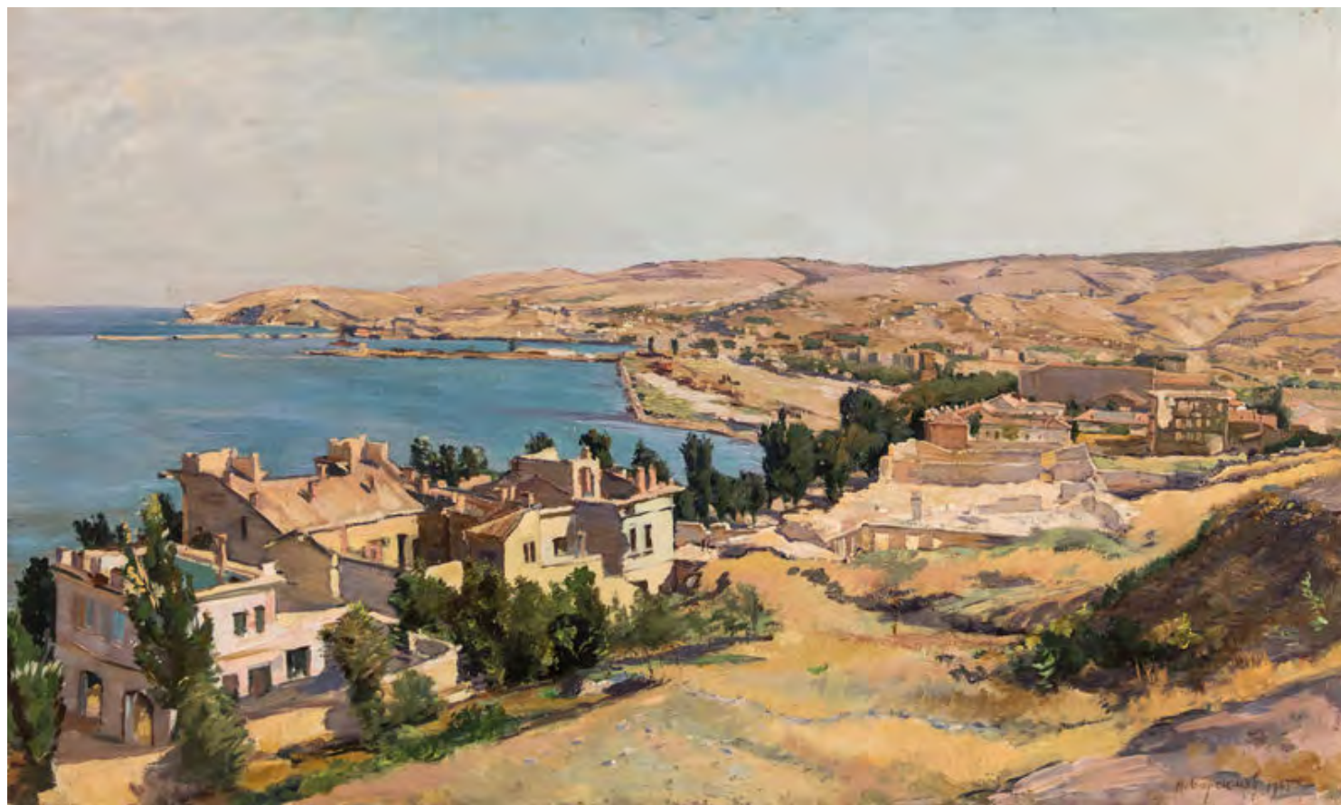
7. Н.С. Барсамов. Курортный район Феодосии после оккупации Крыма.