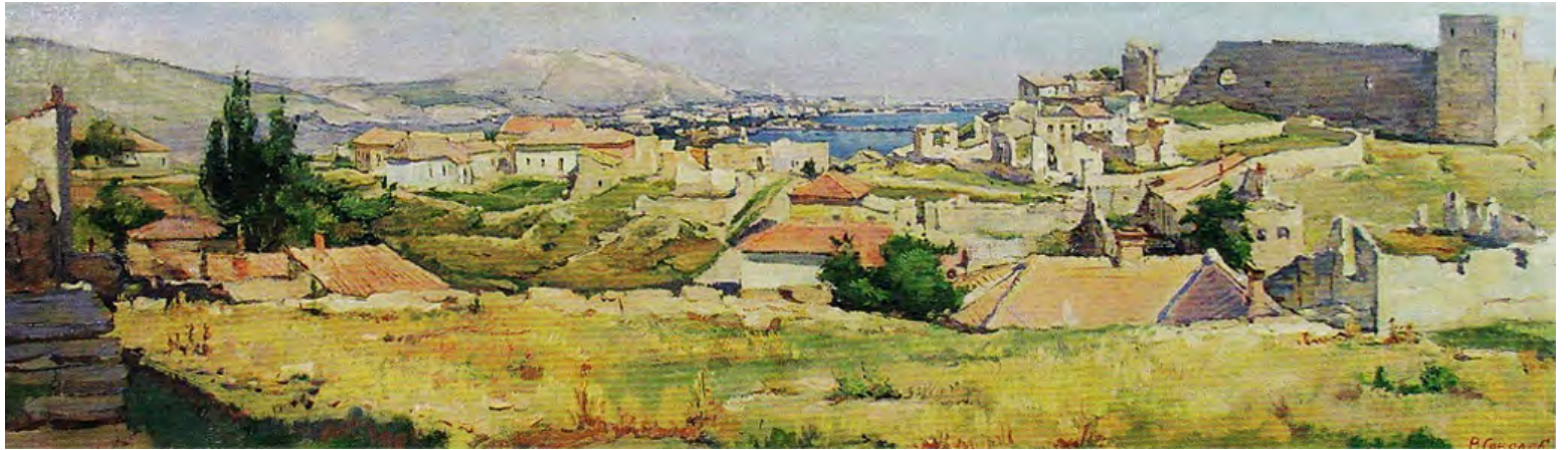
Фото: [2, с. 50]