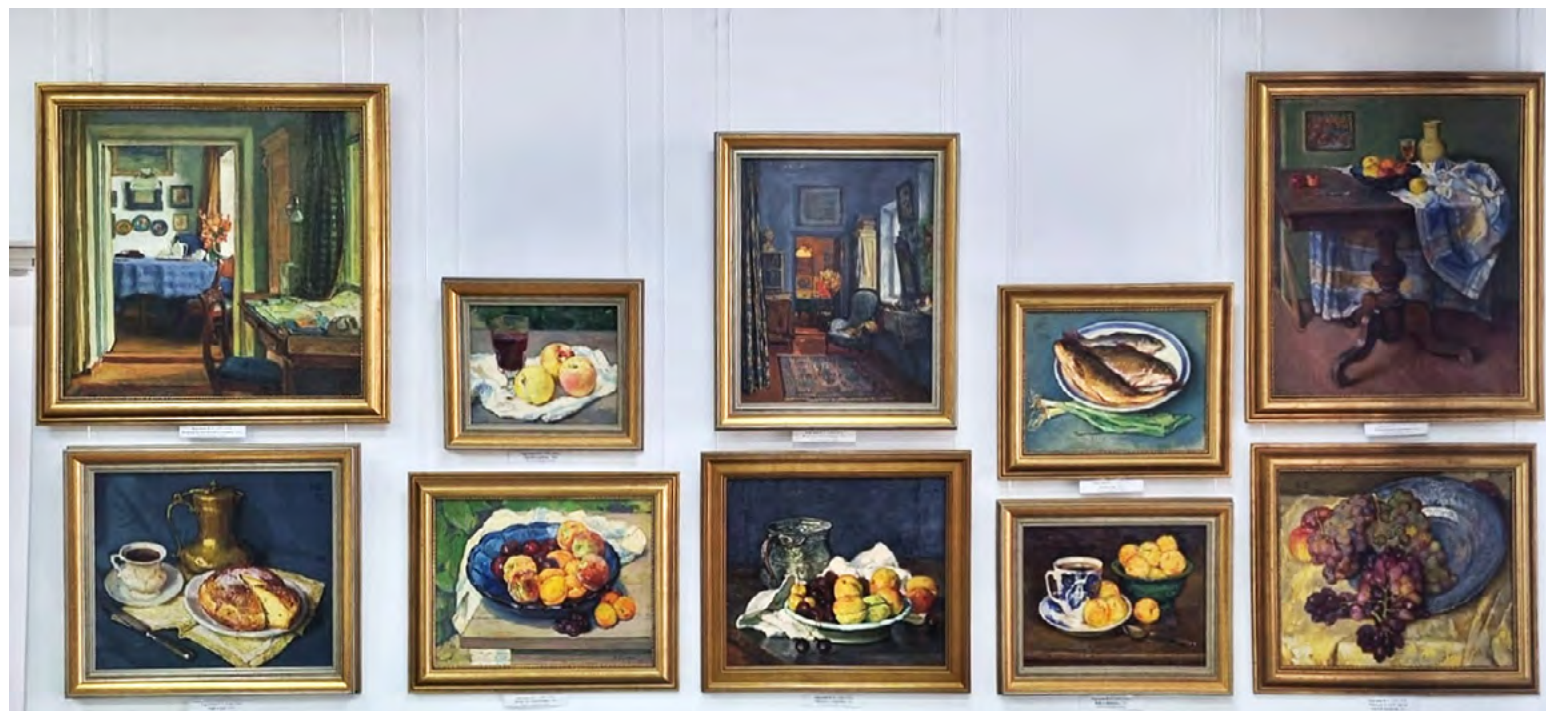
3. Натюрморты Н.С. Барсамова на выставке «Патриот Крыма: к 140-летию со дня рождения А.И. Полканова из собрания Симферопольского художественного музея» в Судакском городском историческом музее, 2024