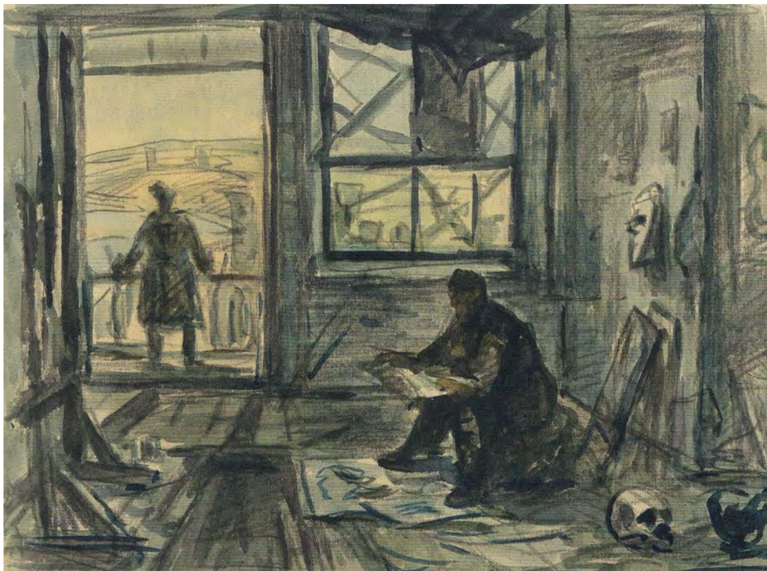
11. В.А. Соколов. Мастерская художника Н. Барсамова. Феодосия. 1940-е. Бумага, акварель. 20 × 27. Частное собрание. Фото: [2, с. 101]