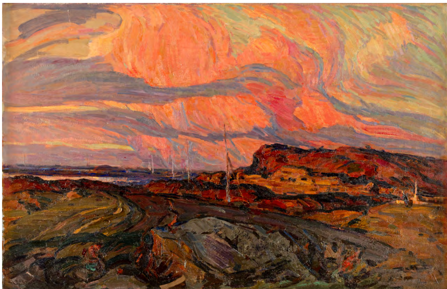
12. В.А. Соколов. Изрытая земля. 1968–1969. Холст, масло. 66 × 104. Севастопольский художественный музей имени М.П. Крошицкого. Фото: [2, с. 95]