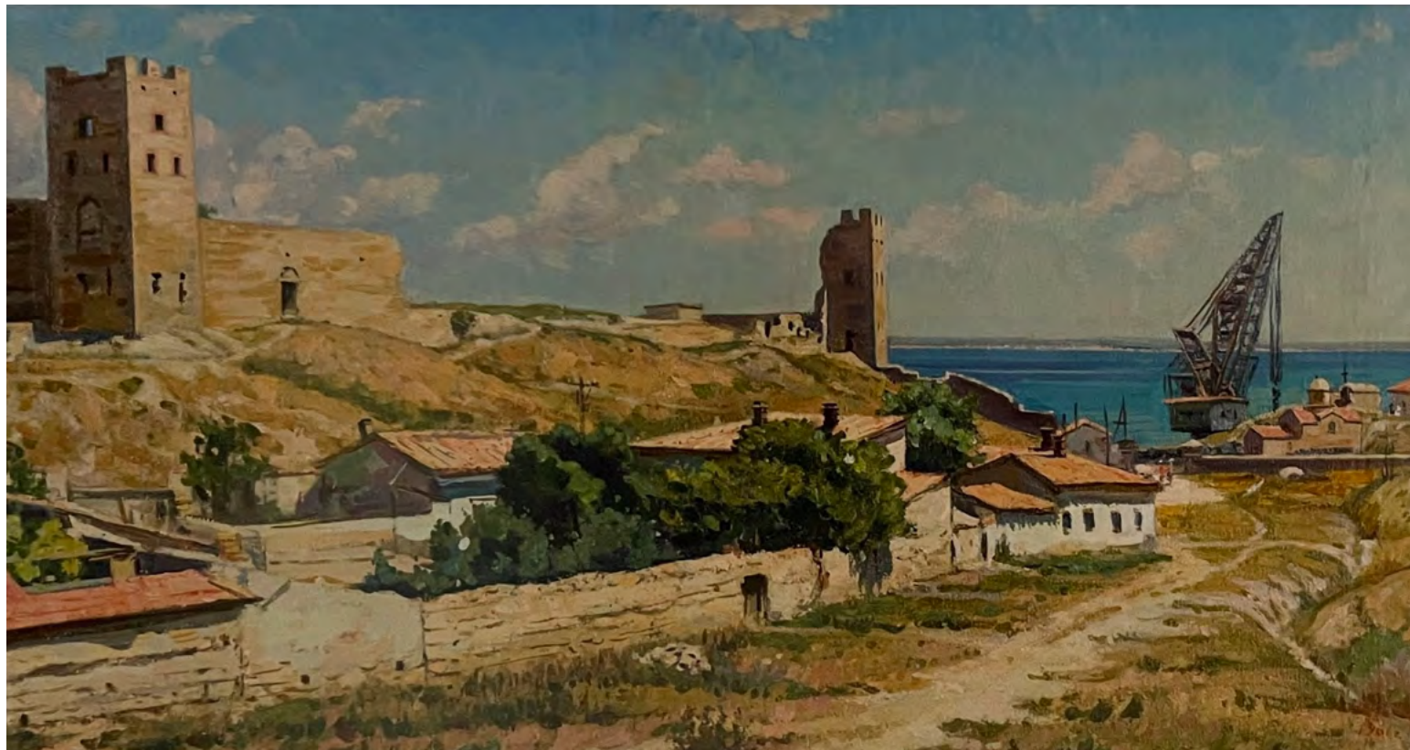
15. Н.А. Шорин.