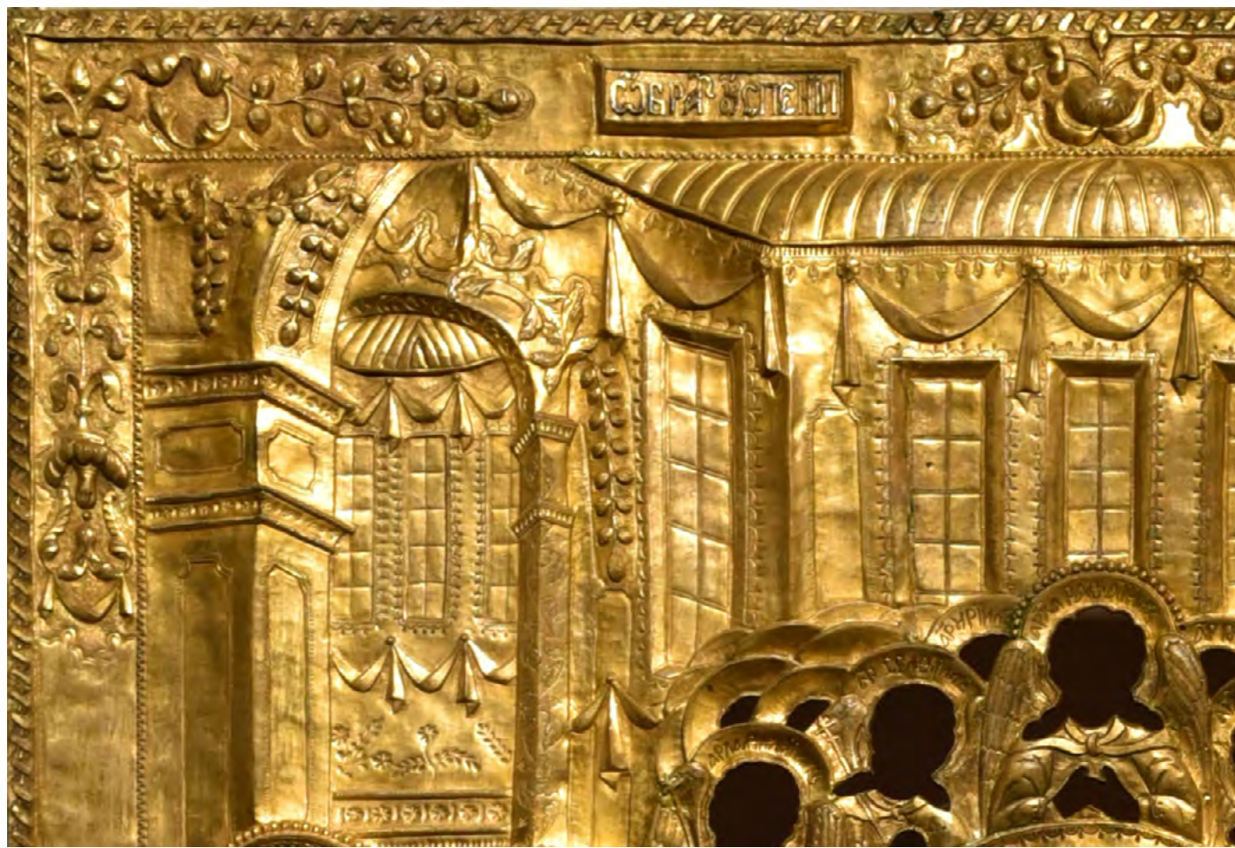
2. Оклад на икону «Успение».