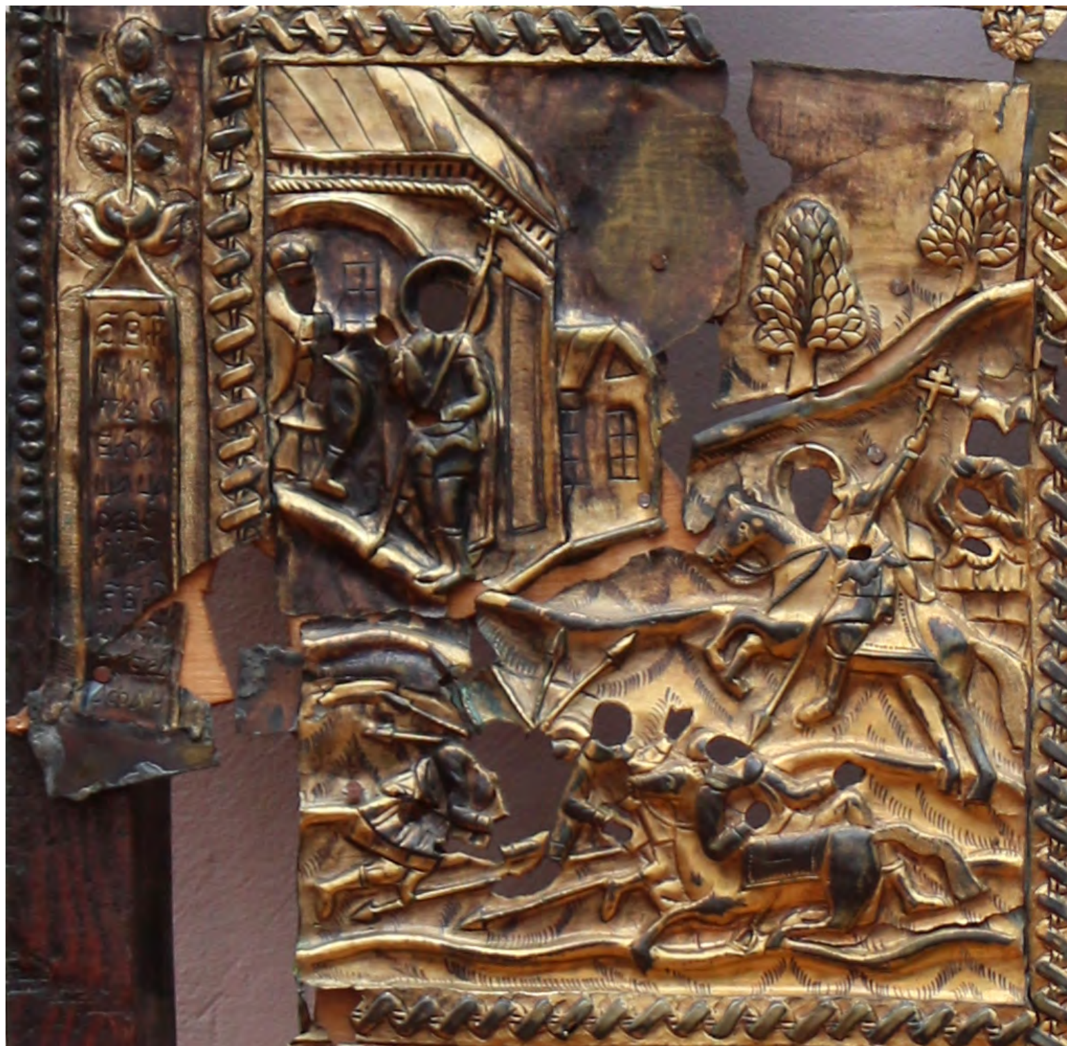
11. Оклад на икону «Никита-воин в житии». Фрагмент: битва. Конец XVIII в. Ветковский музей старообрядчества и белорусских традиций

это начало жизни. Второй ряд — зрелые свершения, подвиги в христианском образе, жизнь-путешествие по разным странам. Третий ряд — «вечерние события»: явление звезды Мариану, поход и обретение мощей его друга Никиты, принесение тела Никиты в дом Мариана. Нижний ряд — события по смерти: чудеса от мощей, возведение церквей, перенос мощей Никиты в Константинополь. И архетипический «низ», «Тот свет», хтонический ярус пространственно расположен глубоко под нами.