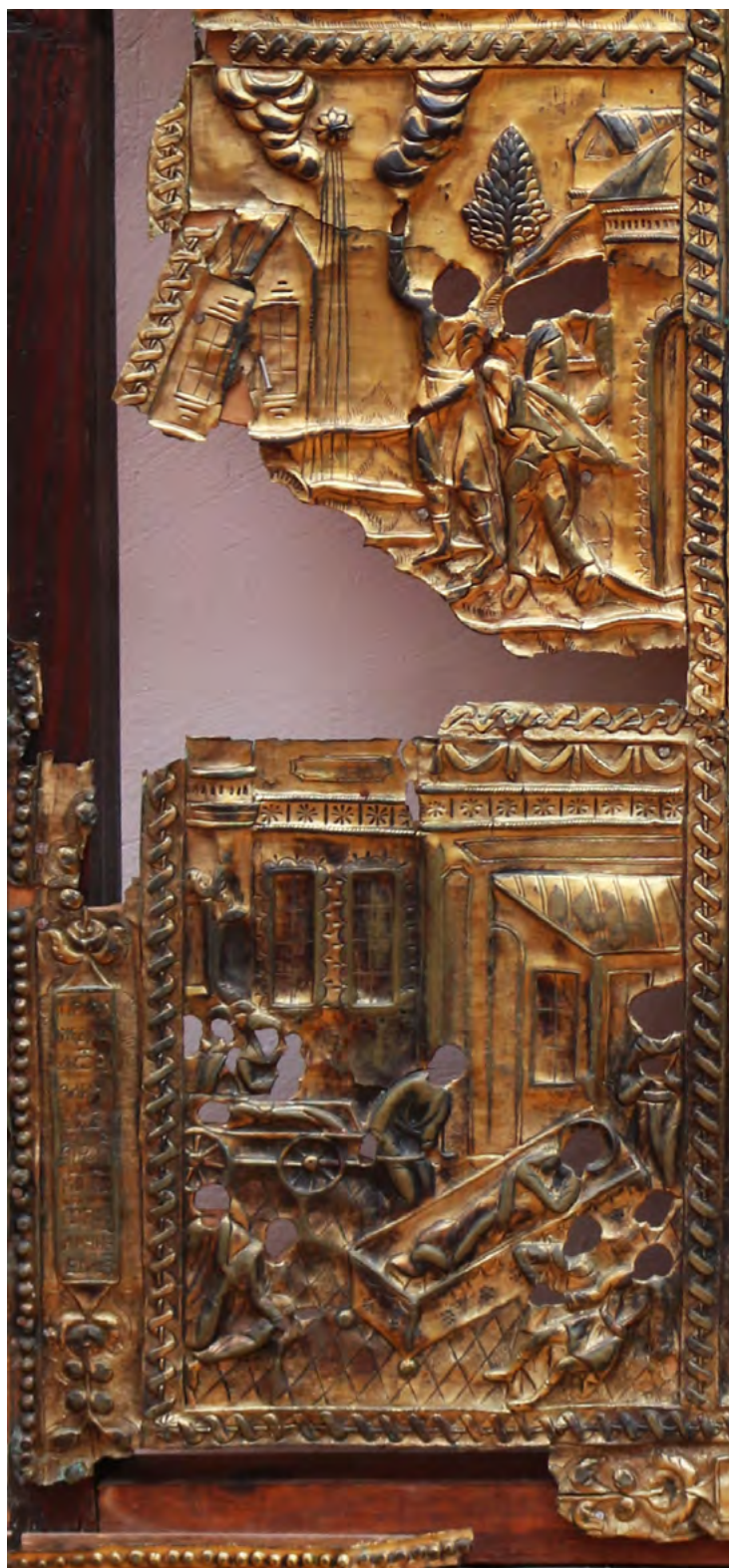
14. Оклад на икону «Никита-воин в житии». Фрагмент: обличение Атанариха-Афанариха и казнь Никиты; Мариан, ведомый звездой, несет тело Никиты домой в Киликию. Конец XVIII в. Ветковский музей старообрядчества и белорусских традиций