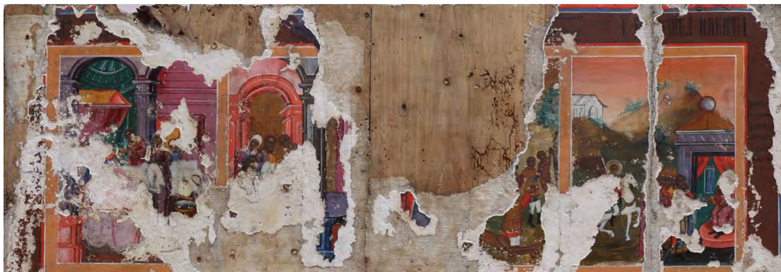
9. Икона «Никита-воин в житии».