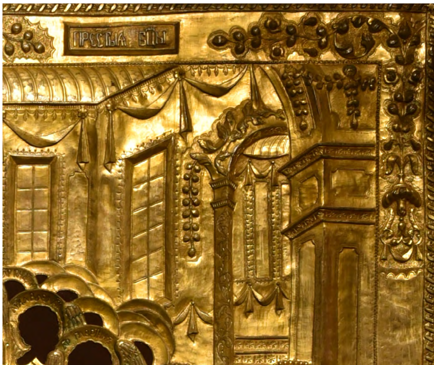
3. Оклад на икону «Успение».

Ветковский музей старообрядчества и белорусских традиций