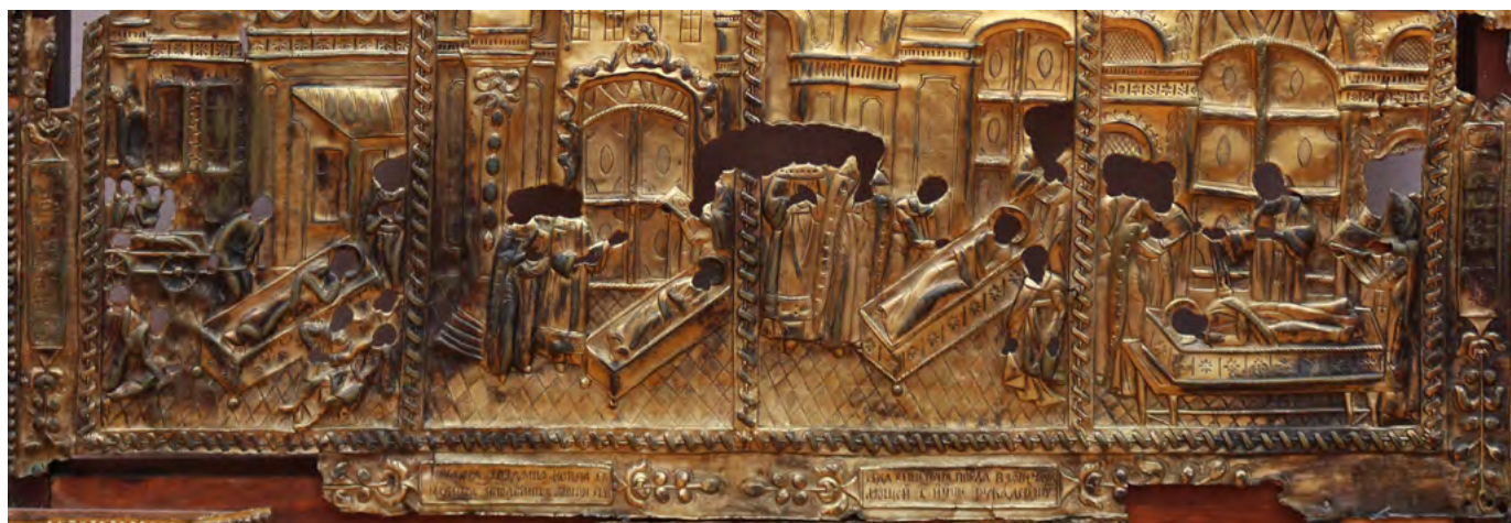
17. Икона «Никита-воин в житии». Фрагмент: фон клейм — утреннее и дневное небо.

Конец XVIII в. Ветковский музей старообрядчества и белорусских традиций