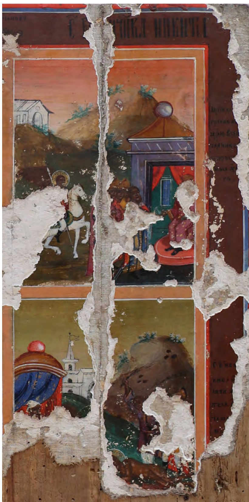
18. Икона «Никита-воин в житии». Фрагмент: фон клейм, цвет неба изменяется к вечернему сюжету.

Конец XVIII в. Ветковский музей старообрядчества и белорусских традиций