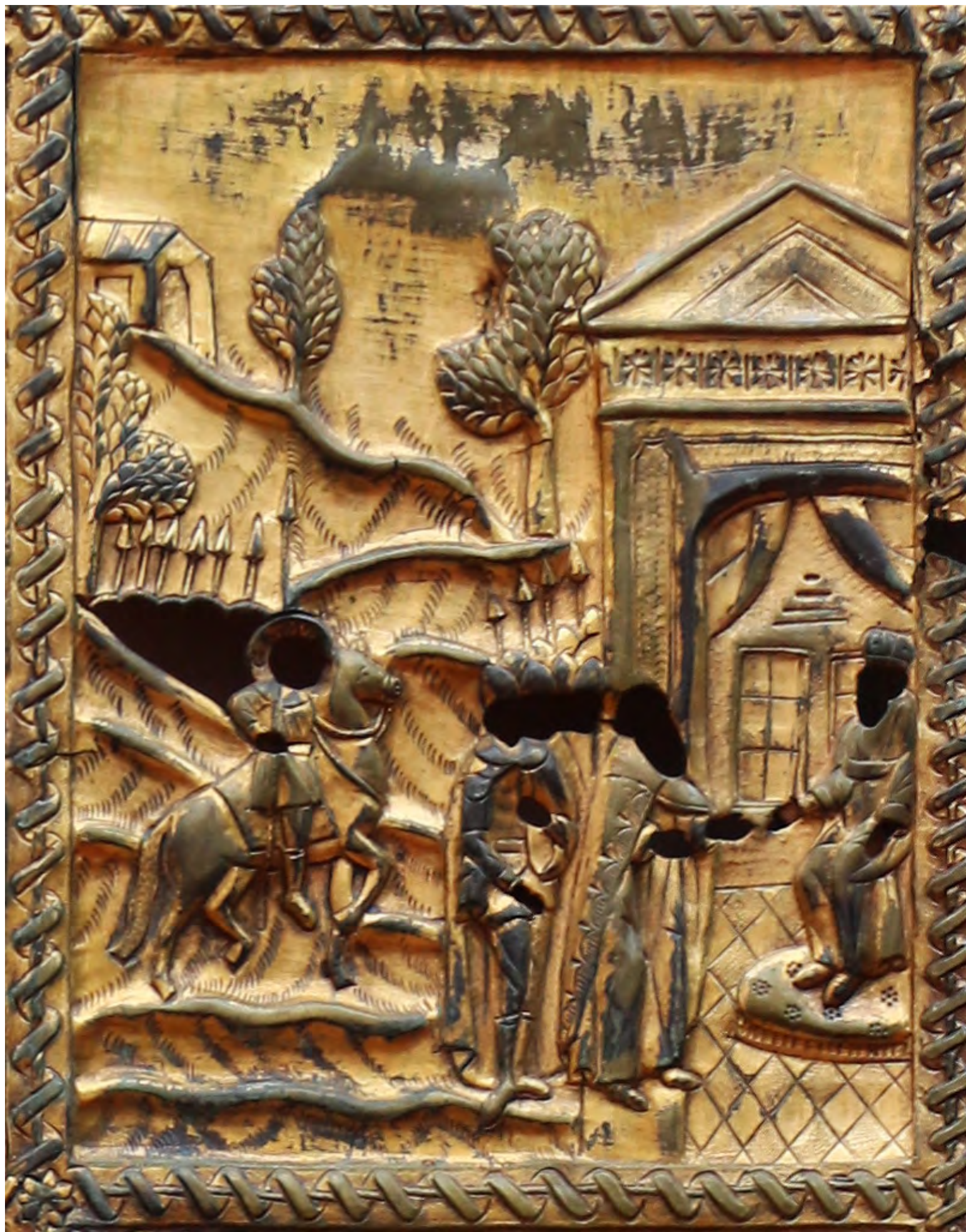
13. Оклад на икону «Никита-воин в житии». Фрагмент: посольство к греческому царю. Конец XVIII в. Ветковский музей старообрядчества и белорусских традиций