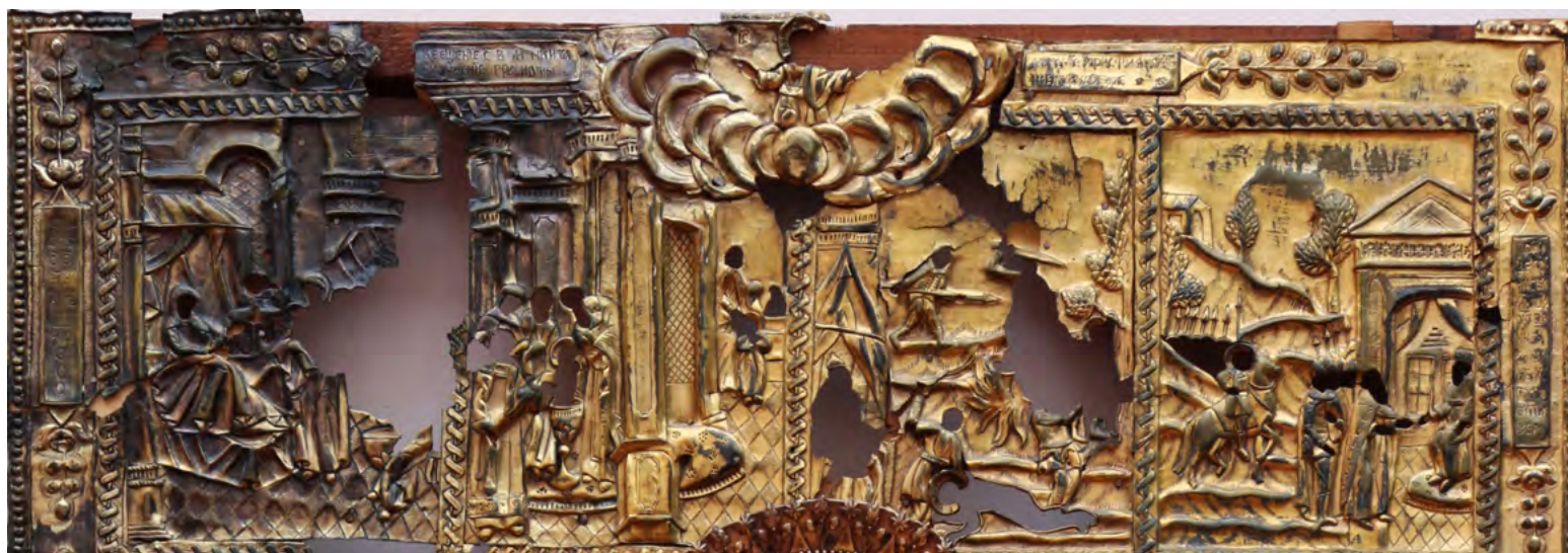
10. Оклад на икону «Никита-воин в житии».

Конец XVIII в. Ветковский музей старообрядчества и белорусских традиций