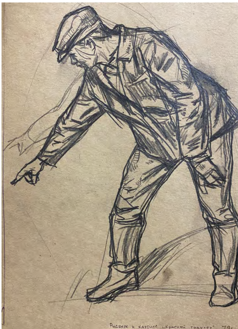
10. Г.Ф. Борунов. Кольцов Саша. Рисунок к картине «Красный трактор». 1979.

Бумага, карандаш. 52,5 × 39,8. Архив семьи Г.Ф. Борунова.