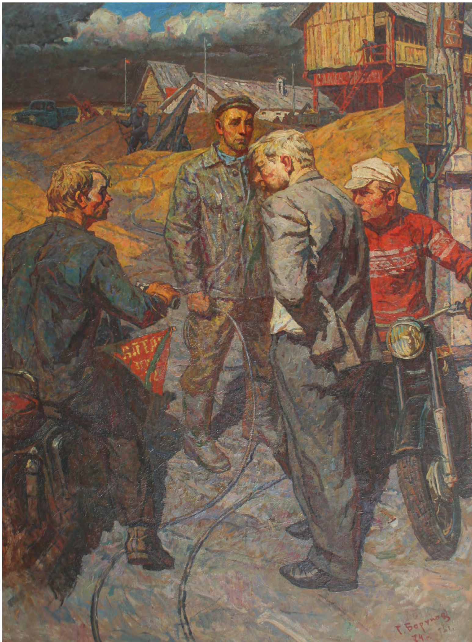
1. Г.Ф. Борунов. Председатель. Колхозная осень. 1973–1974. Холст, масло. 195 × 145. Государственный художественный музей Алтайского края