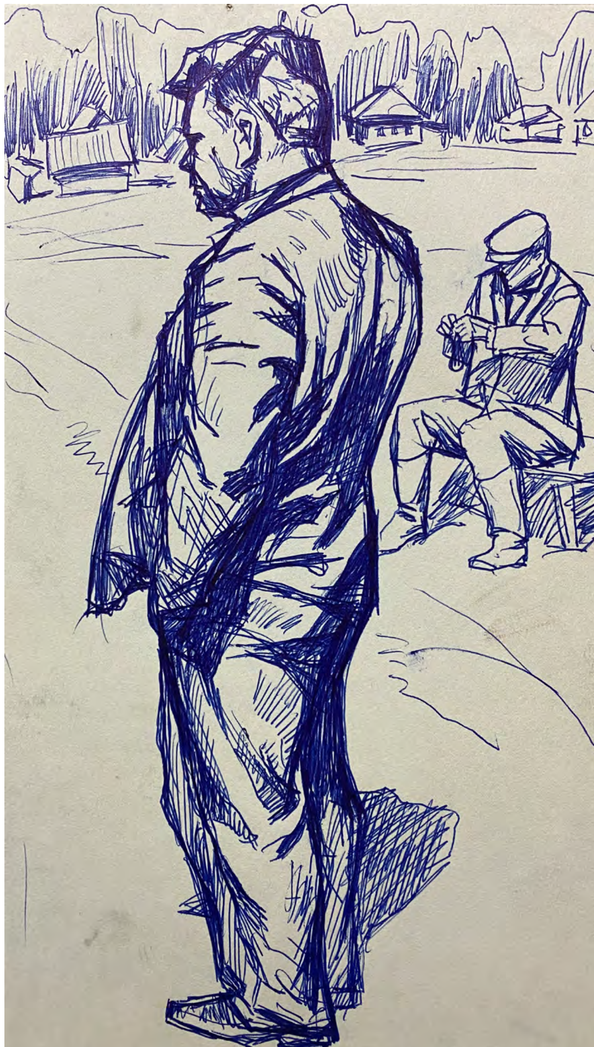
2. Г.Ф. Борунов. Рисунок к картине «Председатель. Колхозная осень».