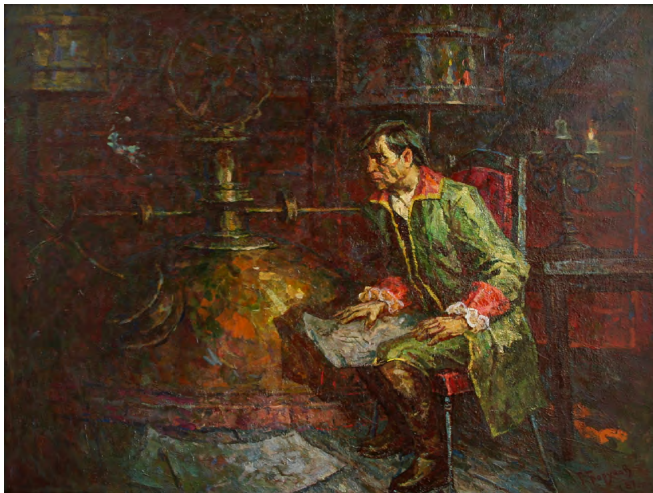
14. Г.Ф. Борунов. Иван Ползунов. 1987. Холст, масло. 102,8 × 137,4. Государственный художественный музей Алтайского края