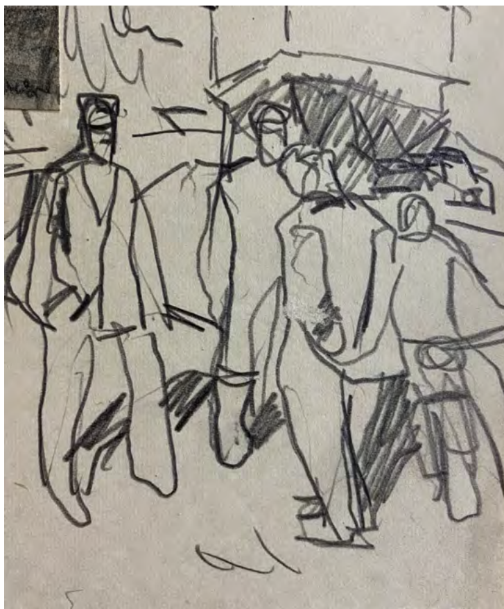
3. Г.Ф. Борунов. Рисунок к картине «Председатель. Колхозная осень». Архив семьи Г.Ф. Борунова.