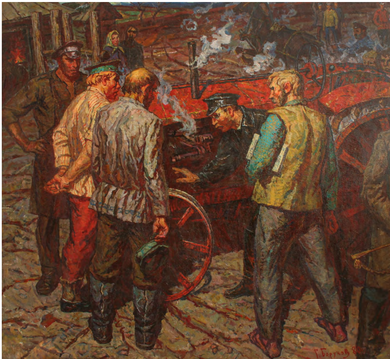
7. Г.Ф. Борунов. Красный трактор. 1980. Холст, масло. 195 × 205. Государственный художественный музей Алтайского края

к крестьянскому труду, видел, что силы, которые они отдают родной земле, абсолютно бескорыстны. В рамках коллективизации, в соответствии с декретом «О едином тракторном хозяйстве», с целью совершенствования производительности в села доставлялись тракторы. Первый из них прибыл на Алтай в 1922 году по указанию В.И. Ленина. По железной дороге он был доставлен в Славгород, откуда уже своим ходом отправился в коммуну «Свобода» Родинского района. В конце 1920-х в селах начинают создаваться МТС — машинно-тракторные станции для выпуска «железных коней», обеспечения квалифицированного технического обслуживания техники. Помимо очевидных преимуществ нововведений (облегчения