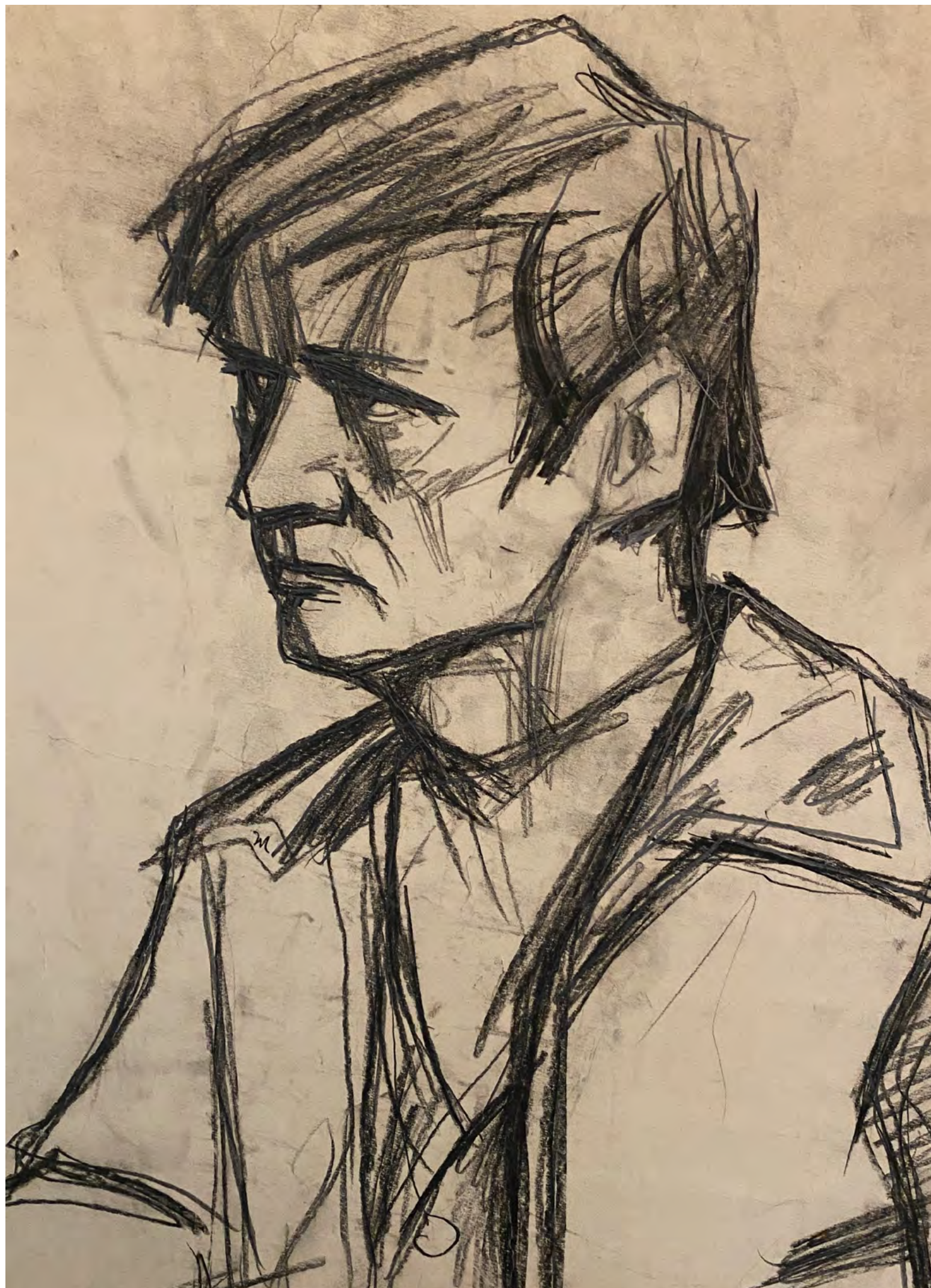
16. Г.Ф. Борунов. Рисунок к картине «Иван Ползунов». 1974. Бумага, картон, уголь. 43,5 × 33. Архив семьи Г.Ф. Борунова.