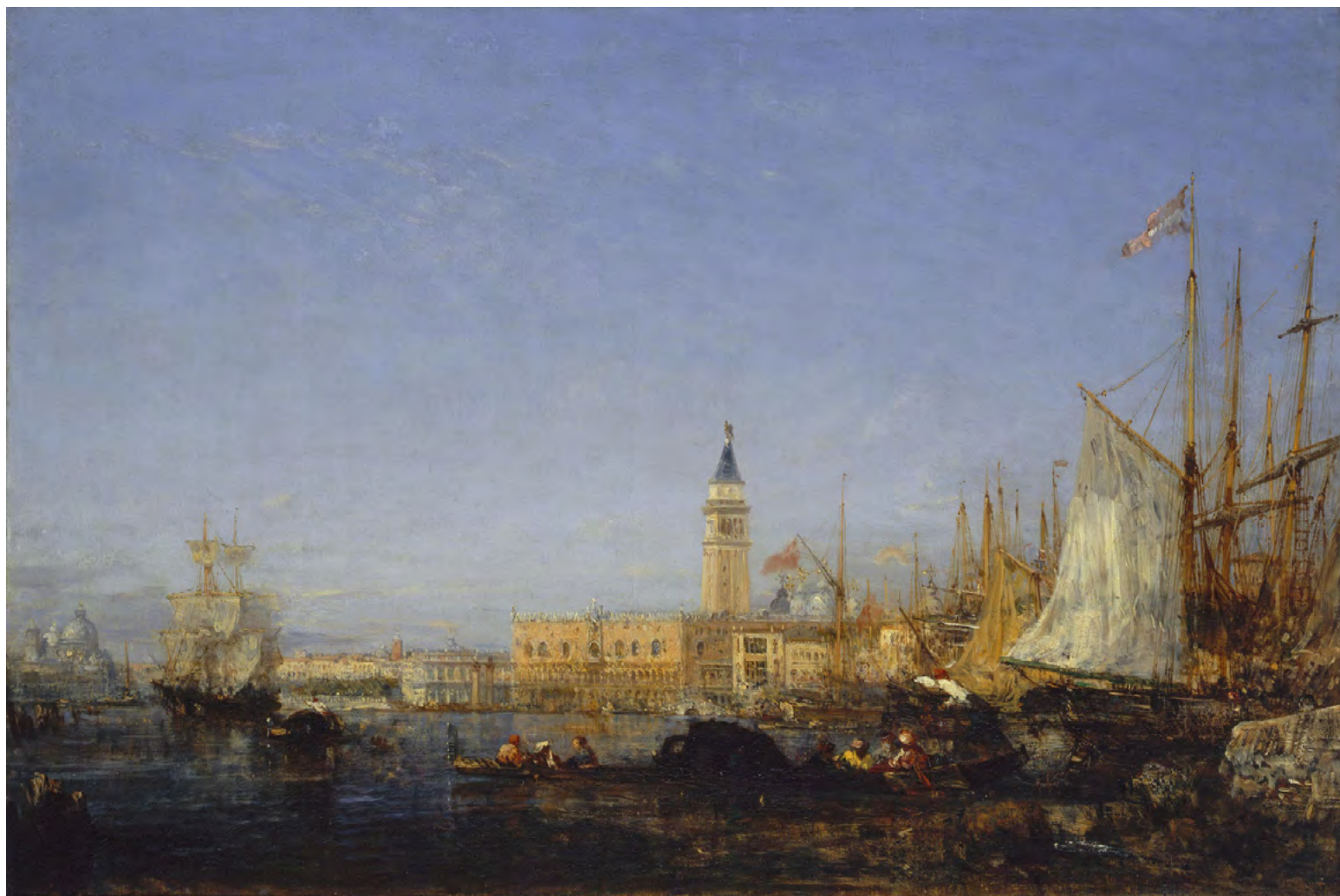
9. Феликс Зим.