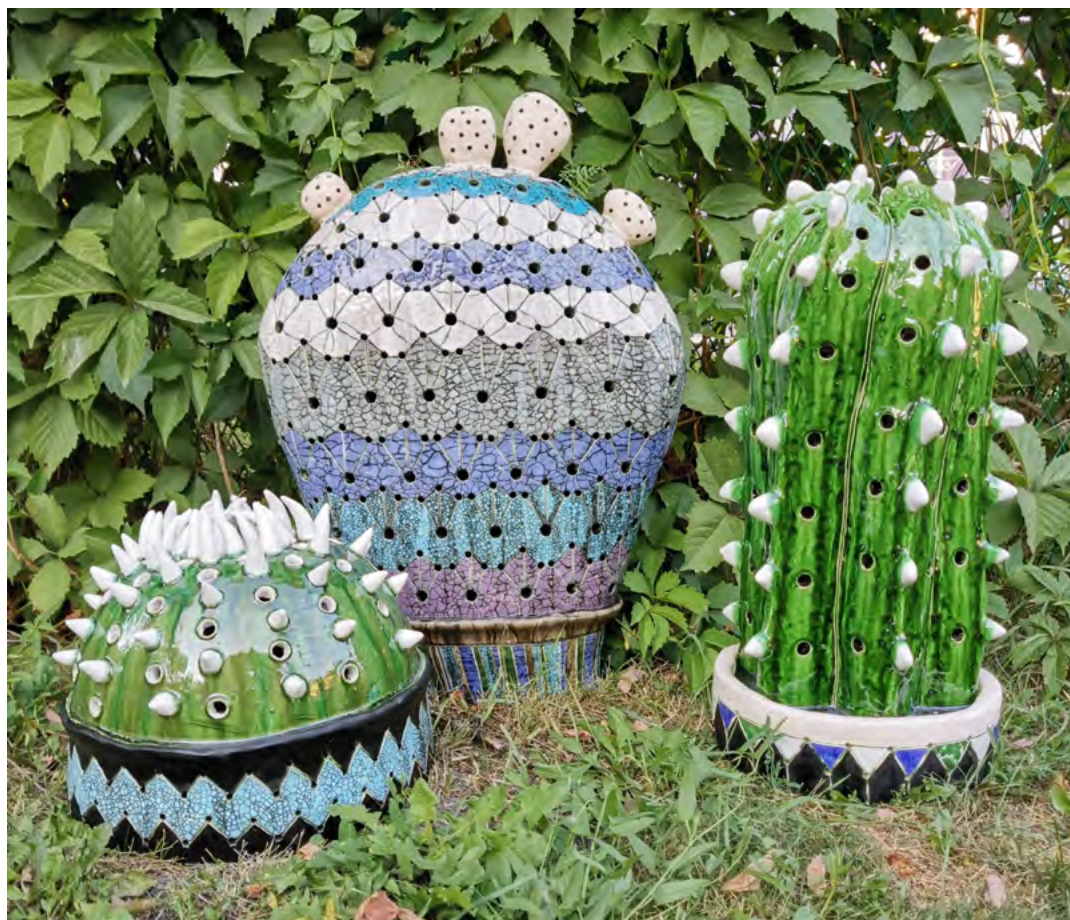
2. Лилия Андреевна Хасанова.