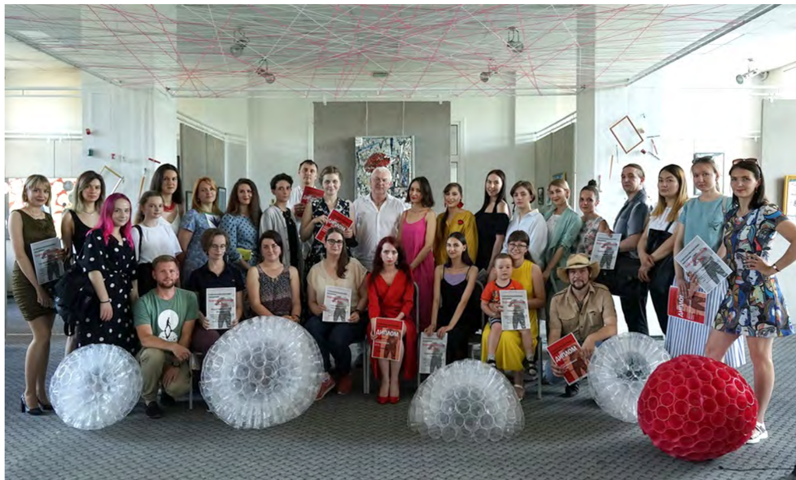
5. Участники II Областной выставки-конкурса молодых омских художников на фоне инсталляции «Розовое небо».

Выставочный зал Дома художника, Омск. 2021.