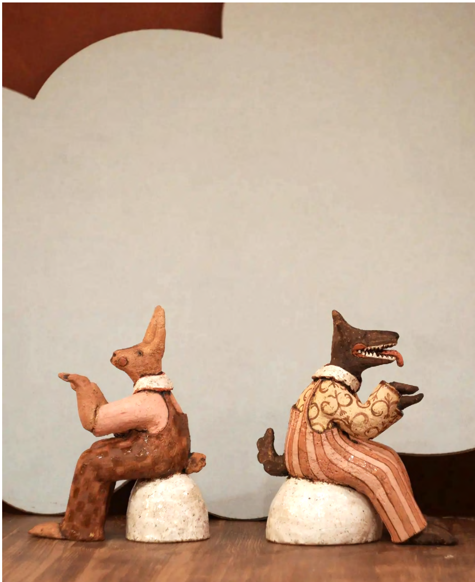
9. Юлия Вячеславовна Воронина. Первый снег. 2022. Шамот, ангоб, глазурь. 25 × 18, 22 × 19. Собственность художника